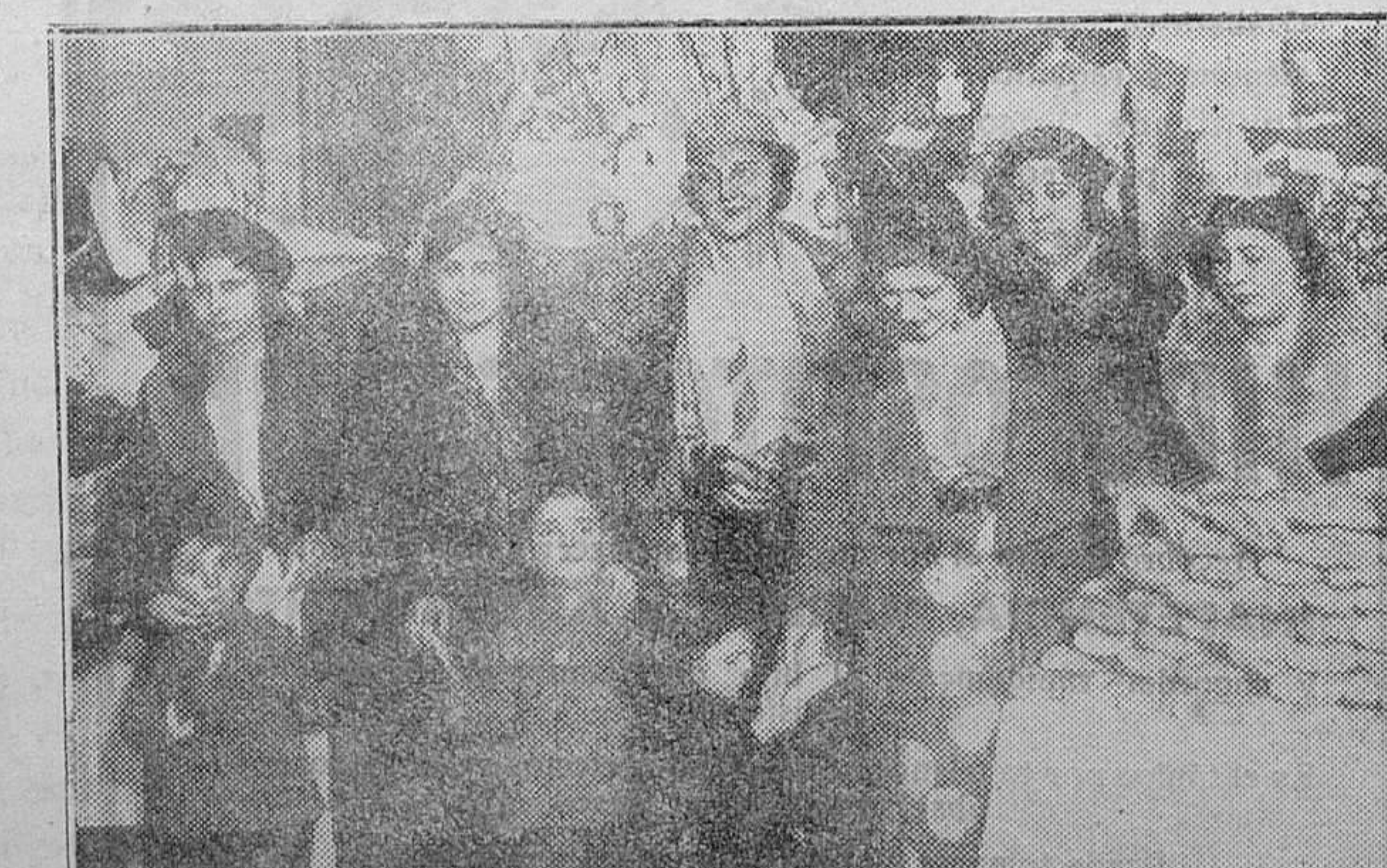
MADRID.—Reparto de ropas y meriendas a los niños en el Colegio del Sagrado Corazón, con motivo de la festividad de Reyes