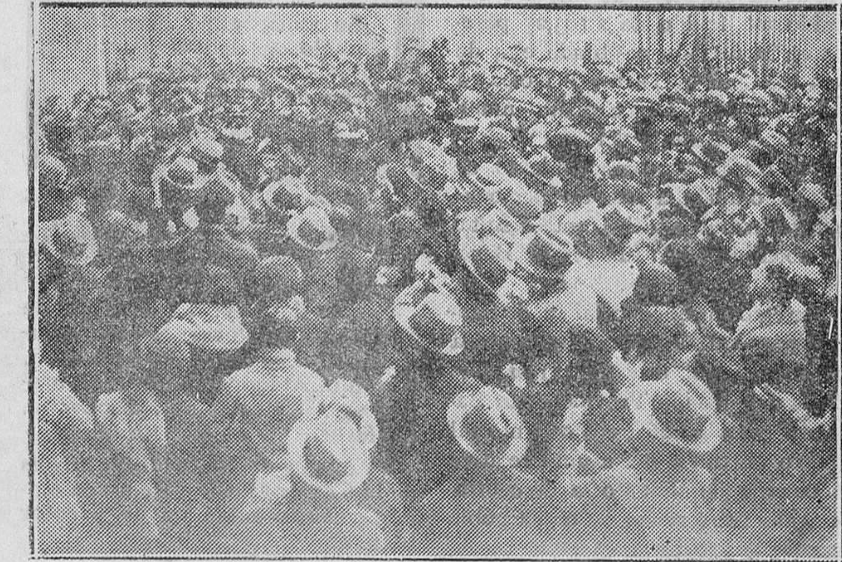
MADRID. — El público en la puerta de la Iglesia de la Concepción, aplaudiendo al Director de la Guardia Civil, general Sanjurjo

del discurso del señor Maura: la culpabilidad que achacó a católicos y monárquicos en la génesis de la jornada vergonzosa del 11 de mayo, y el calificativo de traidores que aplicó a las Cortes, si aprueban reformas para las cuales, no se consultó al cuerpo electoral, tal el Estatuto de Cataluña.