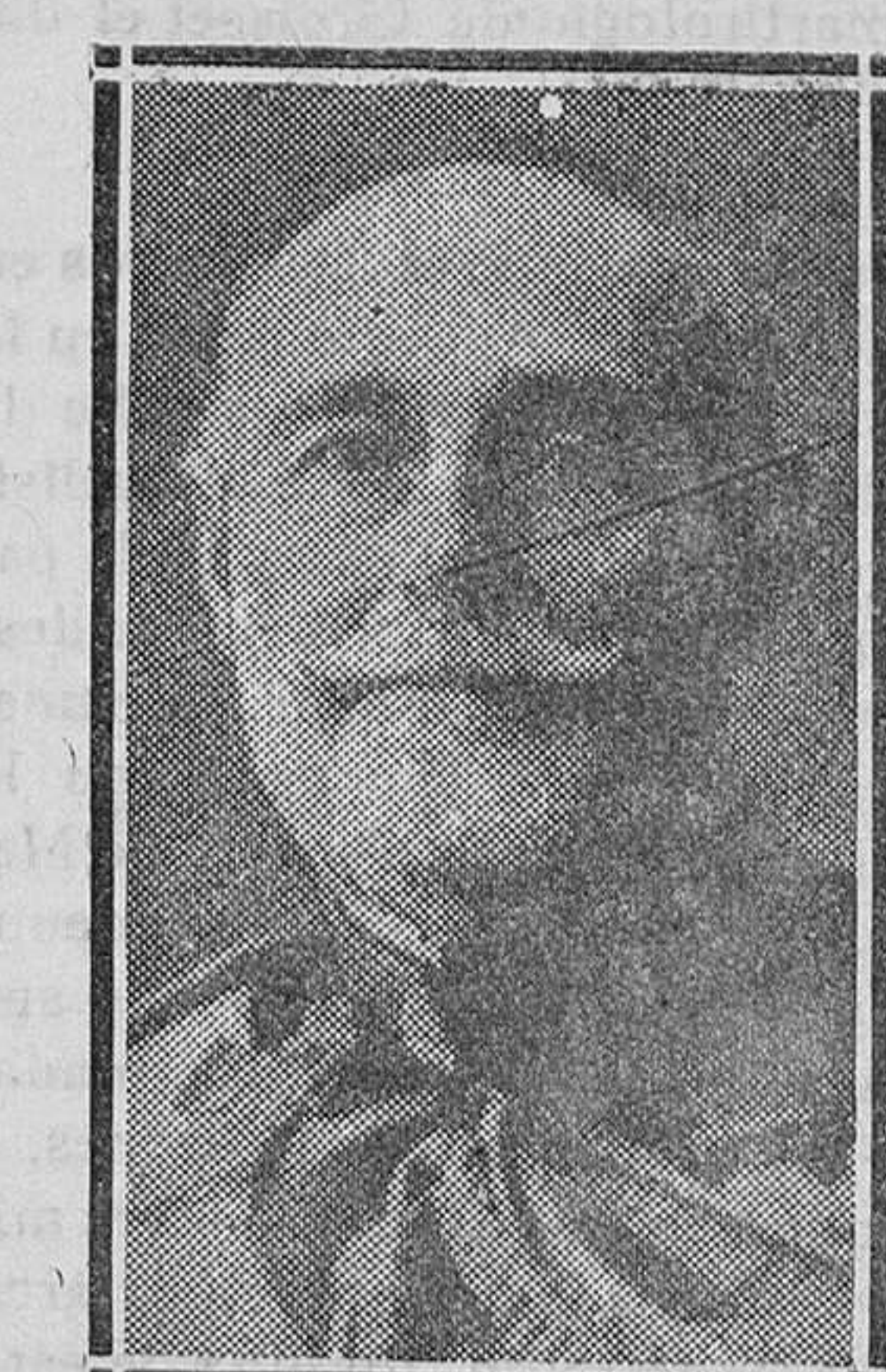
El almirante don Juan de Carranza y Garrido, fallecido en Madrid, y una de las figuras más destacadas de nuestra Marina de Guerra, en la que ha desempeñado elevados cargos

Un compañero de Gobierno autoriza al Ateneo para que en su cara pida su destitución fulminante, y en vez de salir al paso al mal compañero coautor de aquella puñalada trapera que le tiran, y plantear la disyuntiva entre la permanencia de ambos en el Gobierno provisional, lo tola todo, calla y sigue. Se ve desautorizado en pleno desarrollo de la vandálica jornada y pasa por la desautorización y calla y sigue.