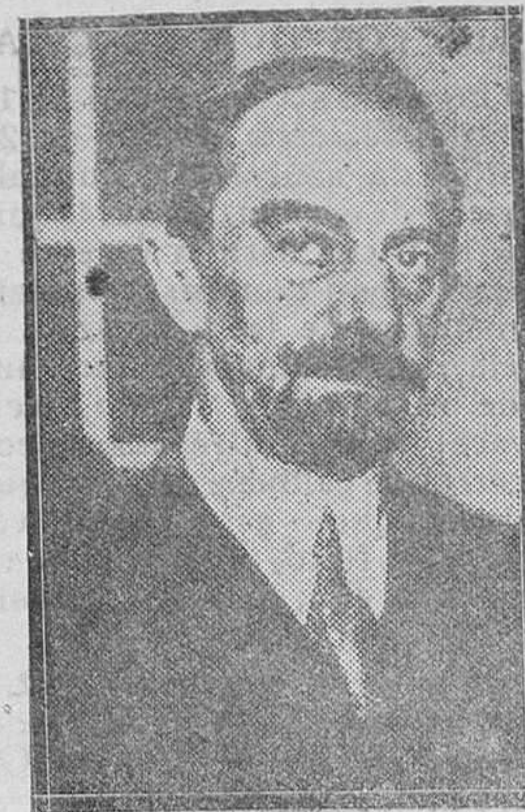
El señor Moles, nuevo Gobernador civil de Barcelona