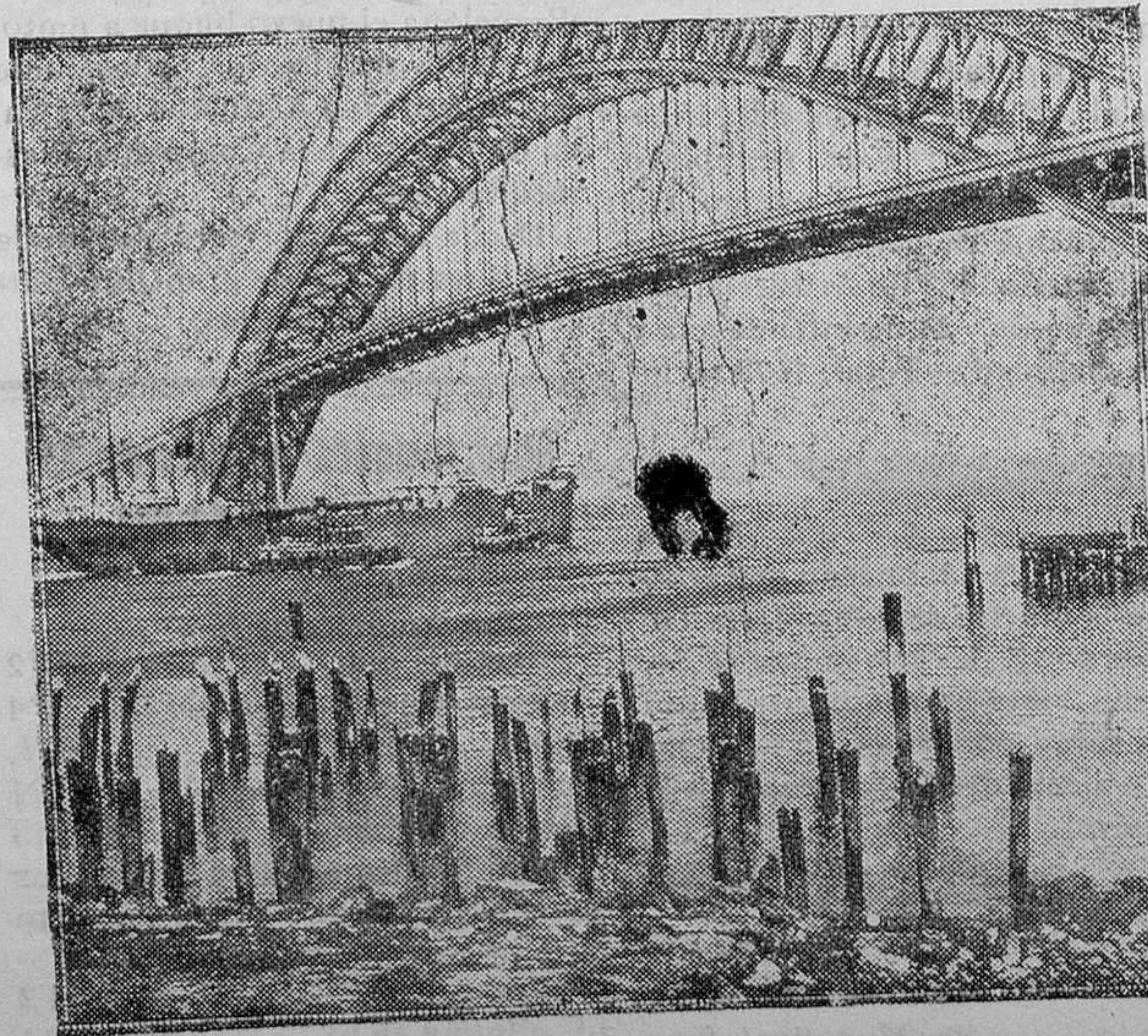
El puente más grande del mundo, abierto recientemente al tráfico, levantado sobre el río Hudson, para unir Nueva-York con la Isla Staten

Promulgaron leyes, organizaron la administración de la Hacienda, fomentaron la cultura y la enseñanza y en aquella época en las Universidades españolas se hicieron hombres que como el Cardenal Cisneros y el Gran Capitán, dieron días de gloria y de orgullo a la madre Patria. Alude el conferenciante a la gran obra civilizadora y progresiva de los Reyes Católicos y da lectura a la hermosa poesía de Juan de la Encina, glorificando al rey don Fernando y la rei-