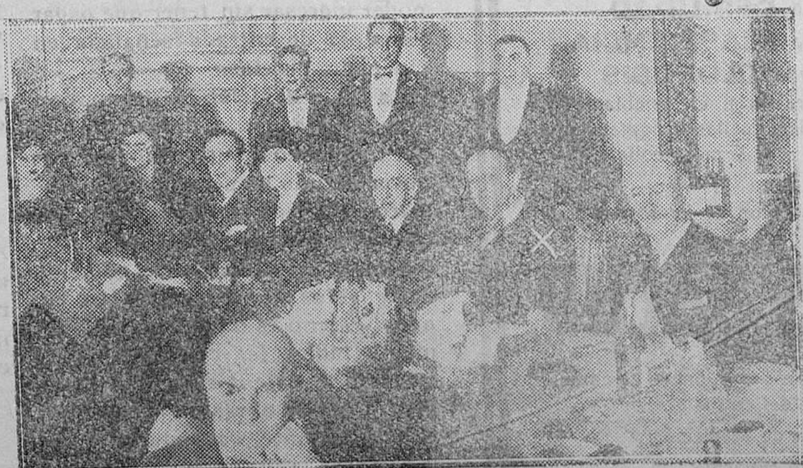
MADRID. - Banquete a don Emilio Thuillier con asistencia de don Jacinto Benavente y don Alejandro Lerroux. Aspecto de la mesa presidencial en dicho banquete

La misa y oficio divino de mañana es de la Sagrada Familia con rito doble mayor y color blanco.