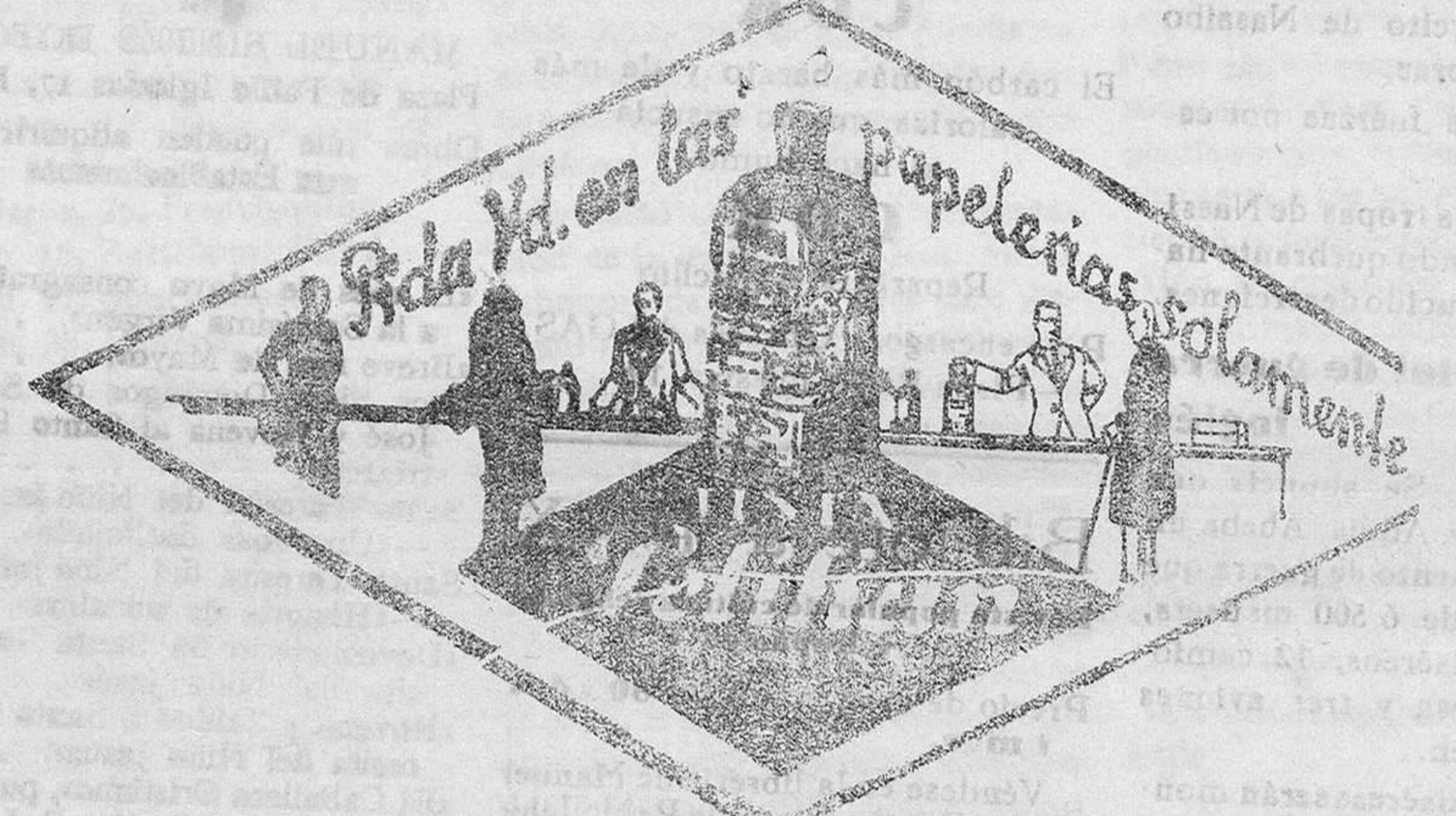
De venta en la Librería de MANUEL SINTES ROTGER, Plaza de Pablo Iglesias, 17, Mahón

194 LOS HIJOS DESGRACIADOS banquero le nombró al indicarle que cediera su asiento al nuevo punto. El aludido no recordó este detalle y repuso: - Sí, señor; es verdad. - ¿Ves? Sé que también tienes algunas cuentas pendientes con la justicia, y sobre todas, una muy gorda. - No, señor; en eso está usted equivocado. Negó con tanto aturdimiento, que el otro pensó: - Voy bien. Y añadió en voz alta: - ¿Qué he de estar equivocado, si me consta que la policía te busca? Este golpe fué de un efecto seguro e inmediato. Quilino miró en torno suyo, como si temiese que hasta allí mismo lo espantaran, y dijo con creciente aturdimiento: - Eso sí que no puede ser; porque todavía no sabe casi nadie que vuelvo a estar aquí... El caballero se mordió los labios para no echarse a reír. Su interlocutor se vendía a sí mismo. De sus anteriores palabras deducía que acababa de regresar a Barcelona y que le importaba ocultar su regreso. ¿Por qué?