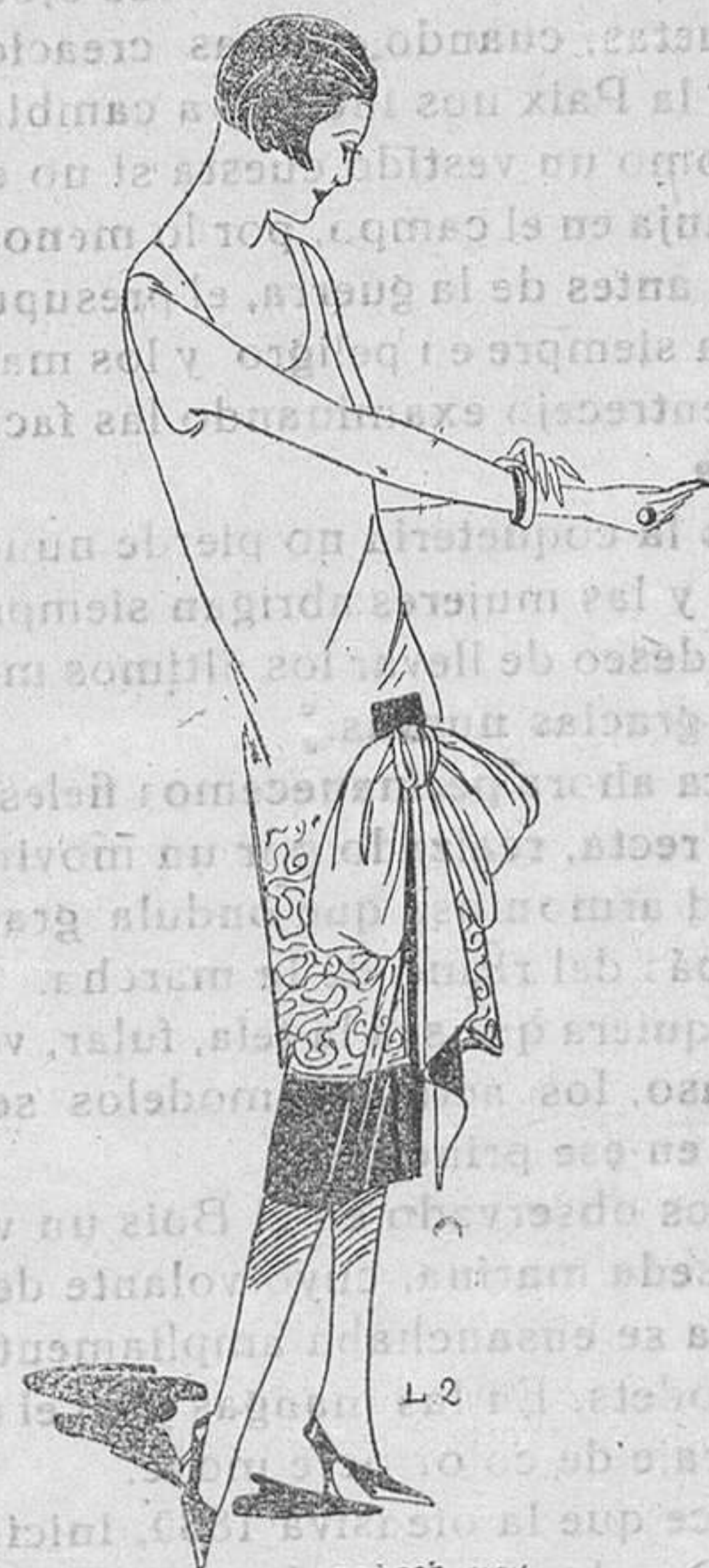
Túnica en crepé cereza con el bajo bordado en plata, sobre un bajo de satín negro; lazo del delantero de crepé cereza, forrado con negro

El kasha , suave, ligero, es la tela ideal pa-