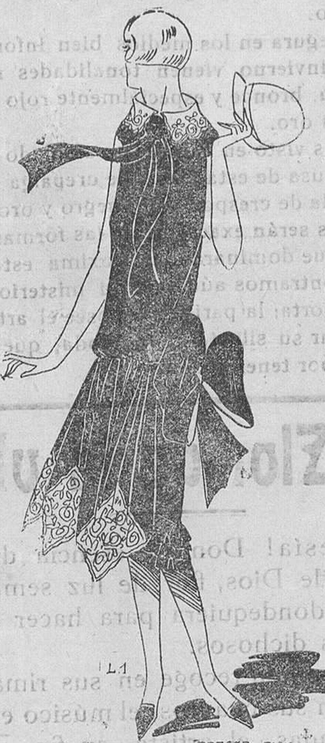
Vestido de crepé de china azul marino, adornado con puntillas color ocre