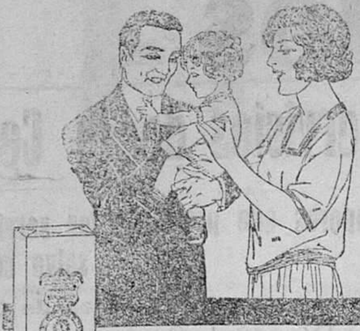
LA DICHA DEL HOGAR

Santo de hoy. — Santos Bernardo, Samuel, Lucio y Leovigildo. Santo de mañana. — Santas Juana Francisca Fremiot y Ciriaca y Santos Fidel y Germán.