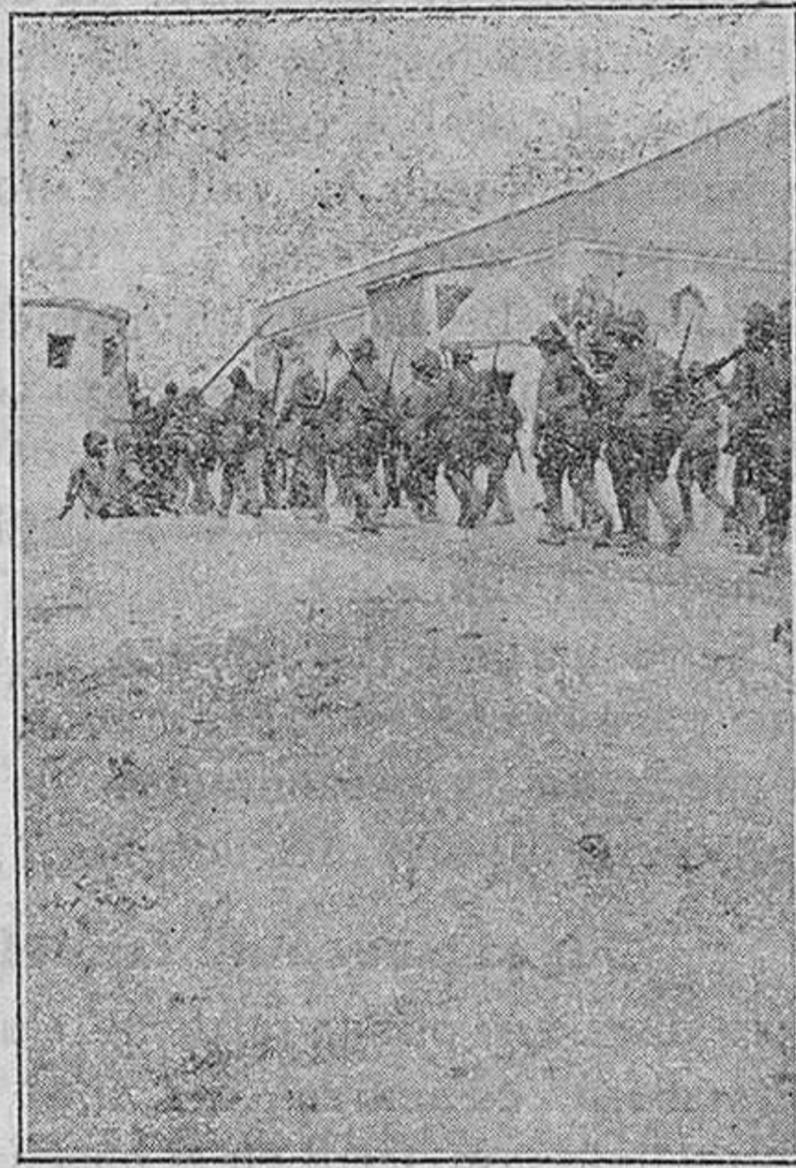
El Batallón de Mahón entrando en la posición de Zoco-el-Had. A la derecha se ve el edificio del Consultorio indígena.