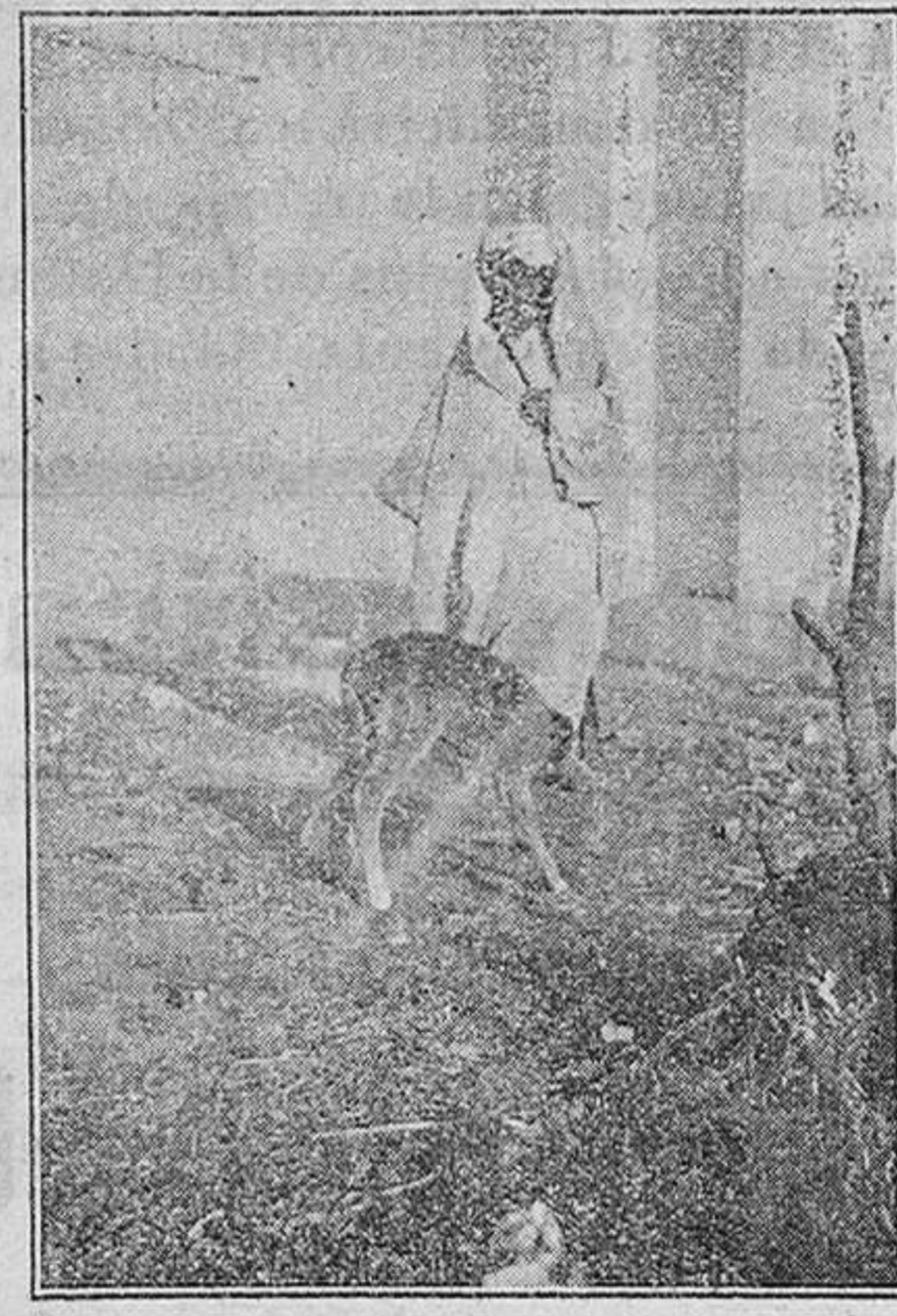
Mohamed-ben-Mohatar y el «Funito», mascota del Batallón. — Fot. C.