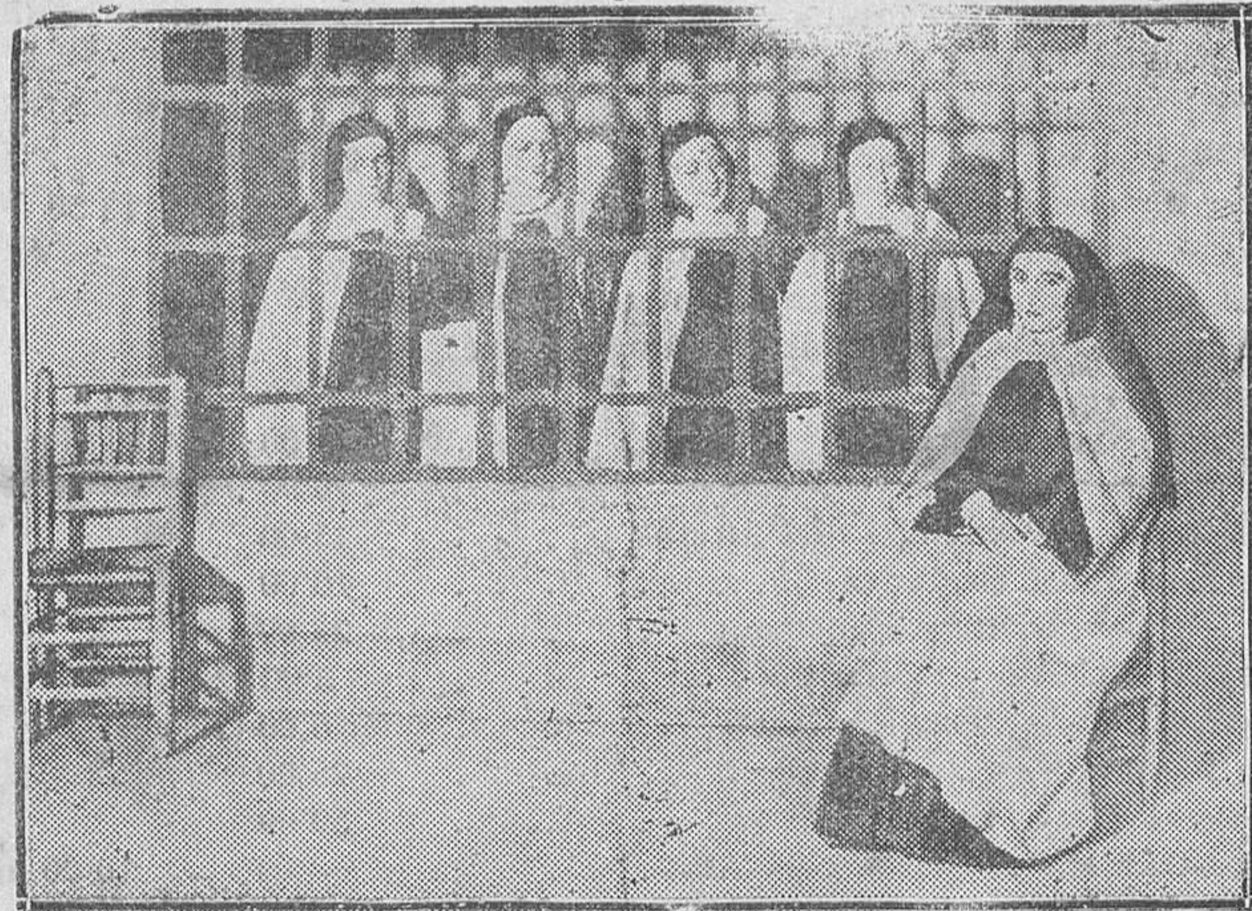
MADRID.—Una escena de «Santa Teresa de Jesús», obra de Marquina, estrenada con gran éxito