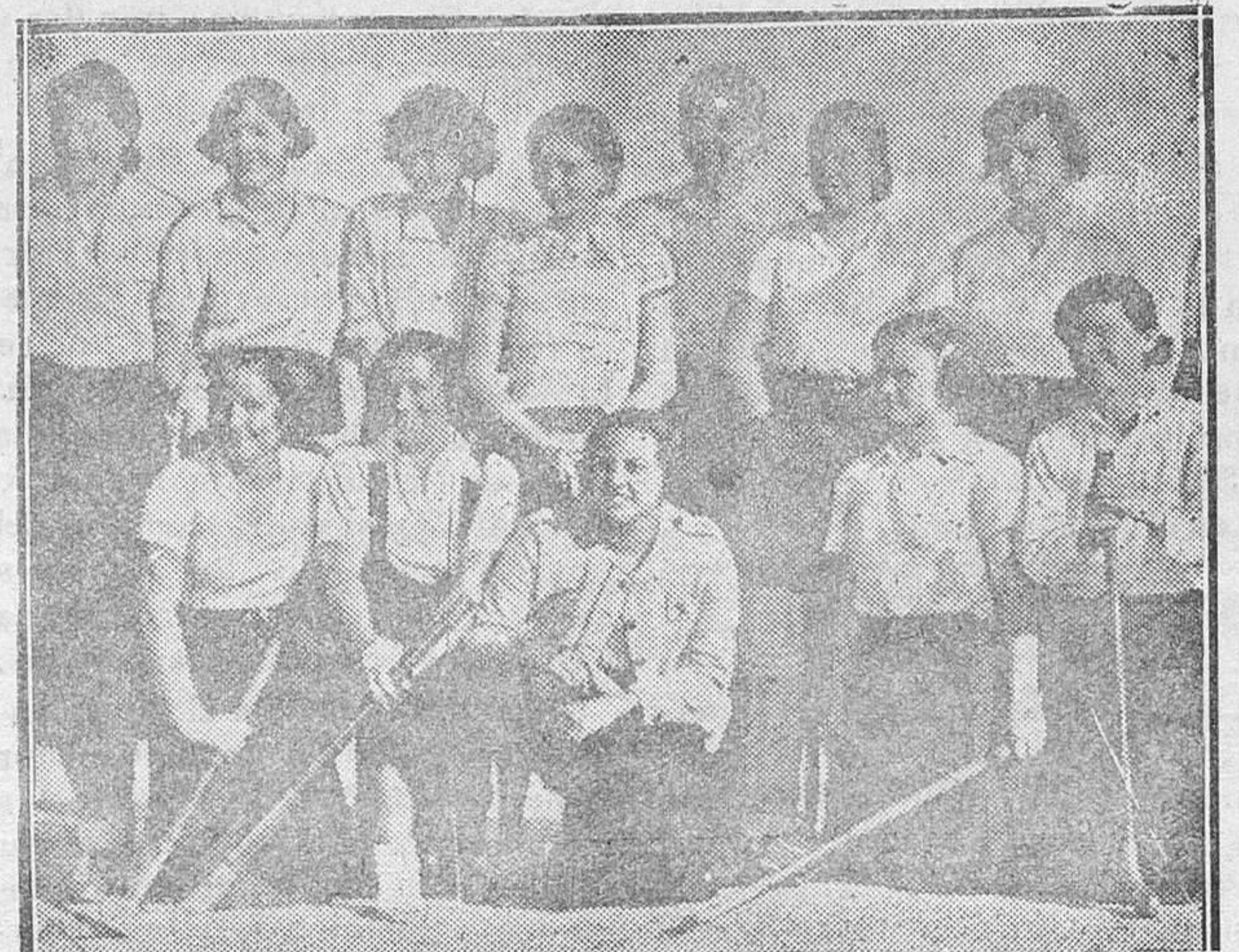
MADRID.—El equipo de la Residencia de Estudiantes que jugó frente al Aurrerá