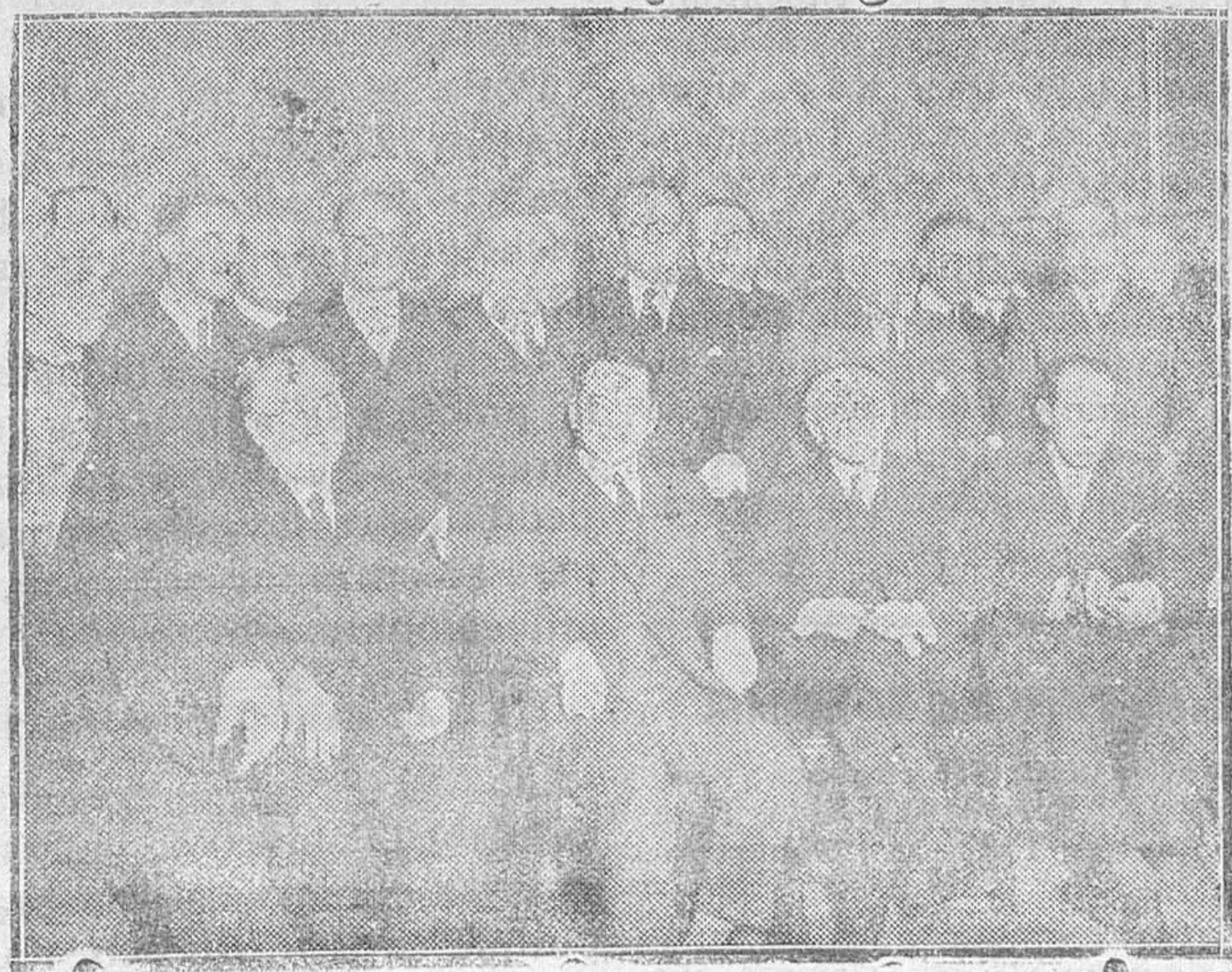
MADRID.—En las Salesas.—Reunión de decanos de toda España para tratar asuntos del Colegio de Abogados y dirigir una instancia al Gobierno