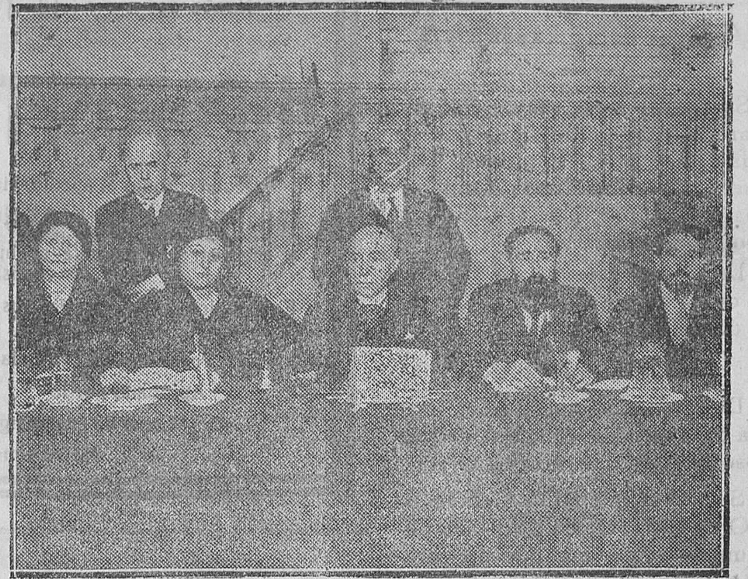
MADRID.—Velada necrológica en memoria del insigne general Riego