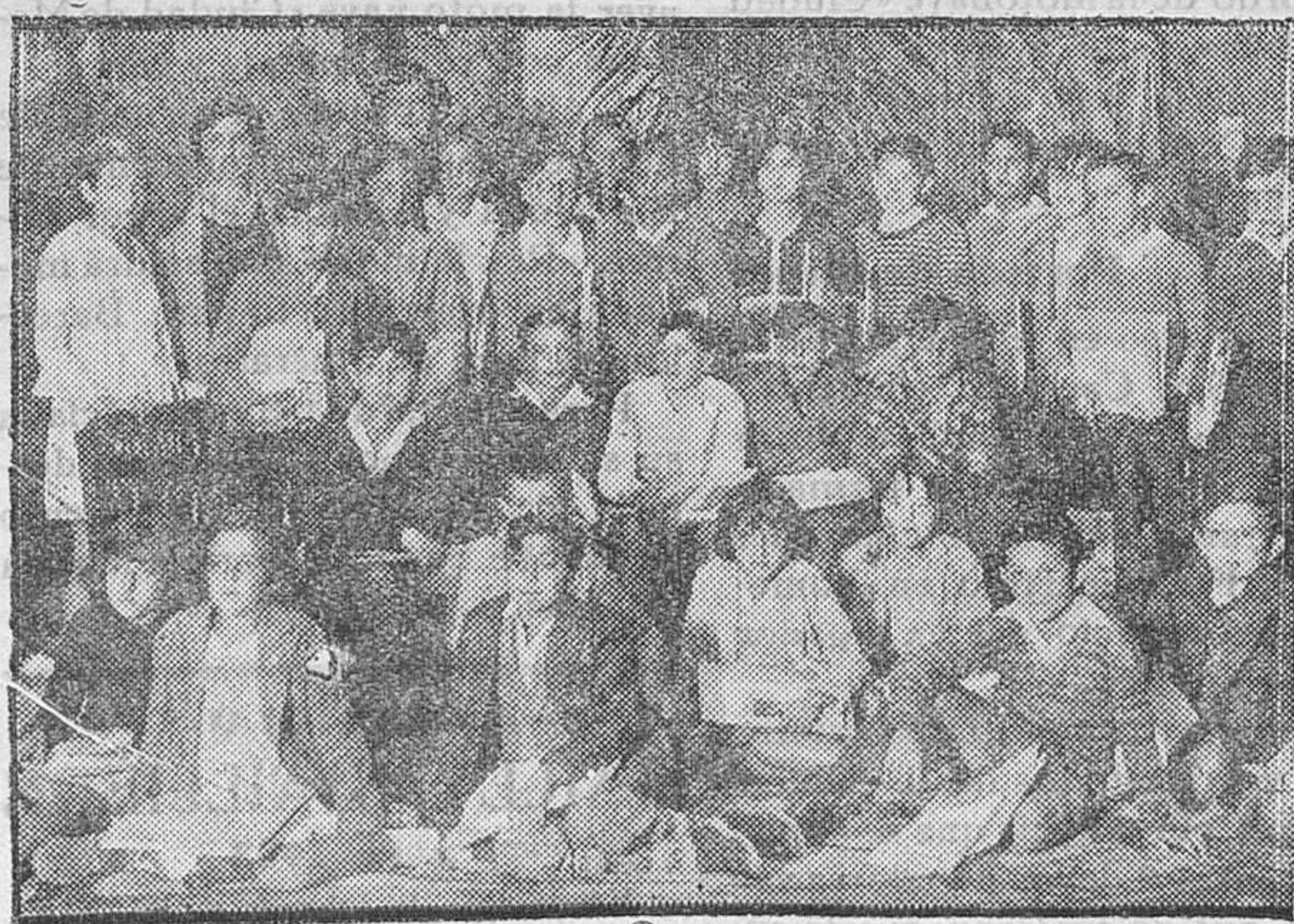
MADRID.—Grepo de alumnos del Instituto-Escuela de Madrid en la visita que hicieron al Ministerio del Trabajo para ver la instalación de la oficina Internacional del Trabajo