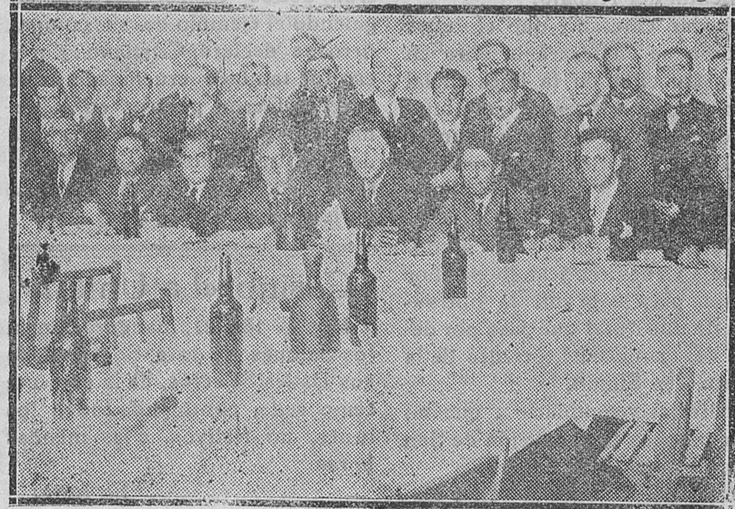
MADRID.—Banquete en honor de la Directiva del Monte de Piedad y Caja de Ahorros