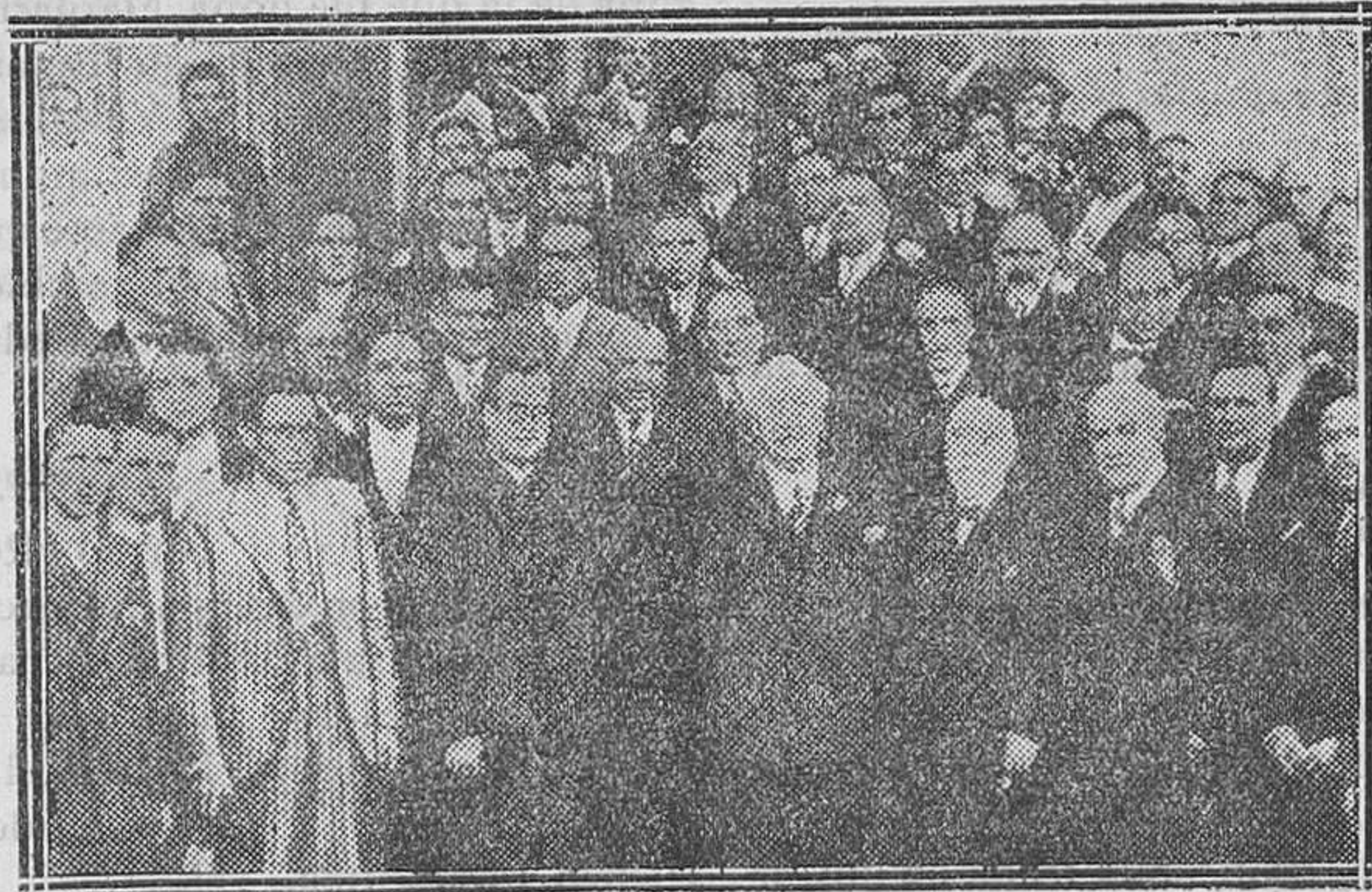
EL SEÑOR LERROUX EN BARCELONA.—Antes del banquete con que fue obsequiado a su llegada don Alejandro Lerroux, rodeado de correligionarios