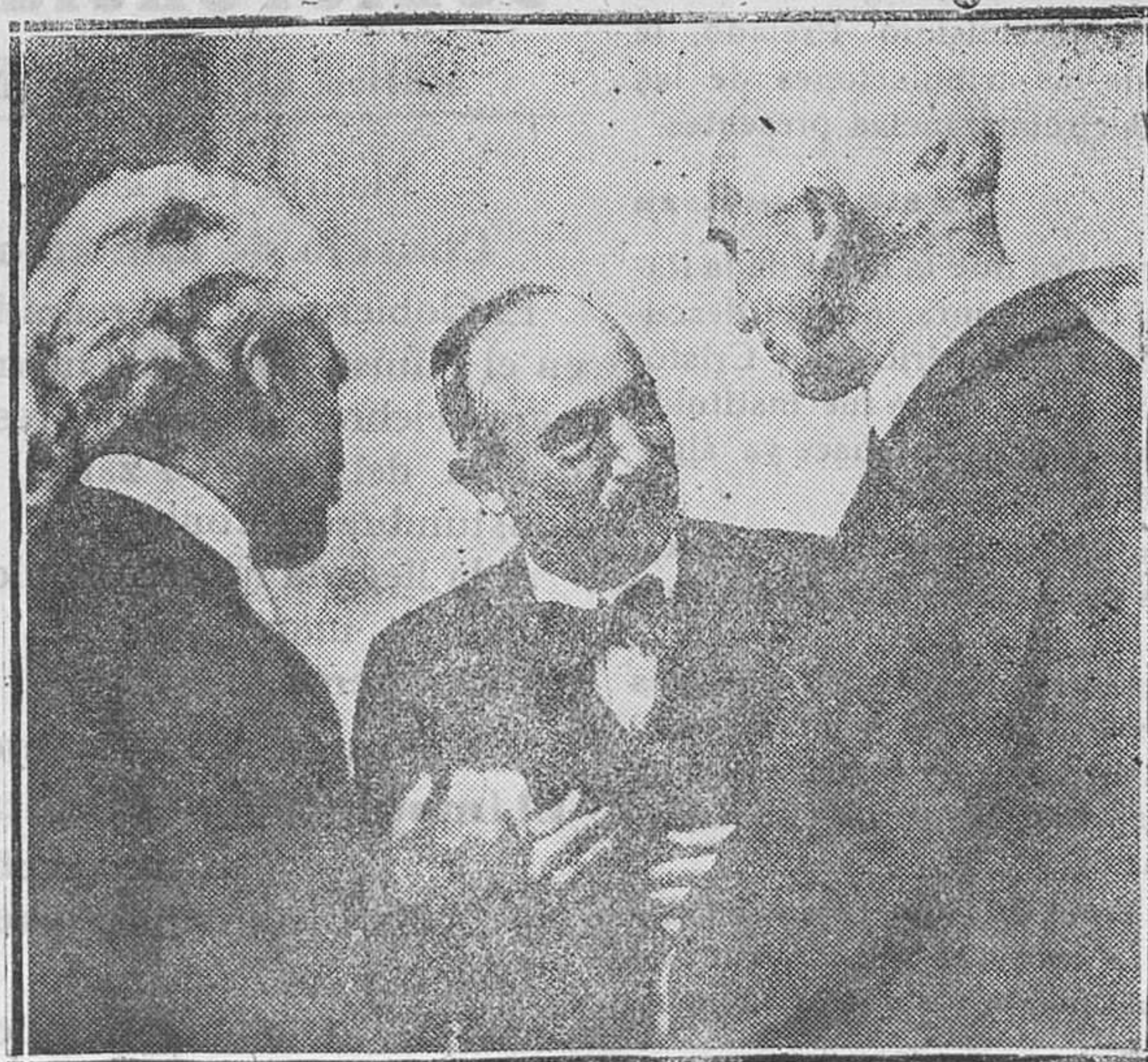
EXTRANJERO. Entre las personalidades que más esfuerzos hacen para la reducción de armamentos figuran los señores Proaz, Hymans y Sir John Simon. En la foto conversando antes de la reunión de Ginebra

A pesar de todo, y de su triunfo, el Gobierno no puede ni debe estar satisfecho. El complot, a lo que parece, tenía muy extendidas raíces. Sin duda, no todas salieron al exterior... como suele ocurrir, y ello constituye otra de las causas por las que, casi invariablemente, fracasan complots como el pasado. Pero esa extensión del movimiento es harto significativa. Y el ambiente logrado por él en amplias y varias zonas sociales también dice mucho. Dice que el conato sedicioso fué expresión, o consecuencia de un malestar social hondo y vasto. Fuera solamente monárquico, o monarquizante, el complot, y acaso pudiera relicitarse el Gobierno de que estallara, y de su fracaso, y de su represión rápida y segura. Pero es un hecho que, en el movimiento, no faltaron republicanos entreverados con los monárquicos. Hubo conjurados que no iban contra un régimen; sí, contra un Gobierno. No contra la República, sino contra los hombres que la dirigen y administran. No eran rebeldes a una institución; pero se alzaban contra una política que juzgaban funesta. Ni siquiera tienen estas observaciones el mérito de la novedad: los diarios extranjeros más perspicaces las han anticipado... y el ministerialismo de la Prensa no suspendida ha cuidado de que no sean conocidas del público español.