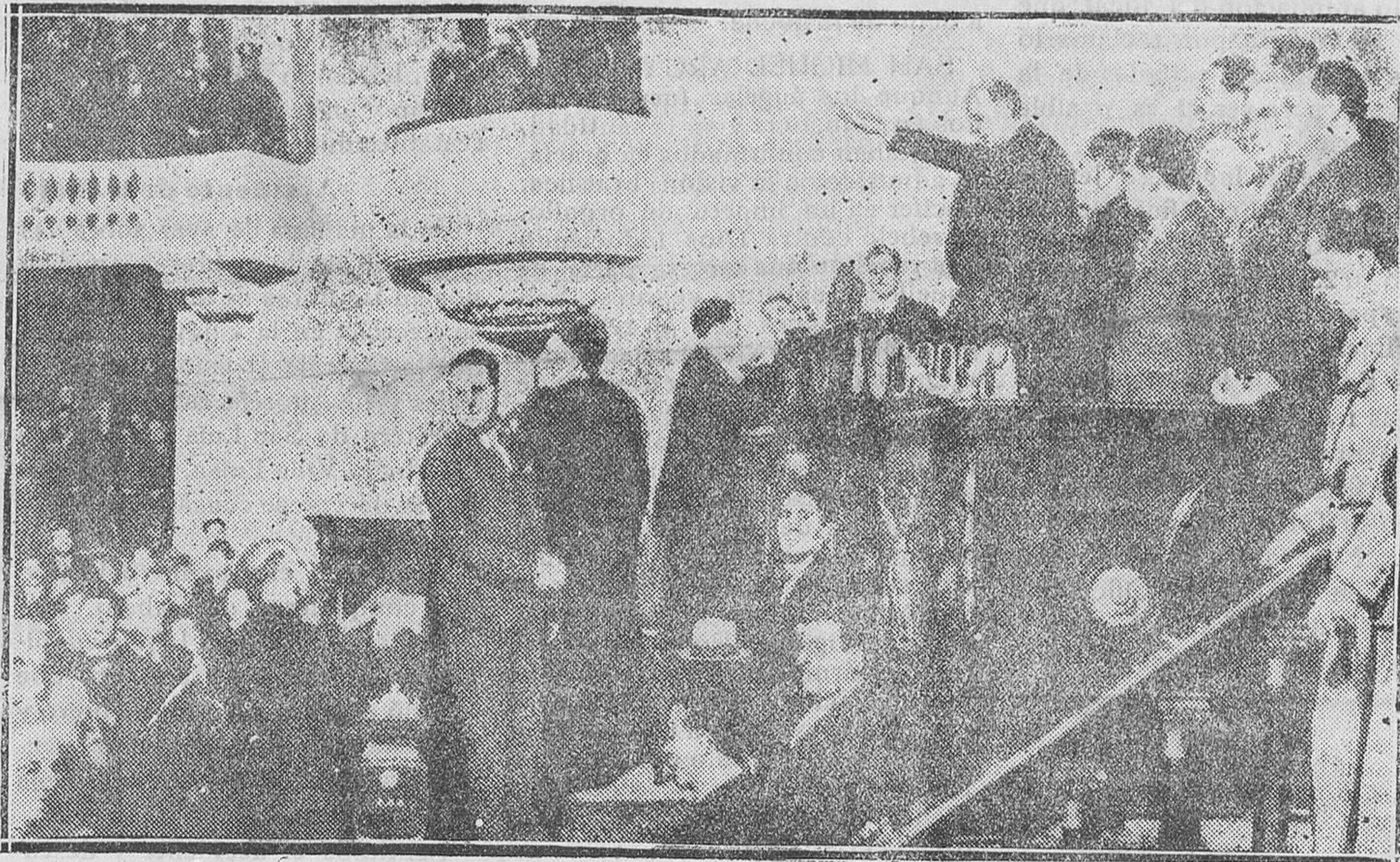
El nuevo Presidente de la República de Méjico don Abelardo Rodríguez en el momento de la promesa constitucional ante los miembros del Parlamento