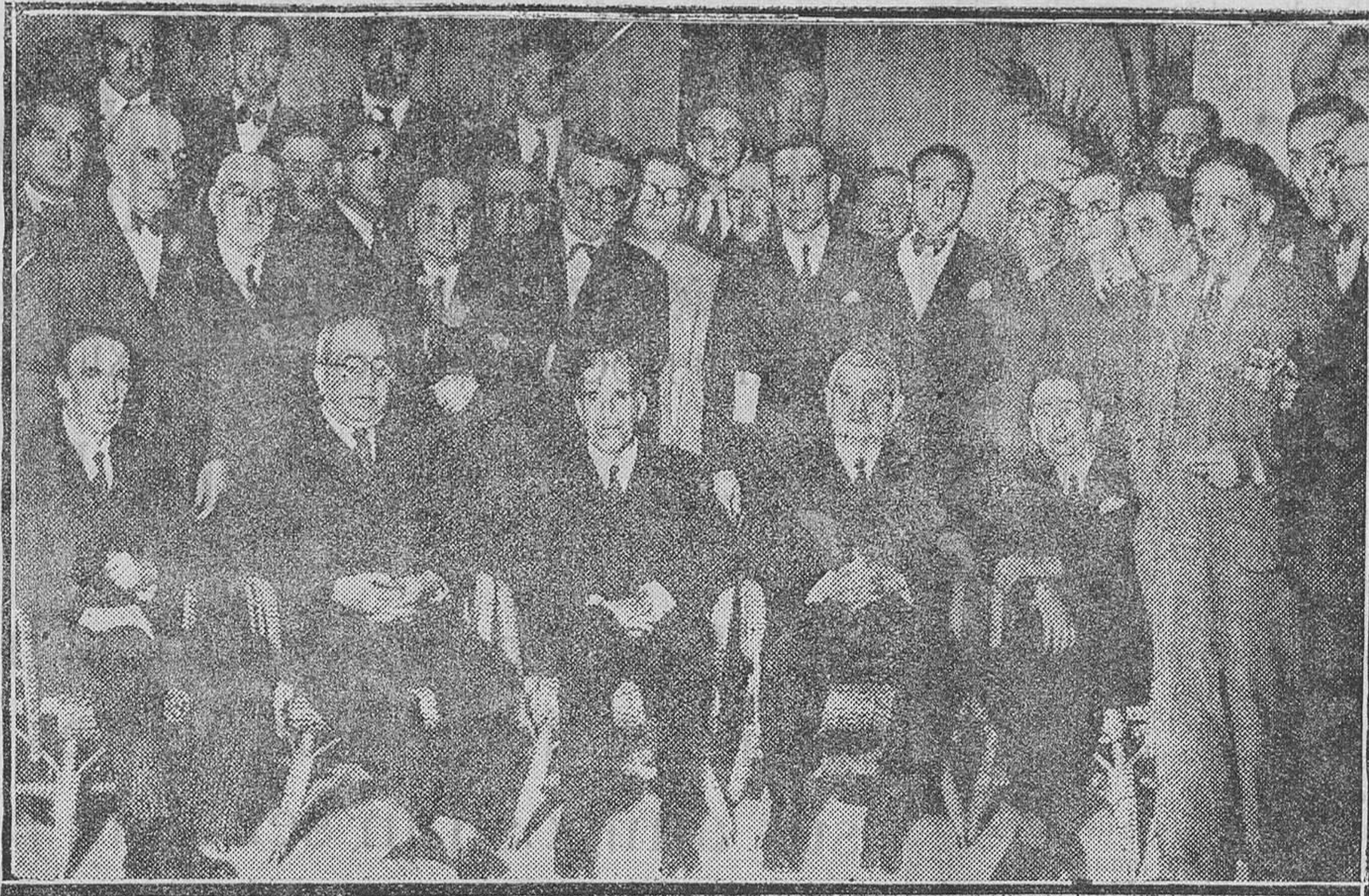
MADRID. — El Jefe del Gobierno señor Azaña y el Presidente de la Comisión dictaminadora del Estatuto don Luis Bello, acompañados de los comensales al banquete con que los parlamentarios catalanes han obsequiado al Presidente del Congreso señor Bustiño, con motivo de la aprobación del Estatuto.