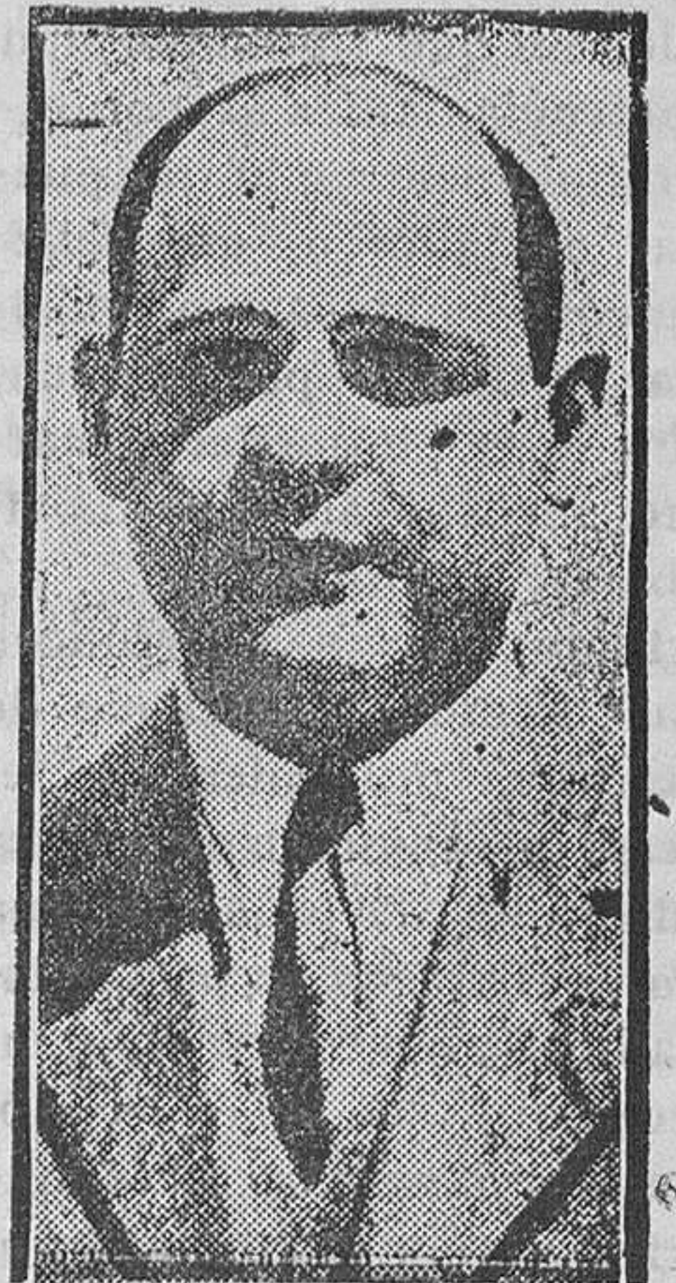
Don Abelardo Rodríguez, que ha sido designado para ocupar el sillón presidencial en Méjico.

Comunican de Londres que a pesar de las previsiones poco halagadoras sobre la cosecha de cereales de este año, los agentes soviéticos procuran cerrar contratos para la venta de trigo ruso, a no importa qué precios.