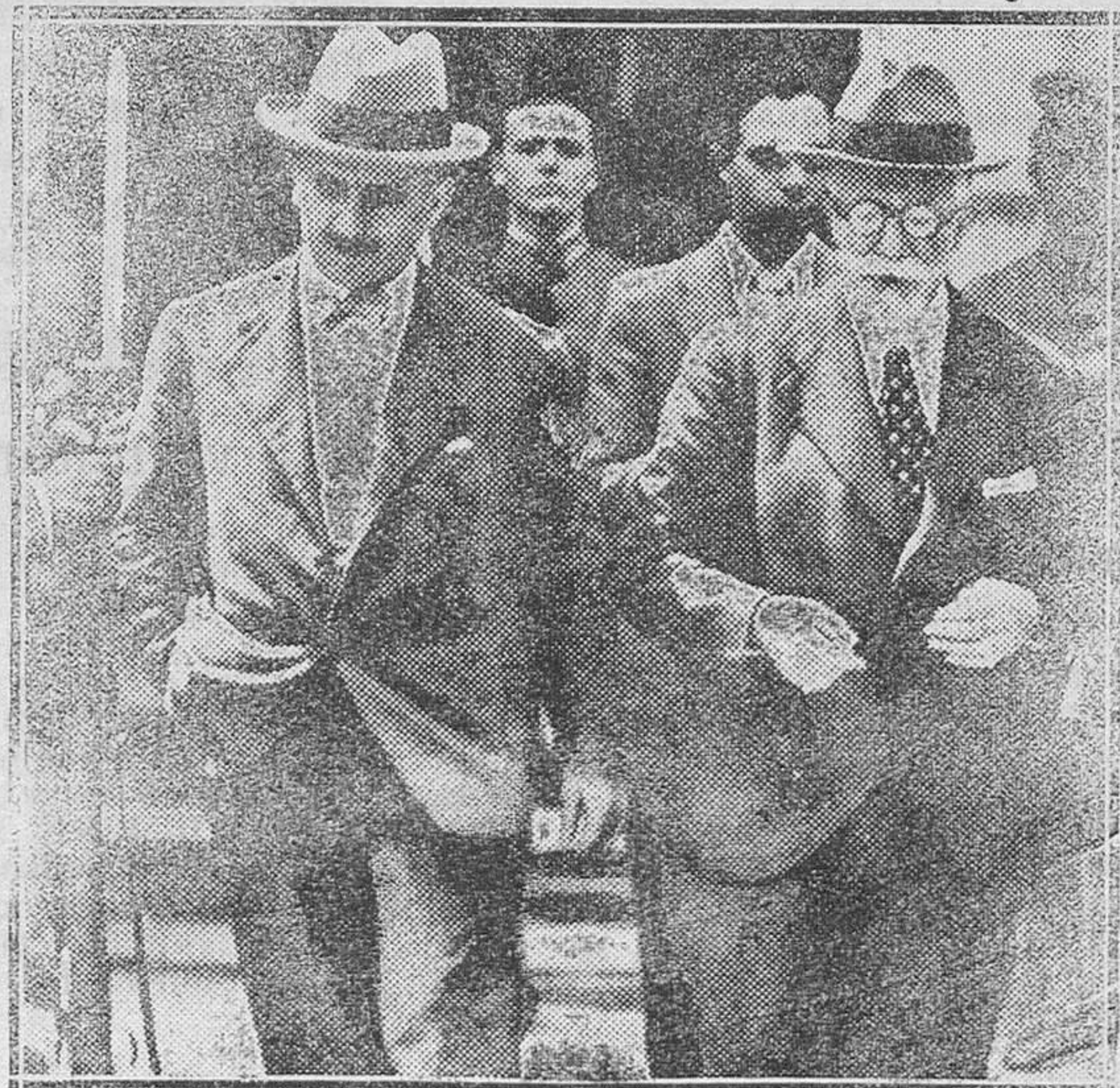
El Fiscal de la República señor Martínez Aragón con el juez especial don Dimas Camarero, al salir de Prisiones Militares de tomar declaración al general Sanjurjo y demás presos