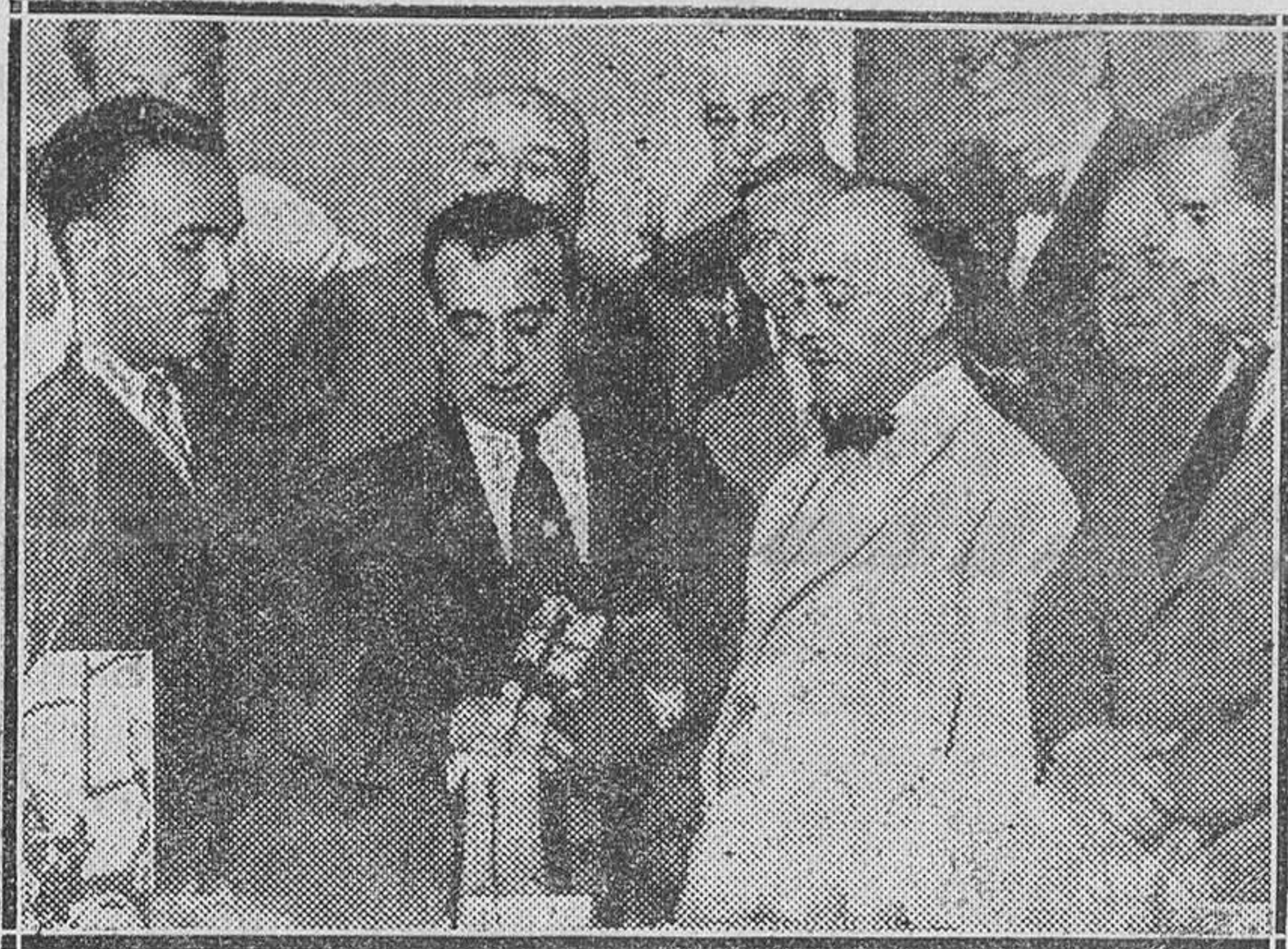
SEVILLA.—El alcalde, que no quiso someterse al general Sanjurjo y fué preso, enseñando el fajín que dicho general dejó abandonado en los jardines de la plaza de España al vestirse de paisano