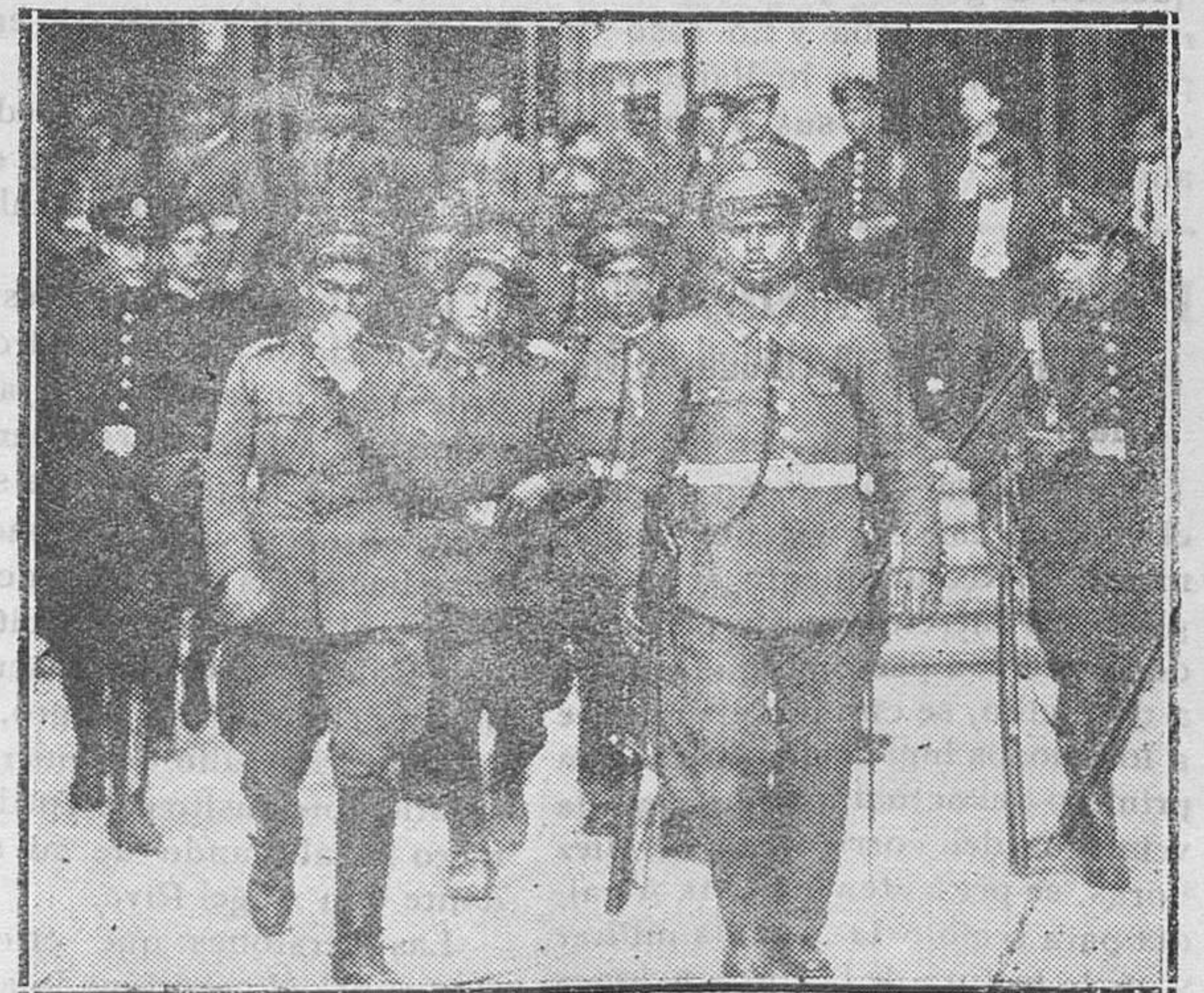
MADRID.—El movimiento revolucionario.—Unos soldados de la Remonta detenidos y custodiados por guardias de Asalto al sacarlos del Palacio de Comunicaciones