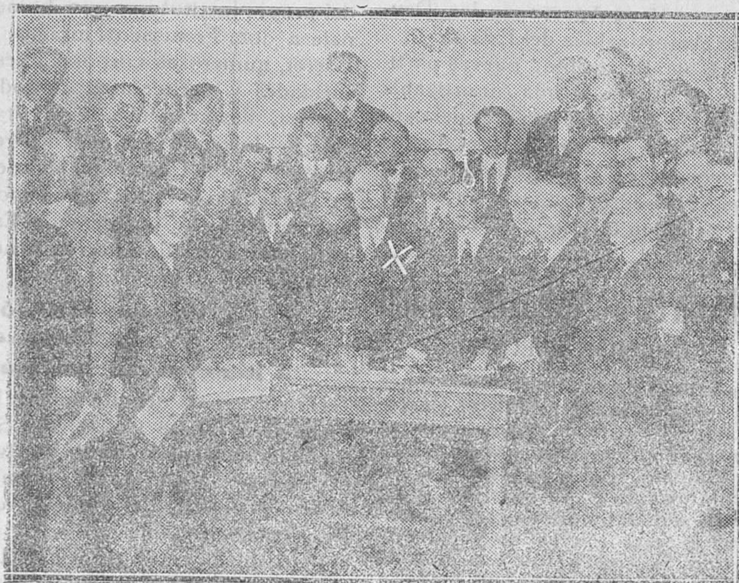
Reunión de los diputados del partido republicano radical, presidida por su jefe don Alejandro Lerroux (x), celebrada en la casa central del partido

—El tiempo continúa variable e impropio de la estación en que nos hallamos. Ayer tarde llovió nuevamente, con el consiguiente contratiempo de los payeses que