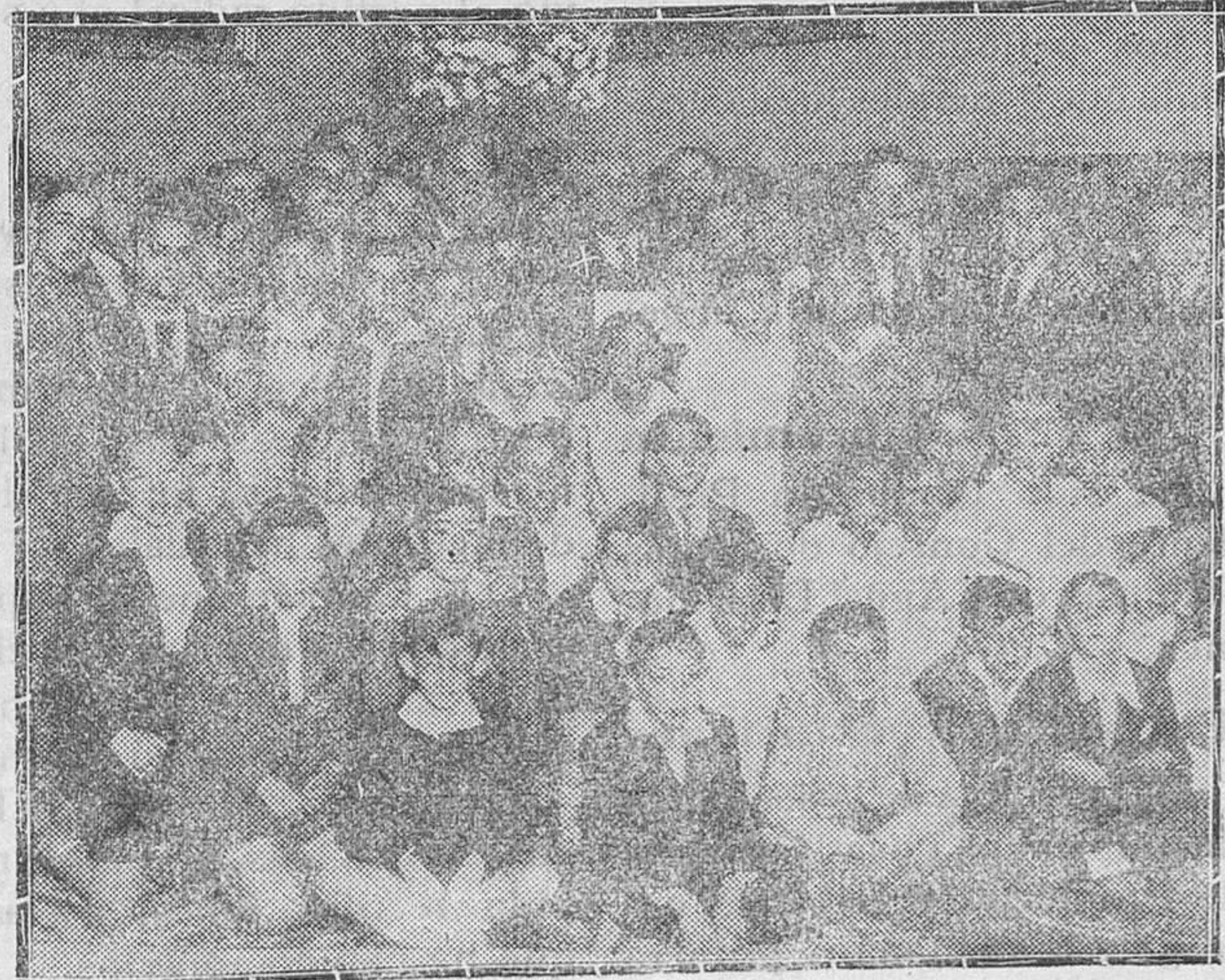
Los niños del intercambio familiar establecido entre los alumnos del grupo «Ruiz Zorrilla» de Madrid y los de la granja «Navarro Deza» de Carcagente, durante la entrega del mensaje que la ciudad dedica al señor Presidente de la República don Niceto Alcalá Zamora