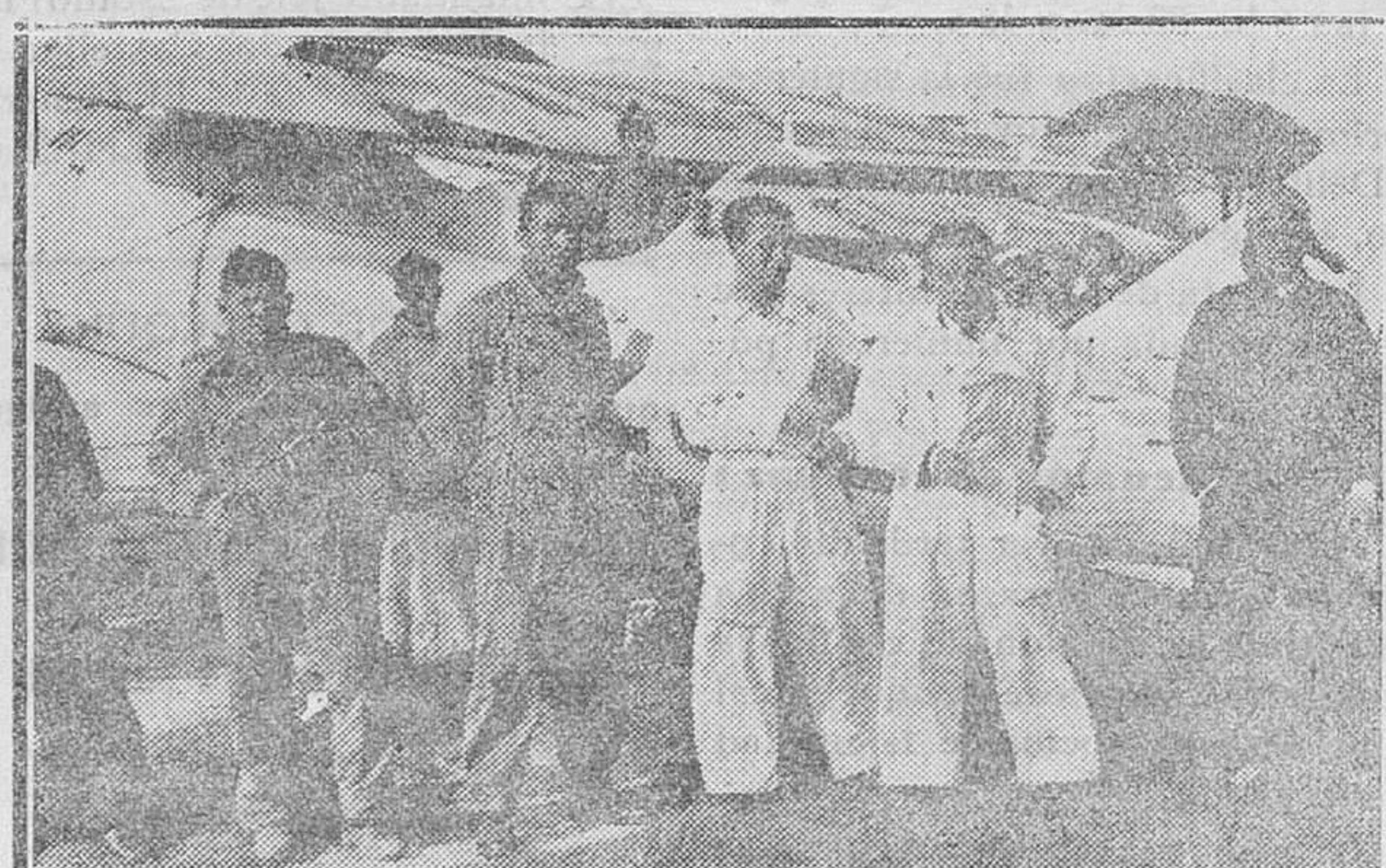
BARCELONA.—Varios de los pilotos y mecánicos de la escuadrilla número 3, que tomaron parte en la vuelta a España, a su llegada al aeródromo de Prat