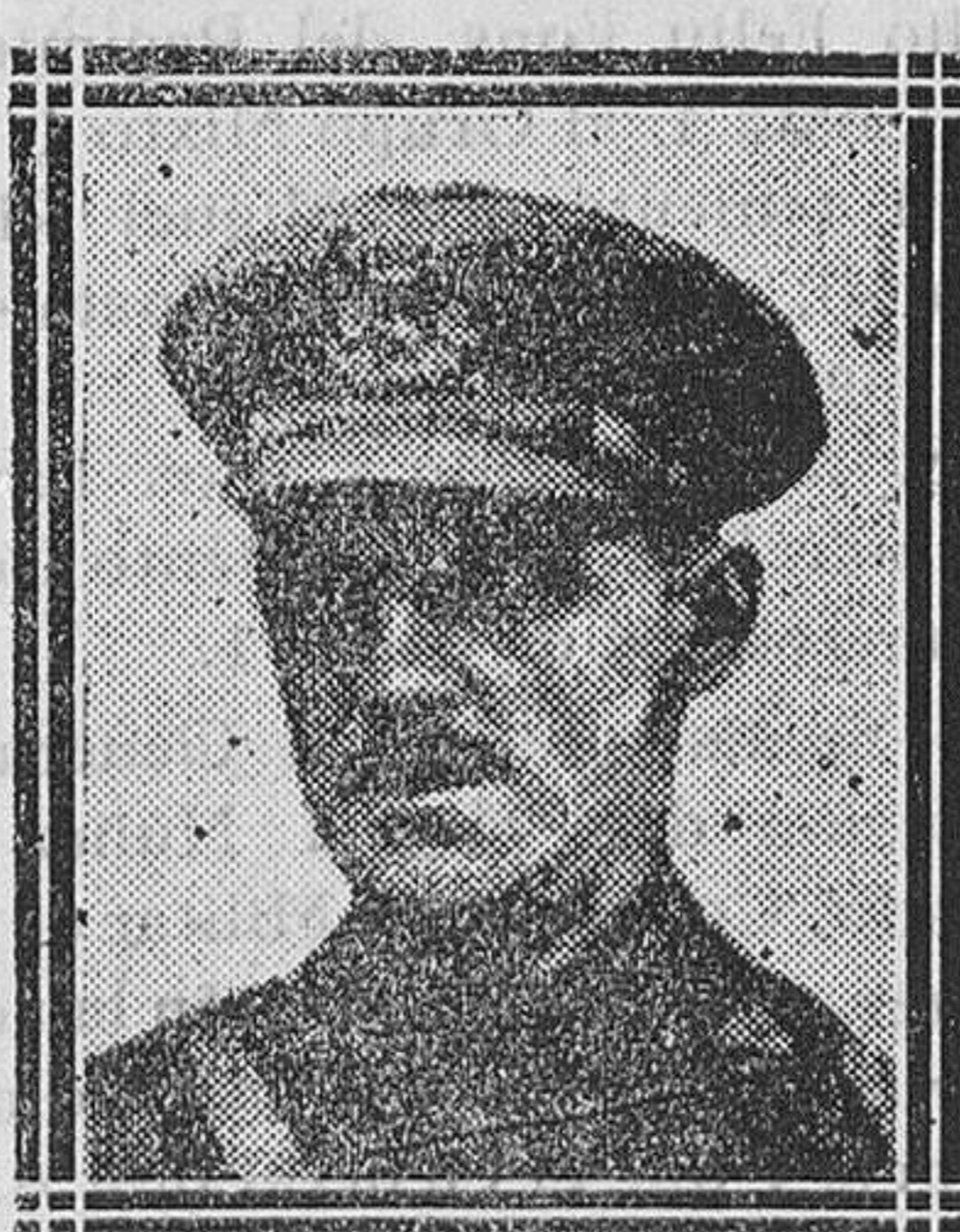
El general don Manuel Goded, Jefe del Estado Mayor Central, que ha sido relevado de su alto cargo con motivo del incidente militar de Carabanchel