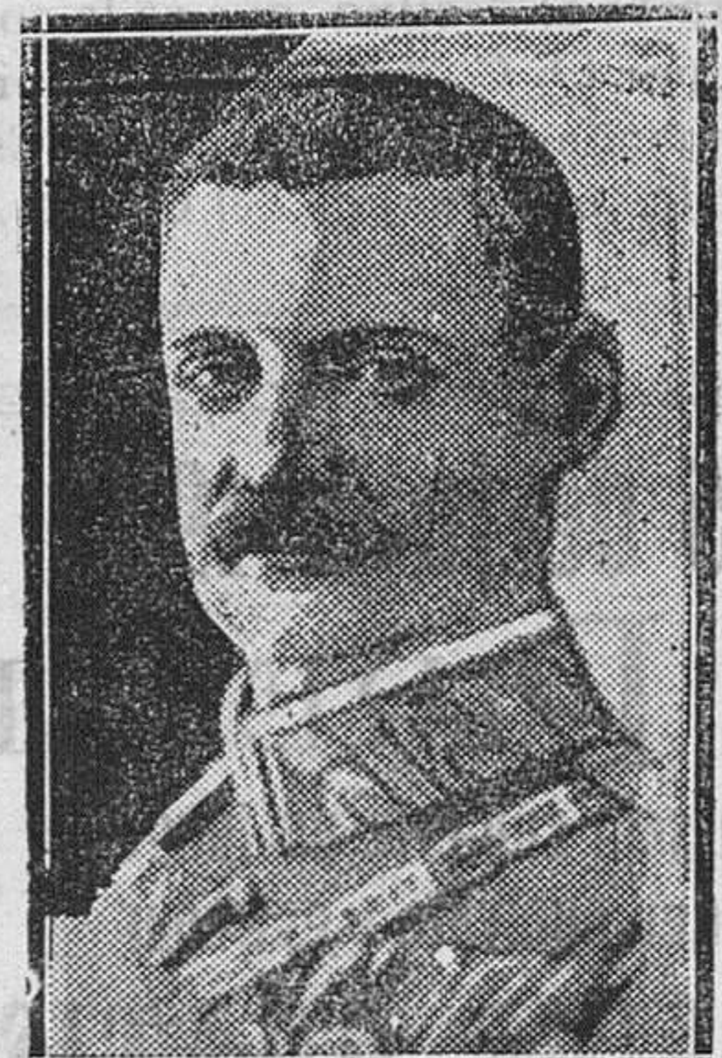
El ex Kromprinz Ruppretch, a quien, según información de «Daily Express», tratan de elevar al Trono los monárquicos bávaros