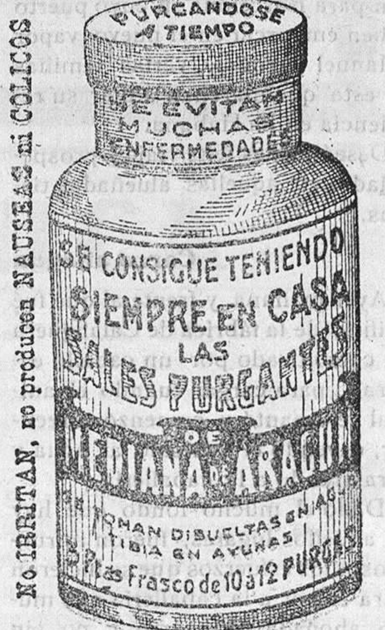
No irritan, no producen NAUSEAS ni COLICOS

Llamamos la atención de los consumidores para que no se dejen sorprender y para que se fijen bien en las botellas que les ofrezcan, puesto que las de los manantiales VICHY CATALAN llevan tapones, cápsulas, precintos y etiquetas con el nombre SOCIEDAD ANONIMA VICHY CATALAN, y por lo tanto dejan de proceder de dichos manantiales las que no las llevan.