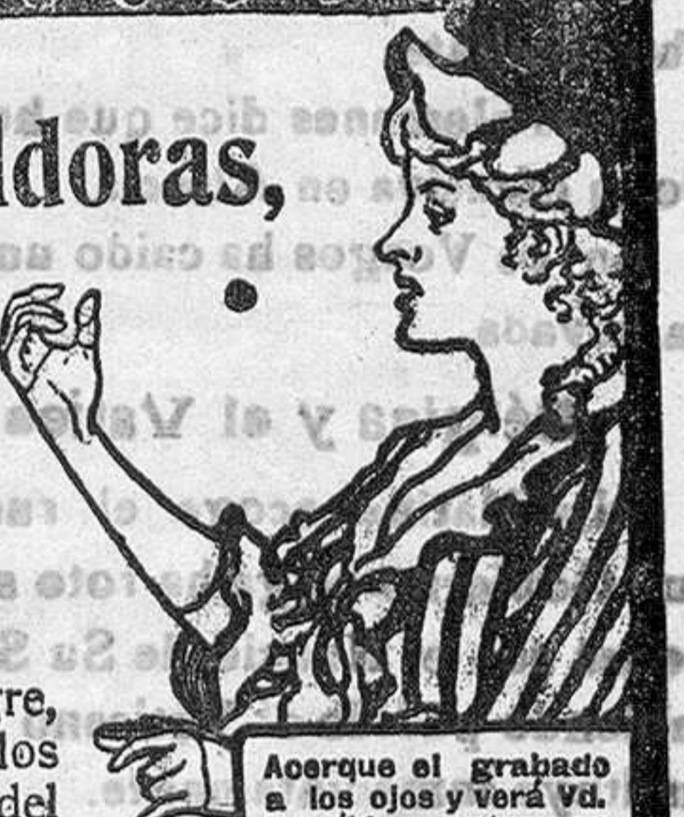
Acoque el grabado a los ojos y verá Vd. la píldora entrar en la boca.

DE VENTA EN LAS BOTICAS DEL MUNDO ENTERO.