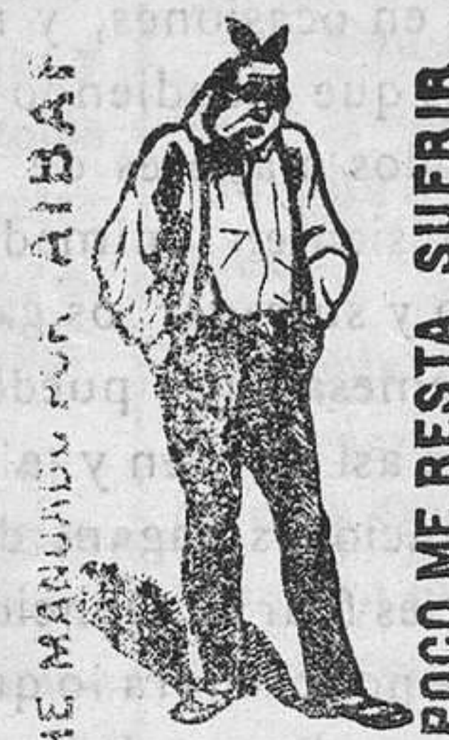
HE MANUADO POR AIBAF

De venta en Mahon: Farmácia de Sintés, calle de las Moreras núm. 6; y principales farmácias y droguerías, á 2 pesetas pote.