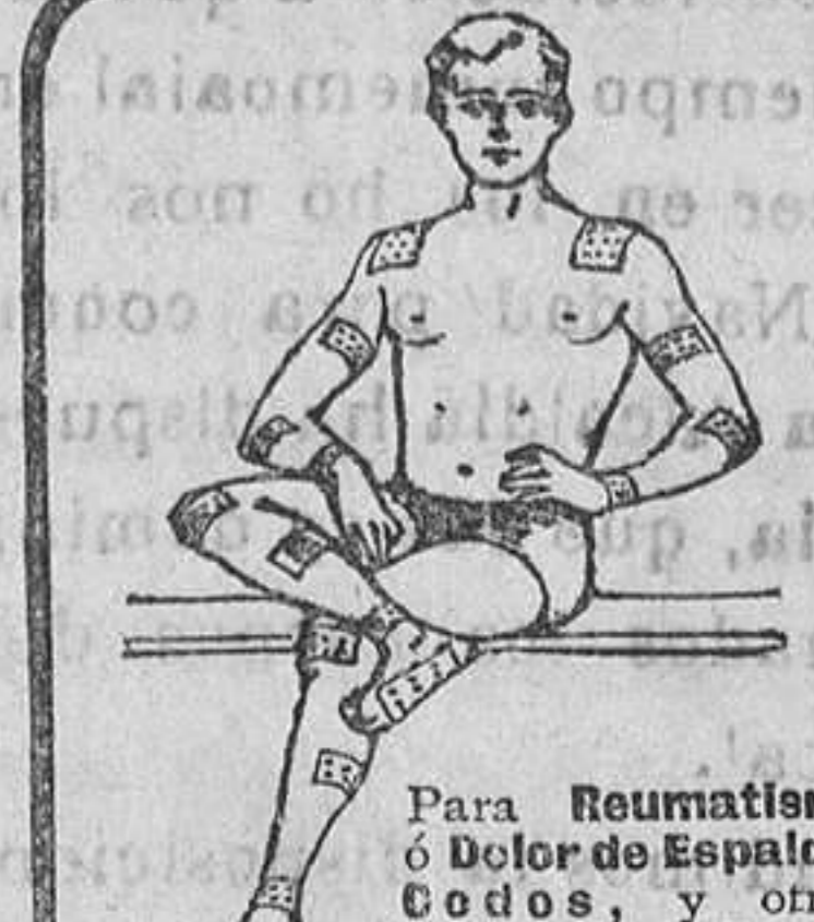
Para Reumatismo ó Dolor de Espalda, Codos, y otras partes, ó para Torceduras, Contusiones, Entumecimiento, y Puntos Doloridos, etc., el emplastro deberá contarse del tamaño y forma requeridas aplicándolo según se demuestra.

AVISO.—Como to las las cosas buenas, los Emplastos de Alcock han sido imitados; pero solo superficialmente. Ninguna posee las virtudes sanativas, fortalecientes, y aliviantes de dolor que poseen los de Alcock. Además, son absolutamente sanos, porque no tienen belladonna, Opio, ni ningún otro veneno. Insista Vd. en que le vendan el genuino.