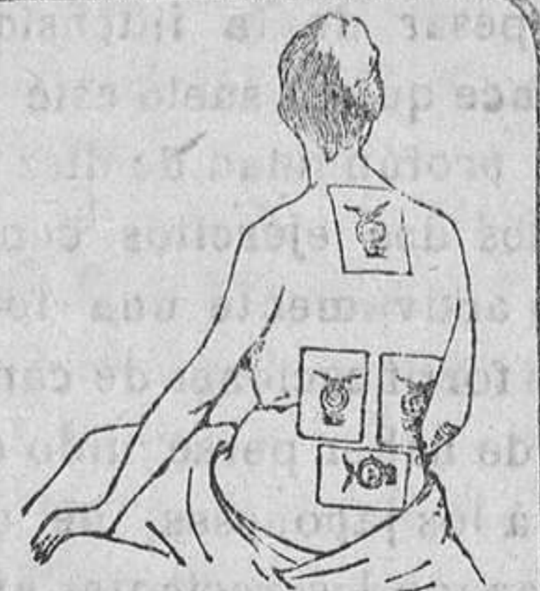
Para dolores en la región de los Riñones ó para la Debilidad de las Caderas, el emplastro deberá aplicarse como se vé arriba.

Remedio universal para el dolor de caderas (tan frecuente entre las mujeres).