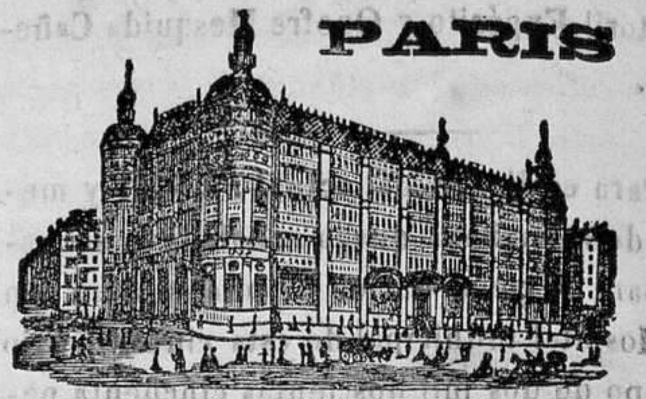
GRANDES ALMACENES DEL

Lo están varias acciones del Banco de Mahon. Para su ajuste en esta imprenta.