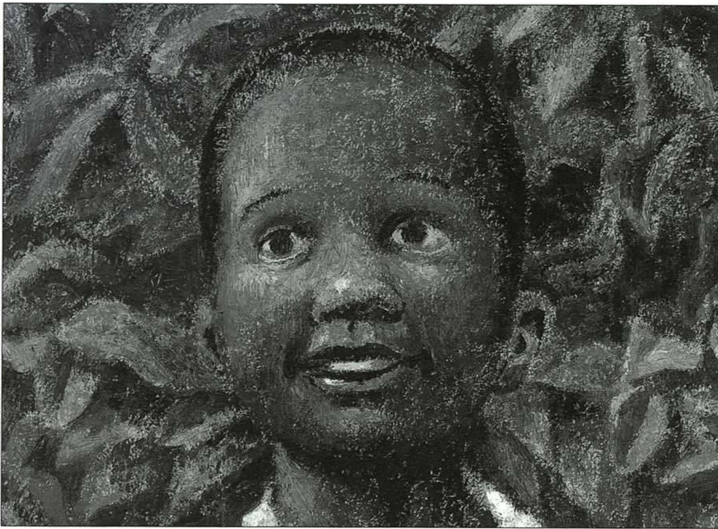
JAVIER SÁEZ CASTÁN.

estemos dispuestos a admirarla y disfrutarla.