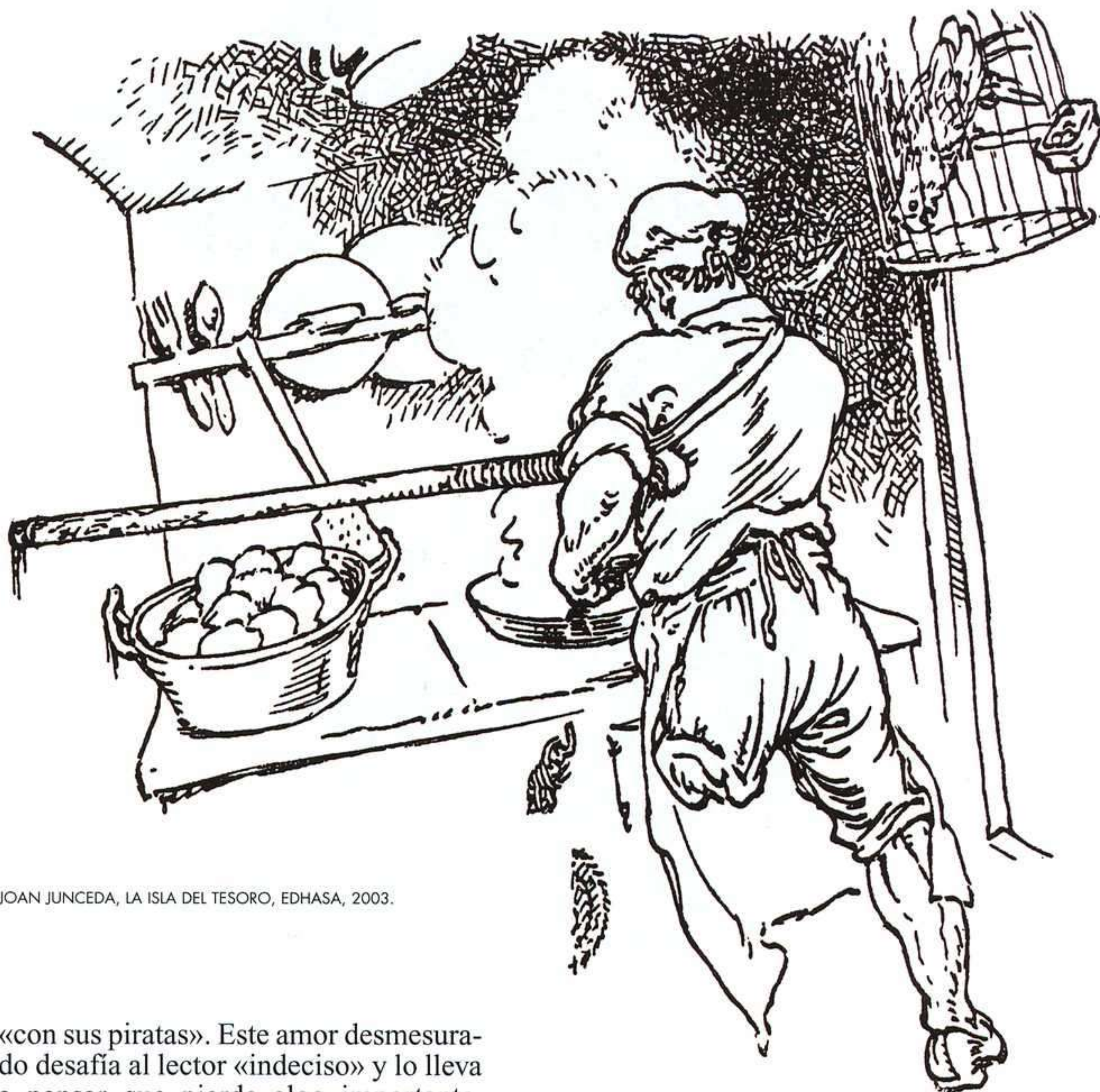
JOAN JUNCEDA, LA ISLA DEL TESORO, EDHASA, 2003.

He aludido al poema inicial de La isla del tesoro pero me temo que muchos lectores lo desconozcan porque solía desaparecer en las ediciones «escolares» que manejábamos hasta hace poco. El poema va dedicado «al comprador indeciso» y es el equivalente a la solapa del libro que el cliente de la librería lee para decidirse. Se dirige, no sin ironía, a «los chicos listos de ahora», «al joven sabio»: entonces, como ahora, el lector juvenil no quiere ser considerado un niño; exige que se tenga en cuenta que está informado, que no se lo puede convencer con cualquier cosa. El autor prevé pues que los conocimientos que la juventud de su momento tiene (¡en 1881!), pueden llevarla a rechazar, quizá con cierta fatuidad, la tradición de los libros de aventuras, y aquí hace aparecer a los citados Kingston, Ballantyne y Cooper. La estrategia comercial incluye un lamento: si este tipo de novelas ya no interesa, el autor pide que lo entierren