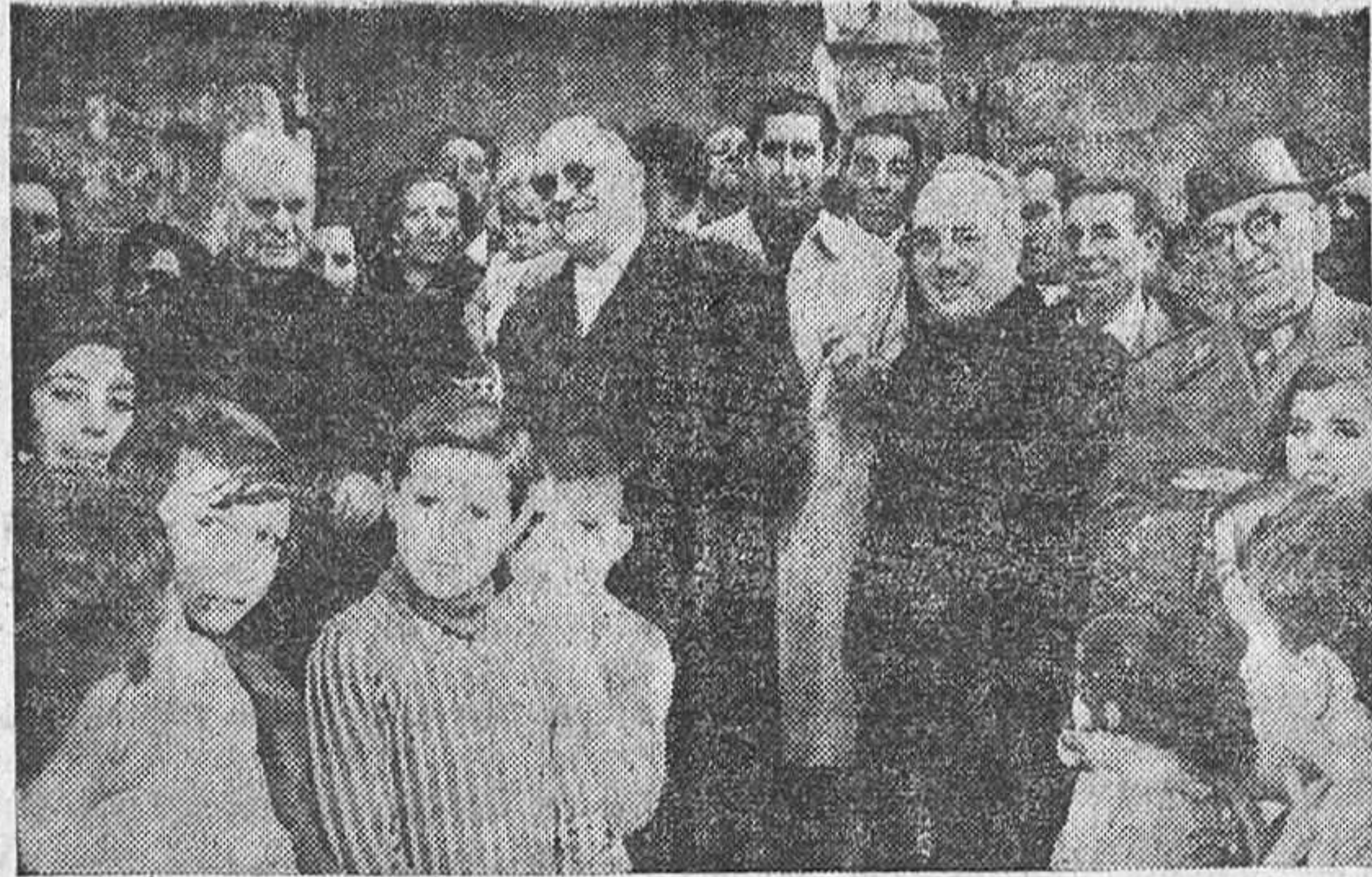
El alcalde de Benavente presidió el acto de reinauguración de la iglesia parroquial de Bercianos y Villaobispo de Vidriales.

A las seis de la tarde proseguía la fiesta en todo su apogeo, abandonando el pueblo la representación provincial, siendo despedidos por las autori-