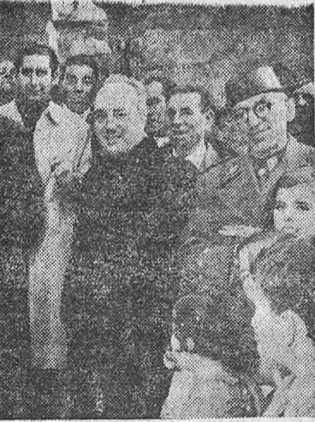
El alcalde de Benavente presidió el acto de reinauguración de la iglesia parroquial de Bercianos y Villaobispo de Vidriales.

Se terminó el día con una bonita sesión de fuegos artificiales y continuando las fiestas durante todo el día, dando pruebas estos pueblos de Bercianos y Villaobispo de su acendrado amor al terruño y