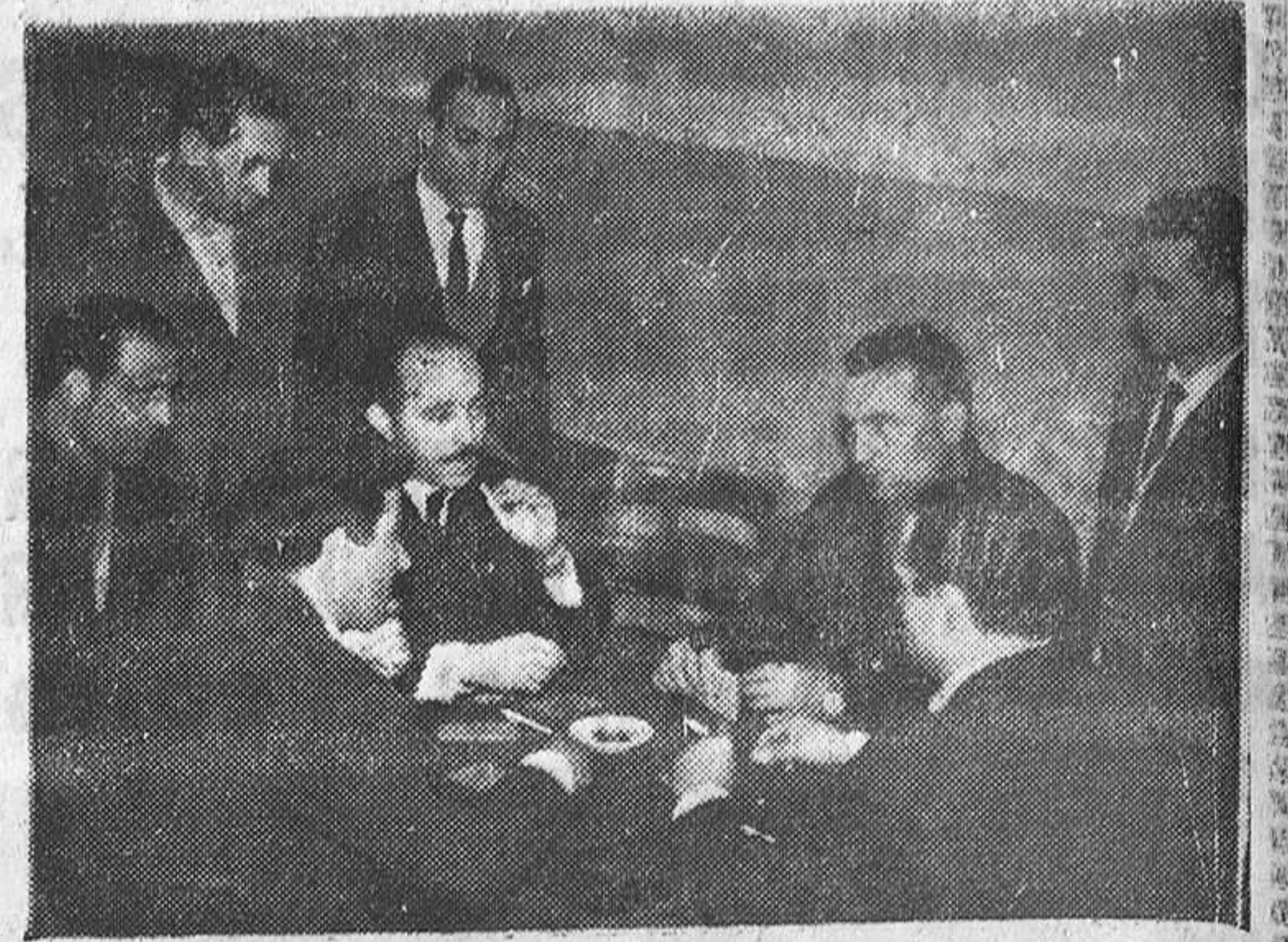
Un momento del torneo de ajedrez. Los jugadores piensan ante el tablero la pieza que ha de mover.—(Foto Trabanca).

Uno de los postulados de la Obra Sindical de Educación y Descanso es que en el Fuero del Trabajo (9 de mayo de 1938) dice así: «Ante los españoles, irrevocablemente, unidos en sacrificio y en la esperanza, declaramos: Se crearán las instituciones para que en las horas libres y en los recreos de los trabajadores tengan acceso al disfrute de todos los bienes de la cultura, la alegría, la milicia, la salud y el deporte.»