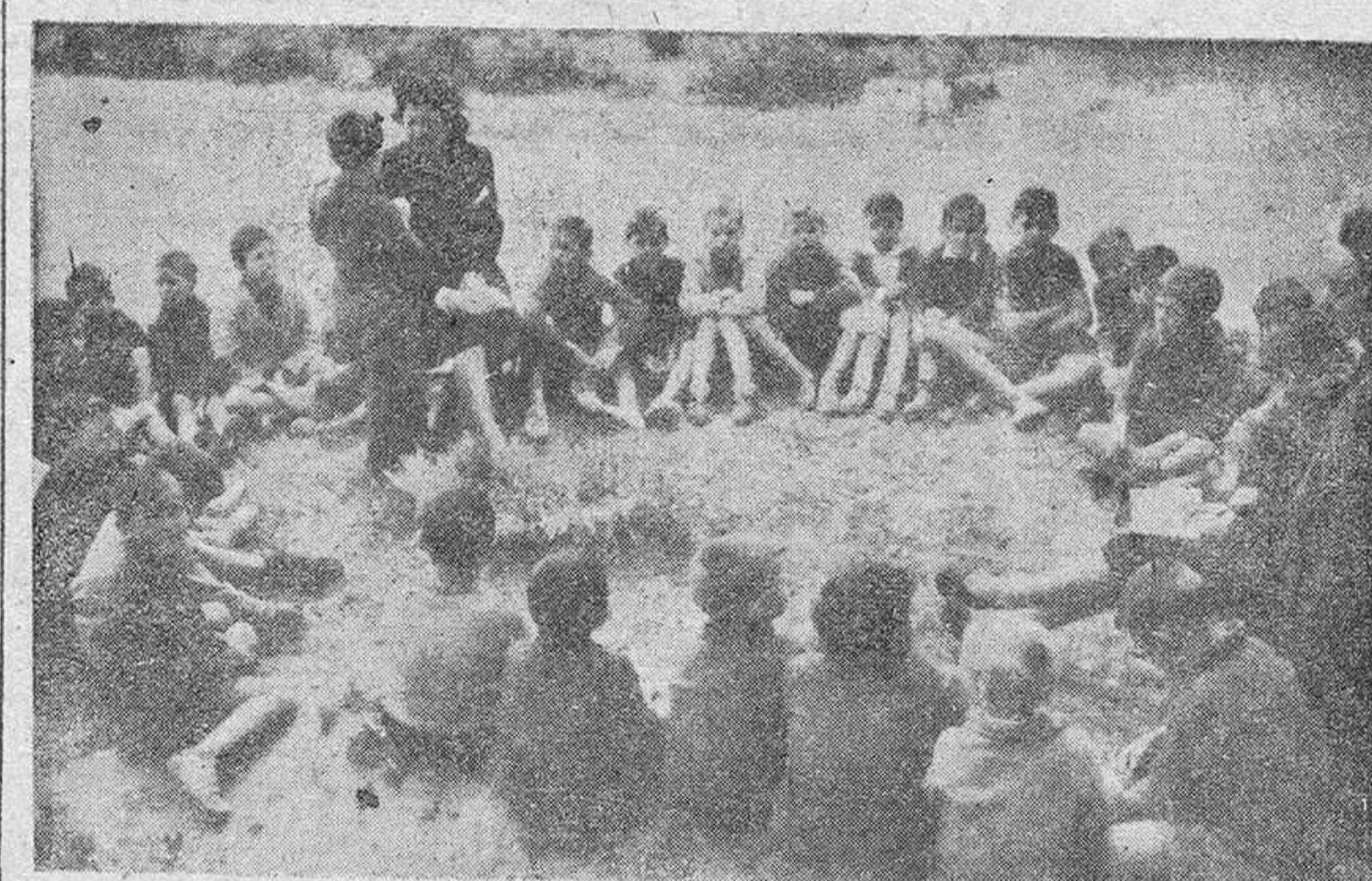
Otras dos fotografías dan idea de la labor que en el mes de mayo hizo la Sección Femenina preparando a los niños que nos asistidos en los Comedores de Auxilio Social y que hicieron la Primera Comunión.