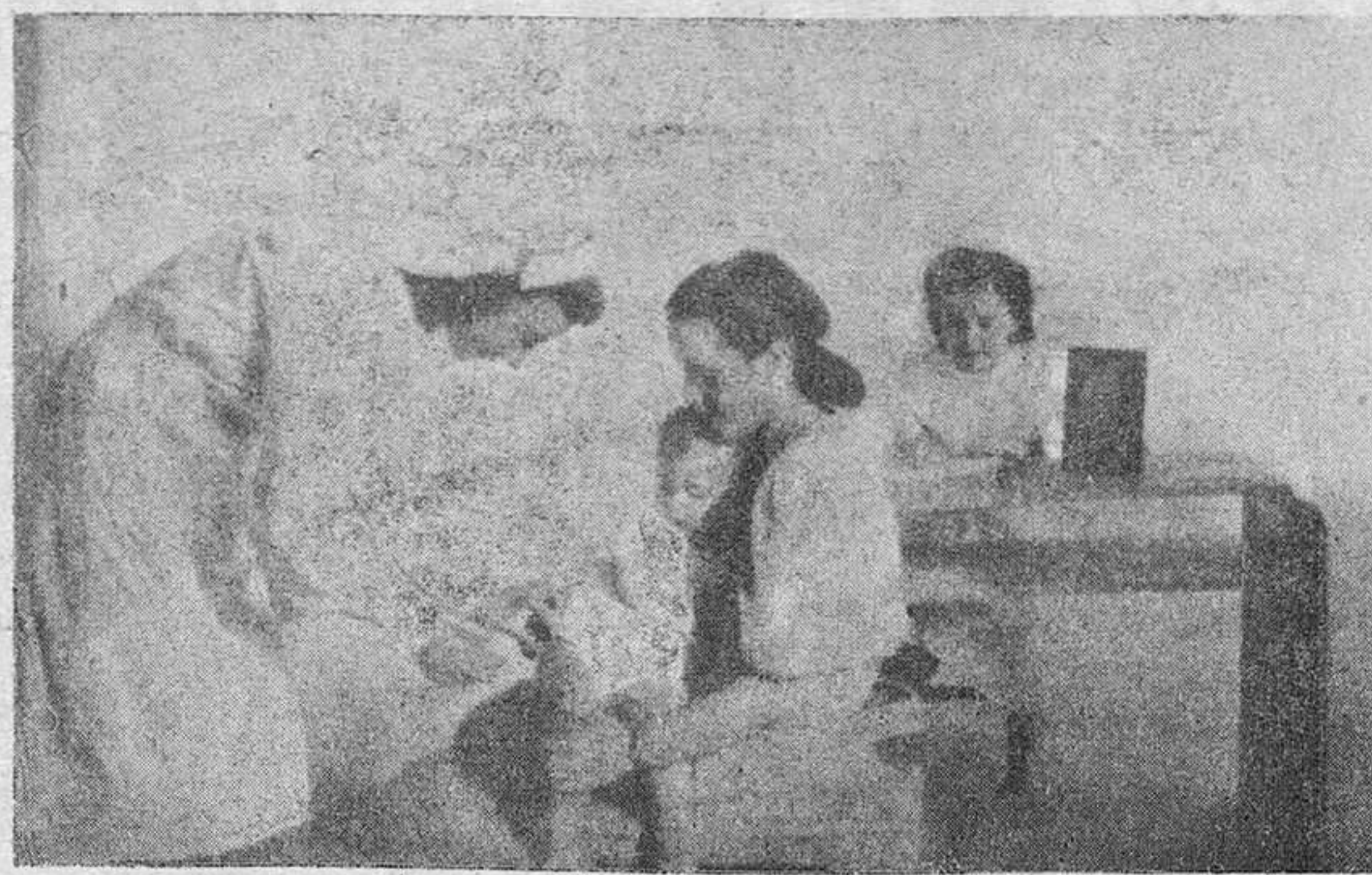
Desde nuestra última Hoja han sido muchas las actividades que esta Sección Femenina ha tenido. Como ya se han publicado algunas de estas en la Prensa diaria, solamente vamos a publicar las que últimamente se han llevado a cabo: entre estas está la intensa labor que en la Campaña de vacunación antidiftérica ha hecho la Sección Femenina. Durante veinticinco días ha cooperado con el Instituto provincial de Higiene en la vacunación que en la capital y pueblos se ha llevado a efecto. A continuación se publica una fotografía de esta labor.