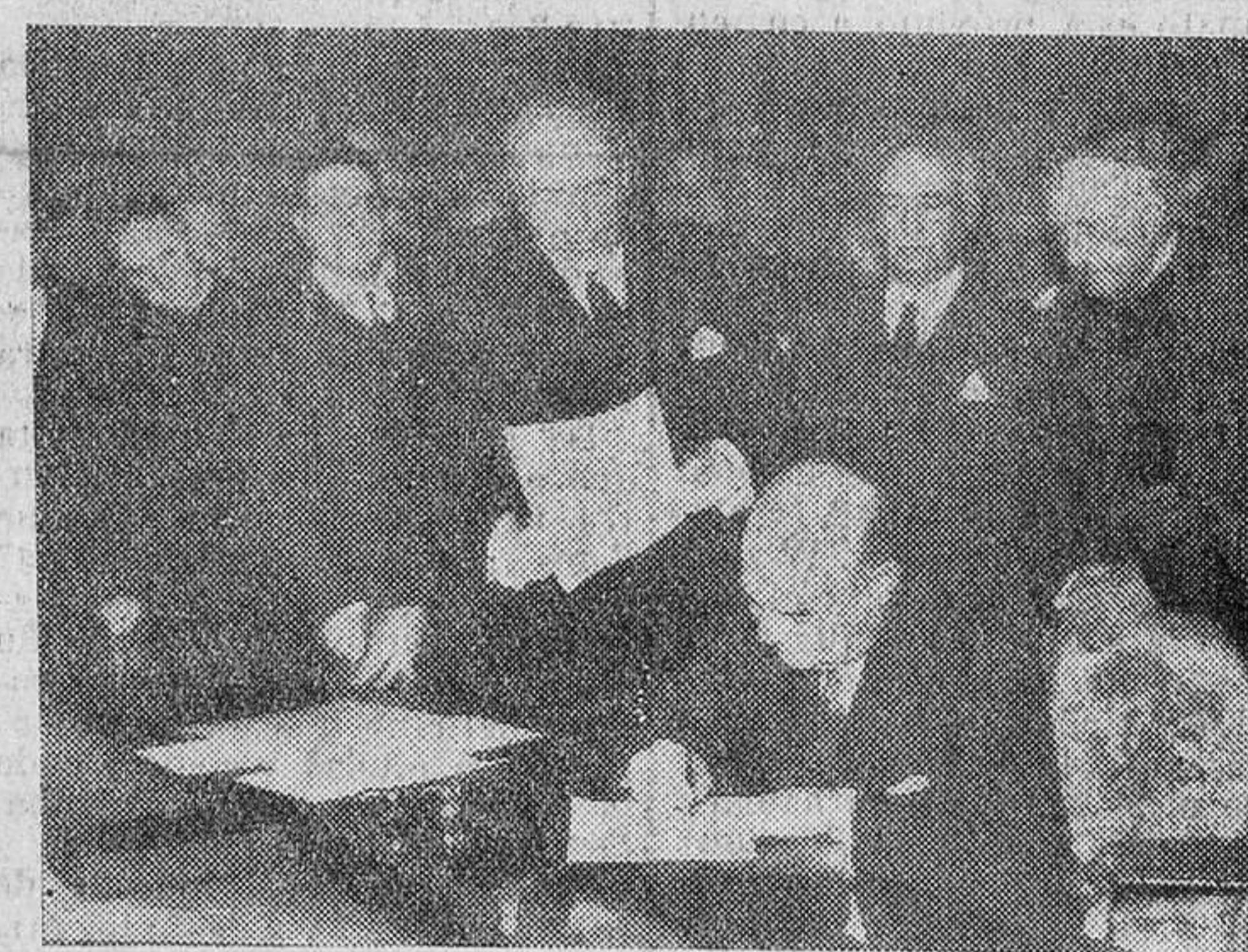
MADRID.—Un momento del solemne acto durante el cual se hizo entrega del Códice del "Poema de Mio Cid" por la Fundación "Juan March" al Estado español. En la foto, don Juan March Cervera firmando el acta ante notario, Ministro de Educación Nacional y otras personalidades.