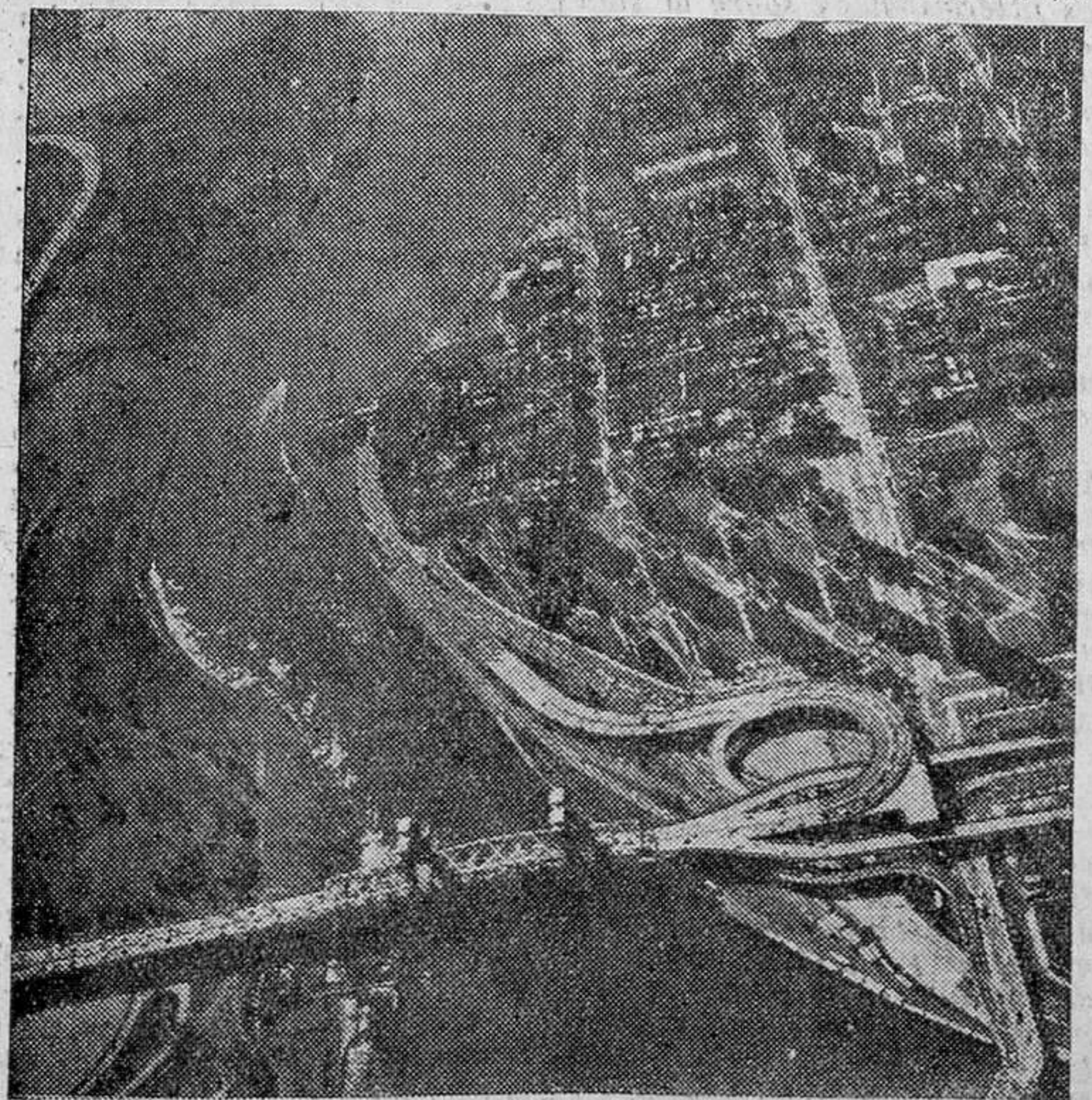
Nudos de carreteras en la ciudad de Nueva York.