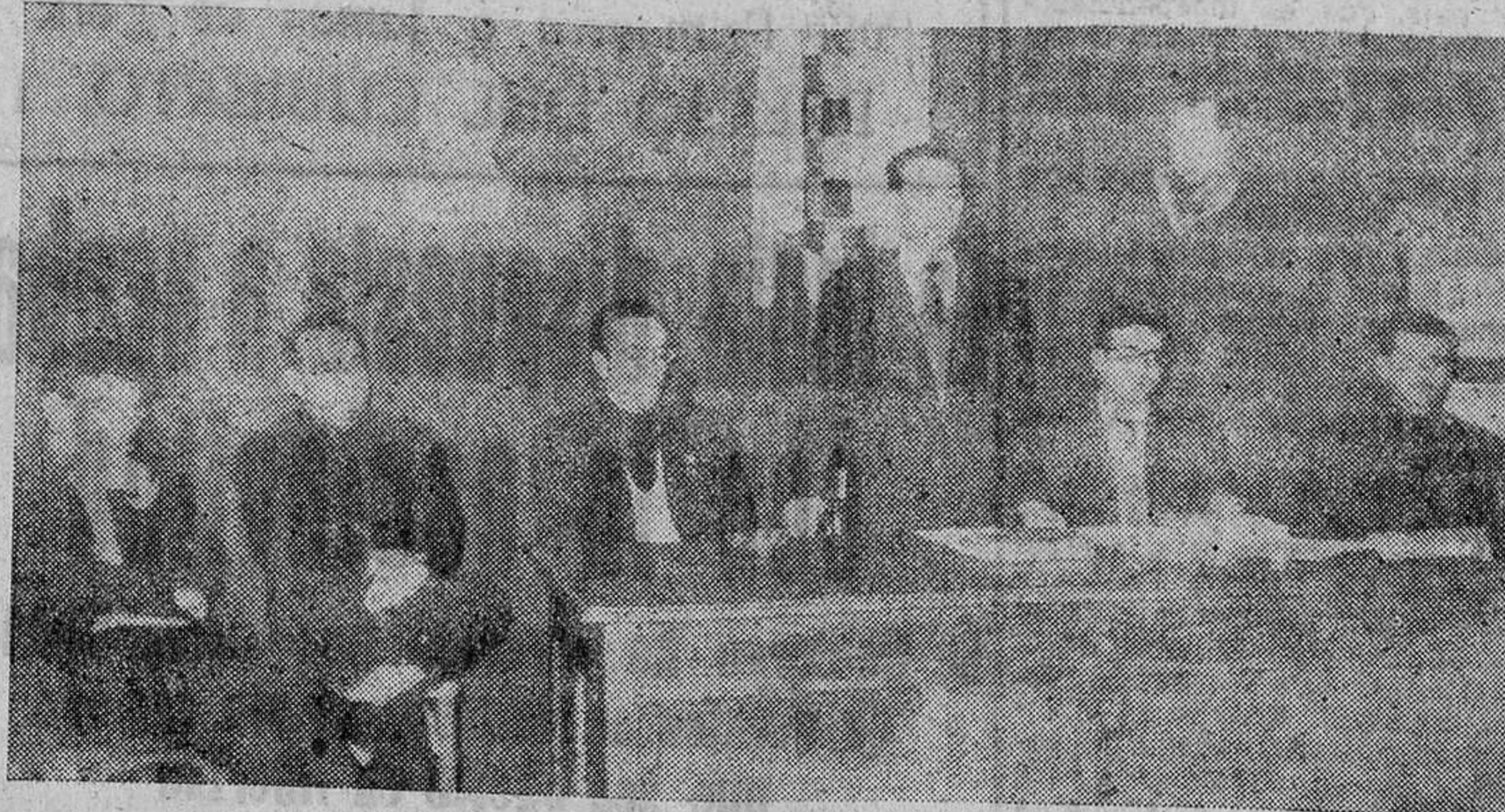
El Subjefe Provincial en el acto de clausura.

Durante dos jornadas se estudiaron todas las cuestiones comunes al frente de Juventudes y a la Escuela