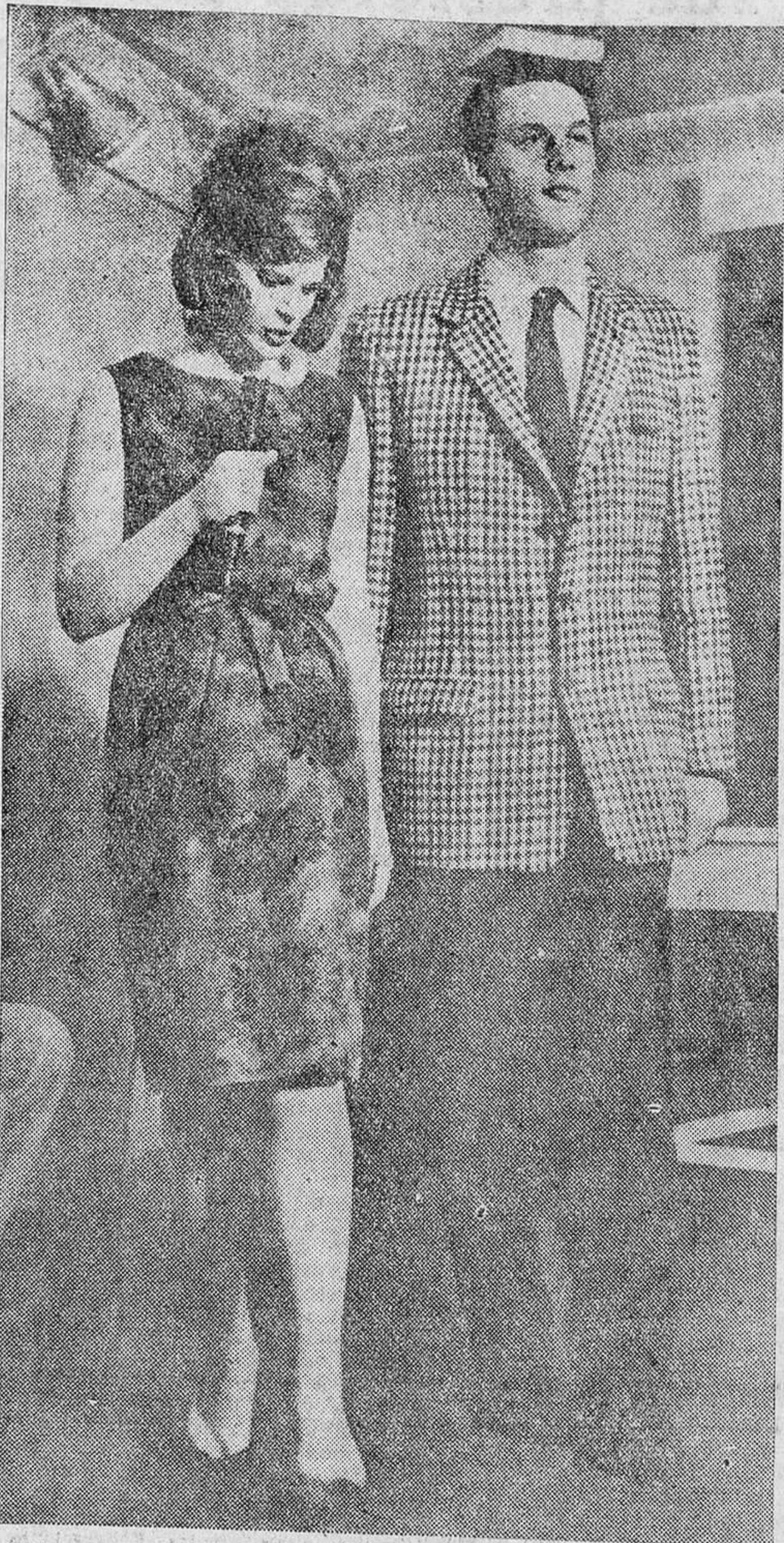
Una lección de buen vestir la da siempre la señora Windsor. Ahora, unos jóvenes británicos han creado la "Charm School" para inculcar la elegancia en la juventud.

En el reino de la moda se ha experimentado una profunda transformación. Ese sentido del encanto, que era potestativo y se encontraba en exclusiva en la mujer, acaba de ser ampliado en Inglaterra hasta el hombre, que de la noche a la mañana se ha encontrado con la