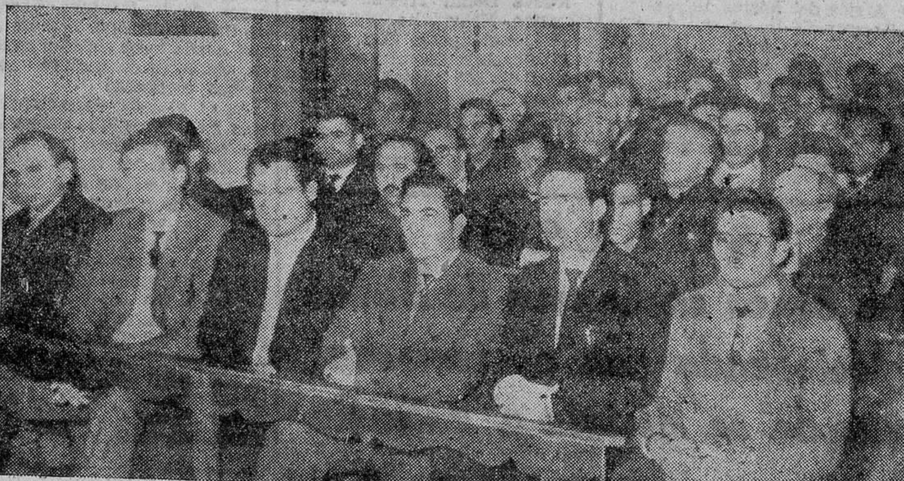
Maestros participantes en la reunión convocada por el Frente de Juventudes.