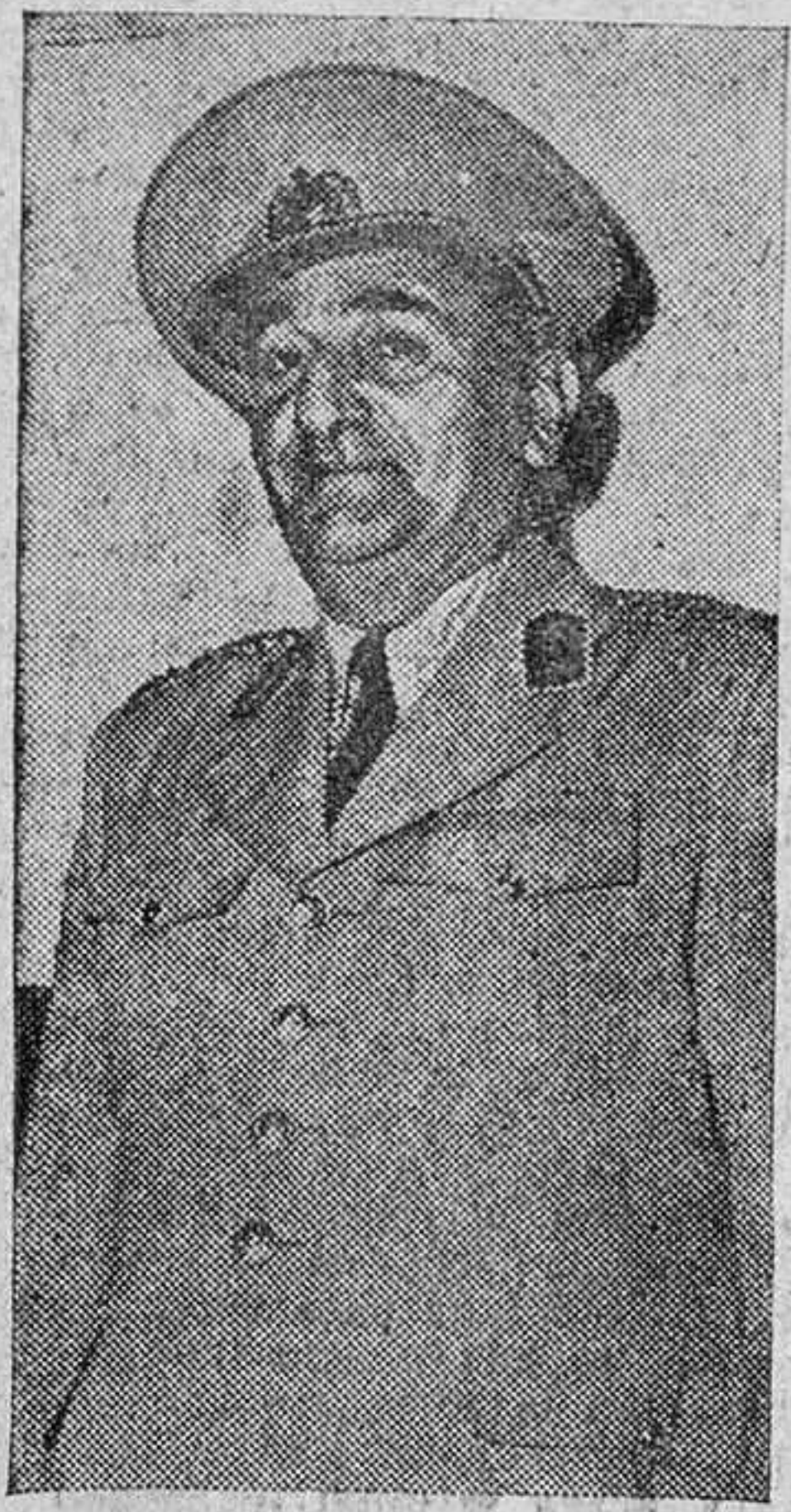
Cemal Gürsel, presidente de Turquía.

Estambul, 29.—El presidente Cemal Gürsel ha sufrido un ataque cardiaco, ha sido anunciado en círculos oficiales. En la Secretaría de la presidencia, se ha declarado, sin embargo, que Gürsel, que cuenta sesenta y cinco años de edad, se halla muy mejorado después del ataque y que los médicos le han aconsejado descanso.—Efe.