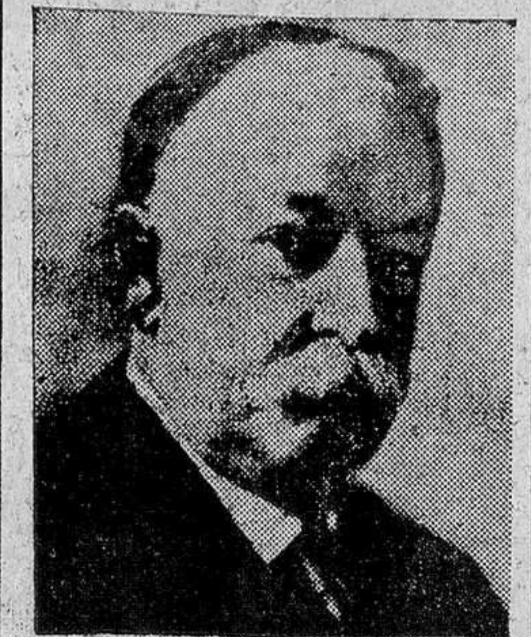
WILLIAM HOWARD TAFT

tras, el poder estaba en manos del presidente Buchanan, del partido demócrata —Lincoln era republicano—, un hombre del Sur, honesto, pero mediocre. Las nubes se acumulaban en el horizonte, puesto que los Estados del Sur, al tener noticia de la elección de Lincoln, se pre-