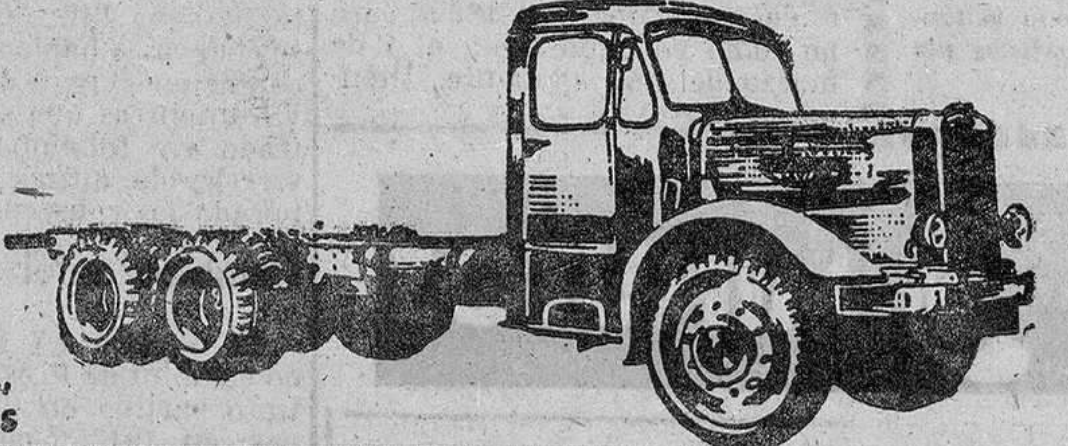
Leyland "Super Hippo" de 150 HP. y carga útil de 14 toneladas

El camión inglés Leyland ha conquistado el mercado mundial por sus características de potencia, economía, resistencia y duración.