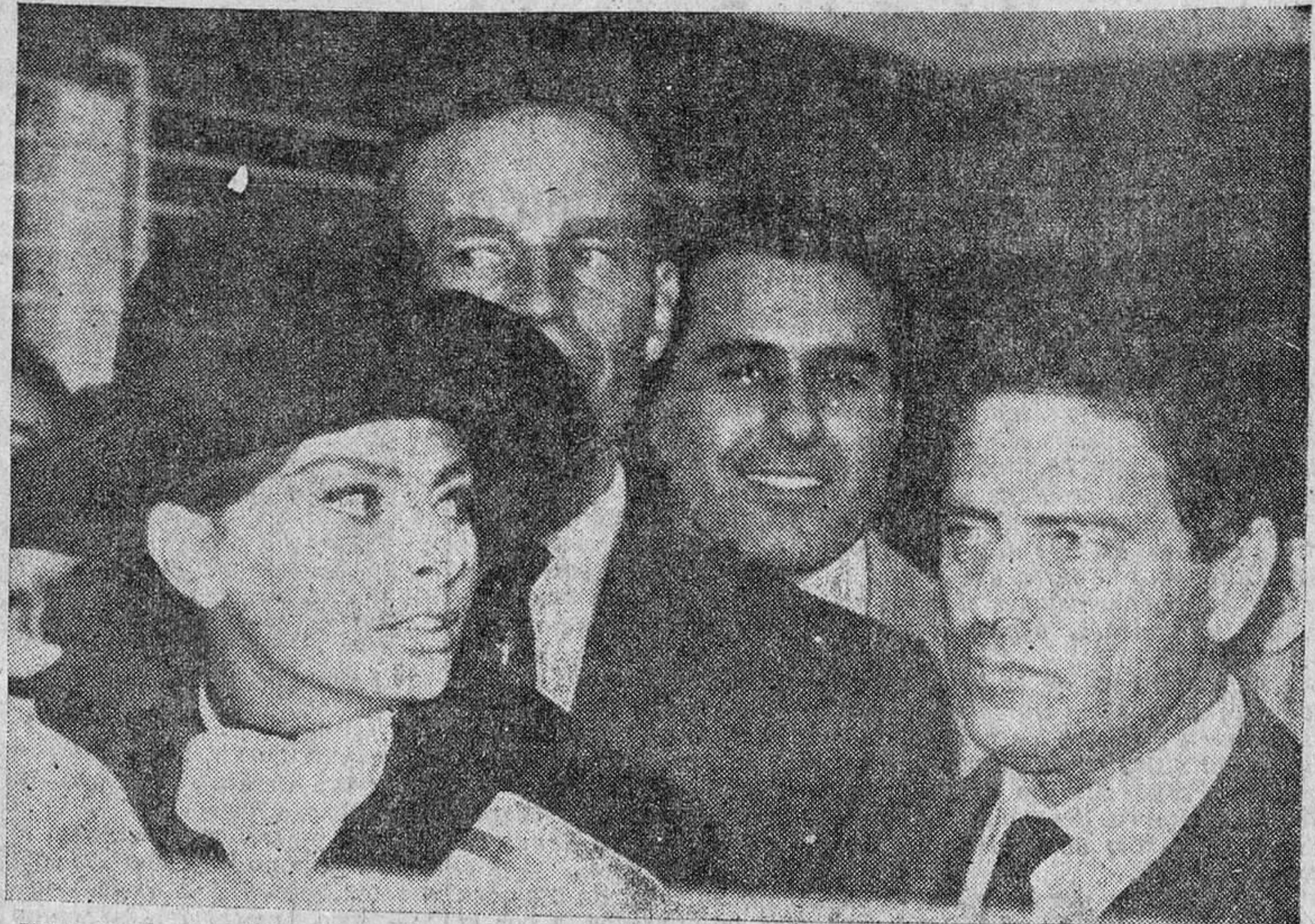
Ha llegado a Madrid la popular artista italiana Sofia Loren para interpretar el papel de "Doña Jimena" en la película "El Cid". La acompañan su maquillador, su secretaria y su doncella. Fue recibida en Barajas por Charlton Heston y Raf Vallone, protagonistas masculinos del film en los papeles de Rodrigo Díez de Vivar y Conde Ordóñez, con quienes aparece en la fotografía en medio del tumulto de admiradoras que se reunieron en el aeropuerto. En nuestra página de espectáculos publicamos un amplio reportaje sobre Raf Vallone.

Fue recibida por «El Cid» (Charlton Heston) y el Conde Ordóñez (Raf Vallone)