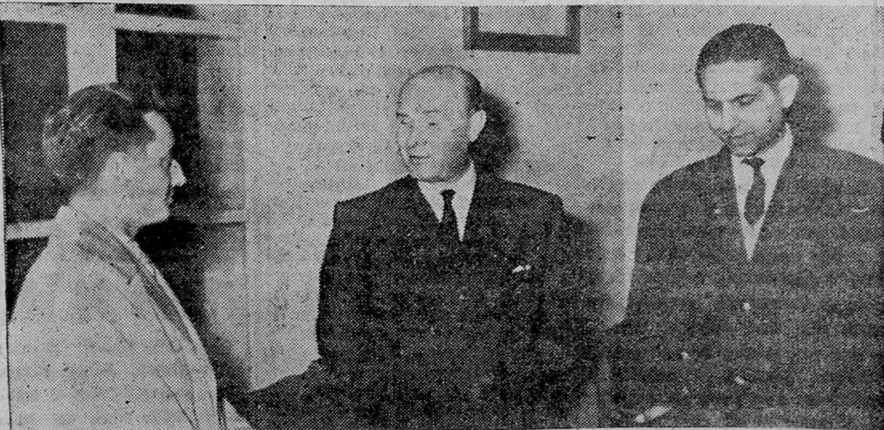
El Jefe Provincial del Movimiento con el Rector de la Universidad, a su izquierda, y el Jefe del S. E. U., a su derecha.