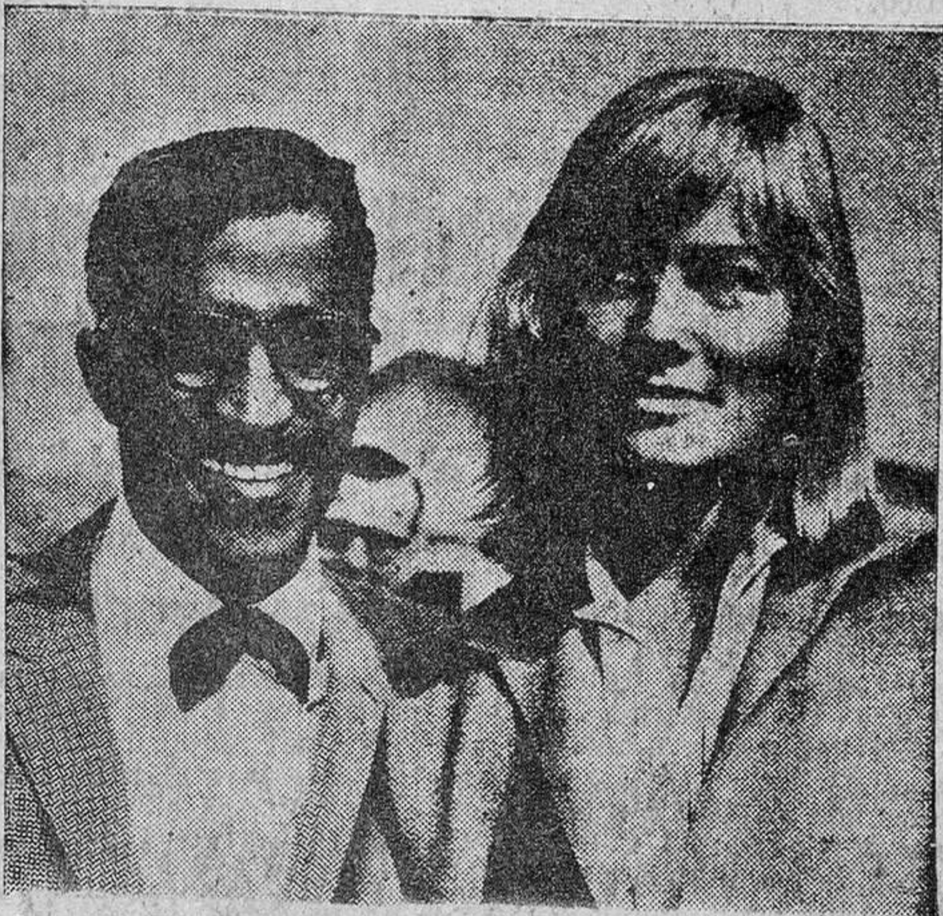
La actriz May Britt en compañía del cantante Sammy Davis, con quien se ha casado.

Hollywood, 14.—El cantante negro Sammy Davis ha contraído matrimonio en esta ciudad con la actriz May Britt, intérprete de "El baile de los malditos", la cual sufre los efectos de una afección