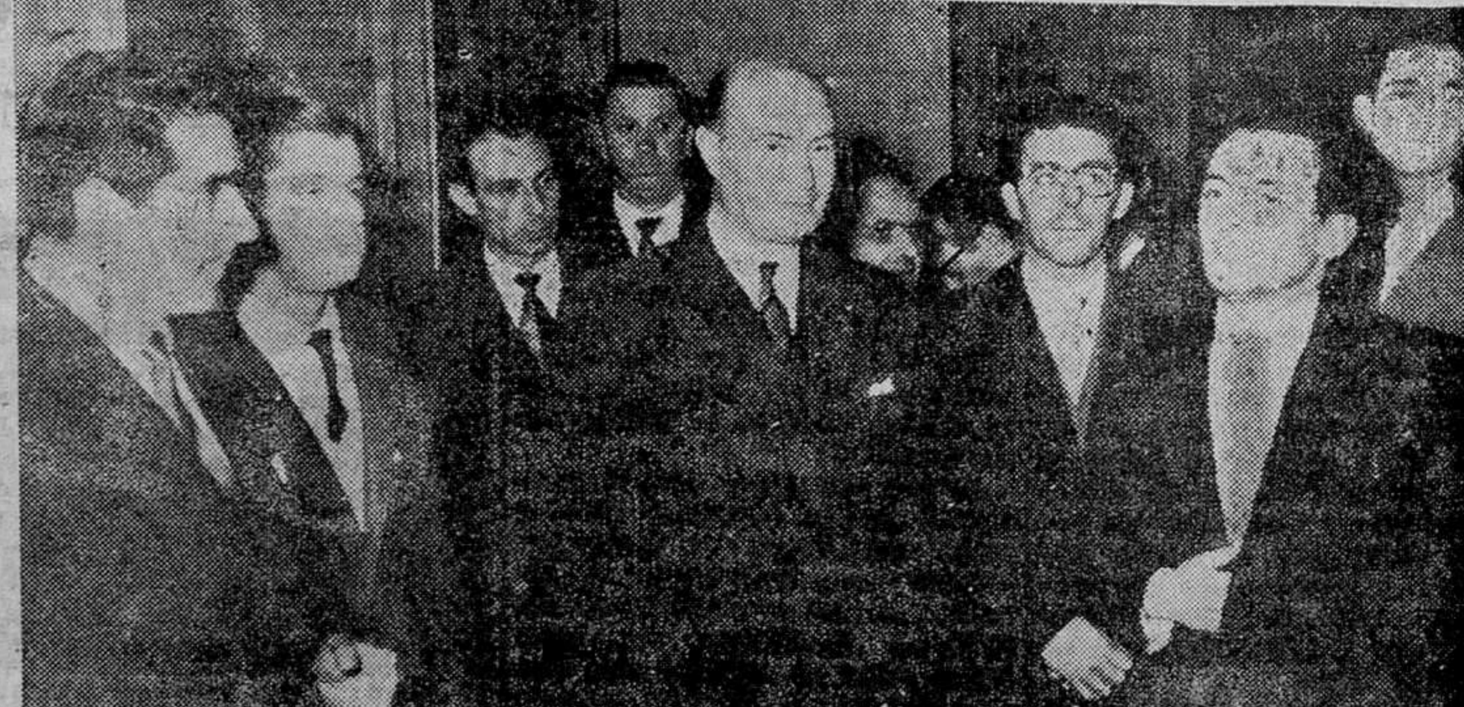
Recepción en el Ayuntamiento.