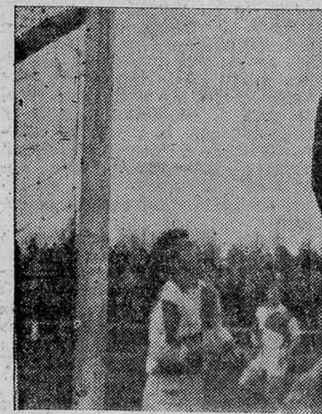
Guti, bien amparado por su zaga, se hace con la pelota, anticipándose a la acción del ariete rojiblanco, Félix.

Conforme avanzaba el partido se ponía más del lado burgales. Estos ya habían marcado el primer gol al filo del final de la primera parte, y cuando marcaron el segundo, a los diez minutos de la continuación, ya vimos la derrota del equipo zamorano y sus lamentables consecuencias. Porque se observaba bien que