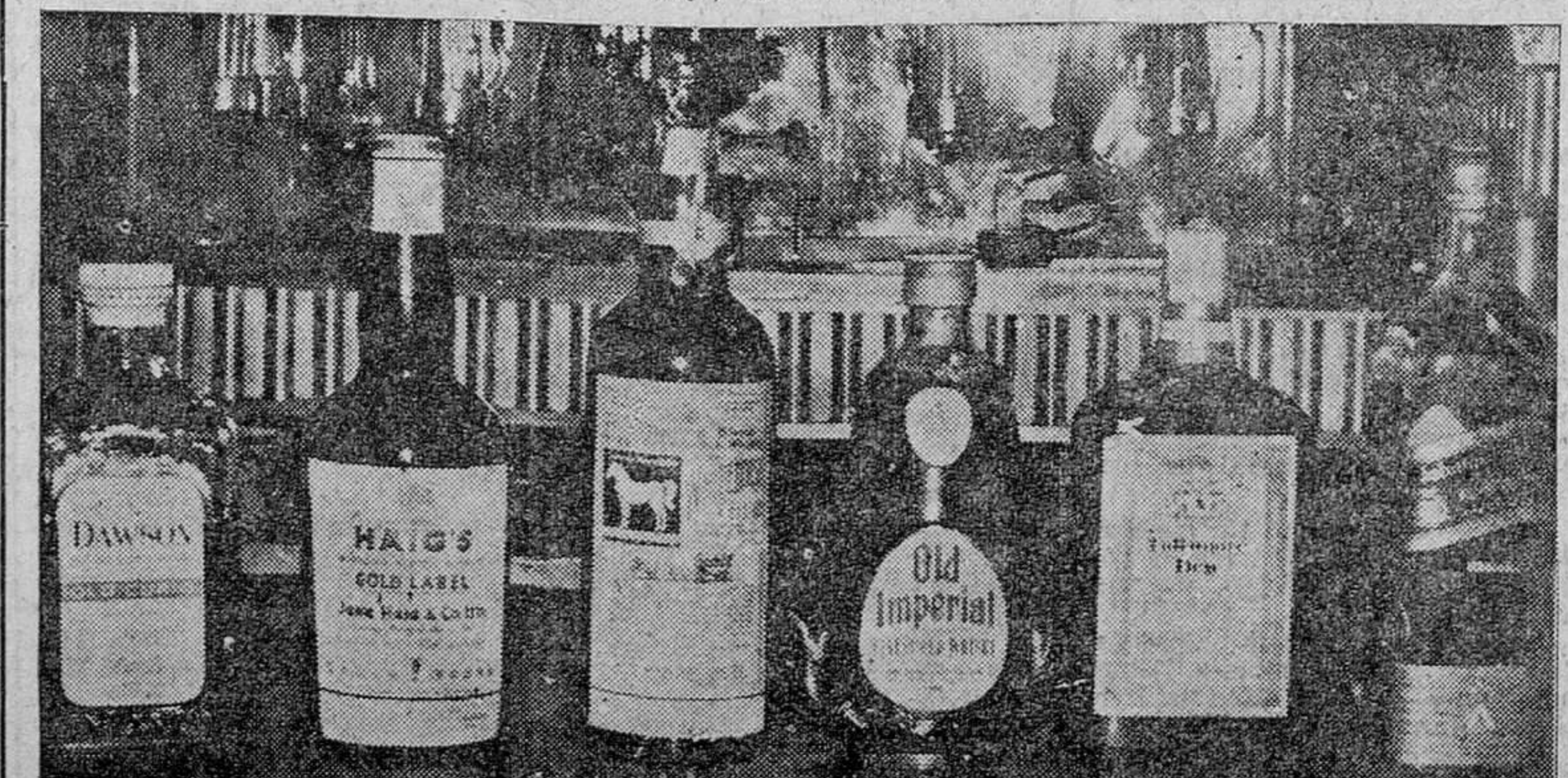
Botellas que por lo visto eran fáciles de falsificar.