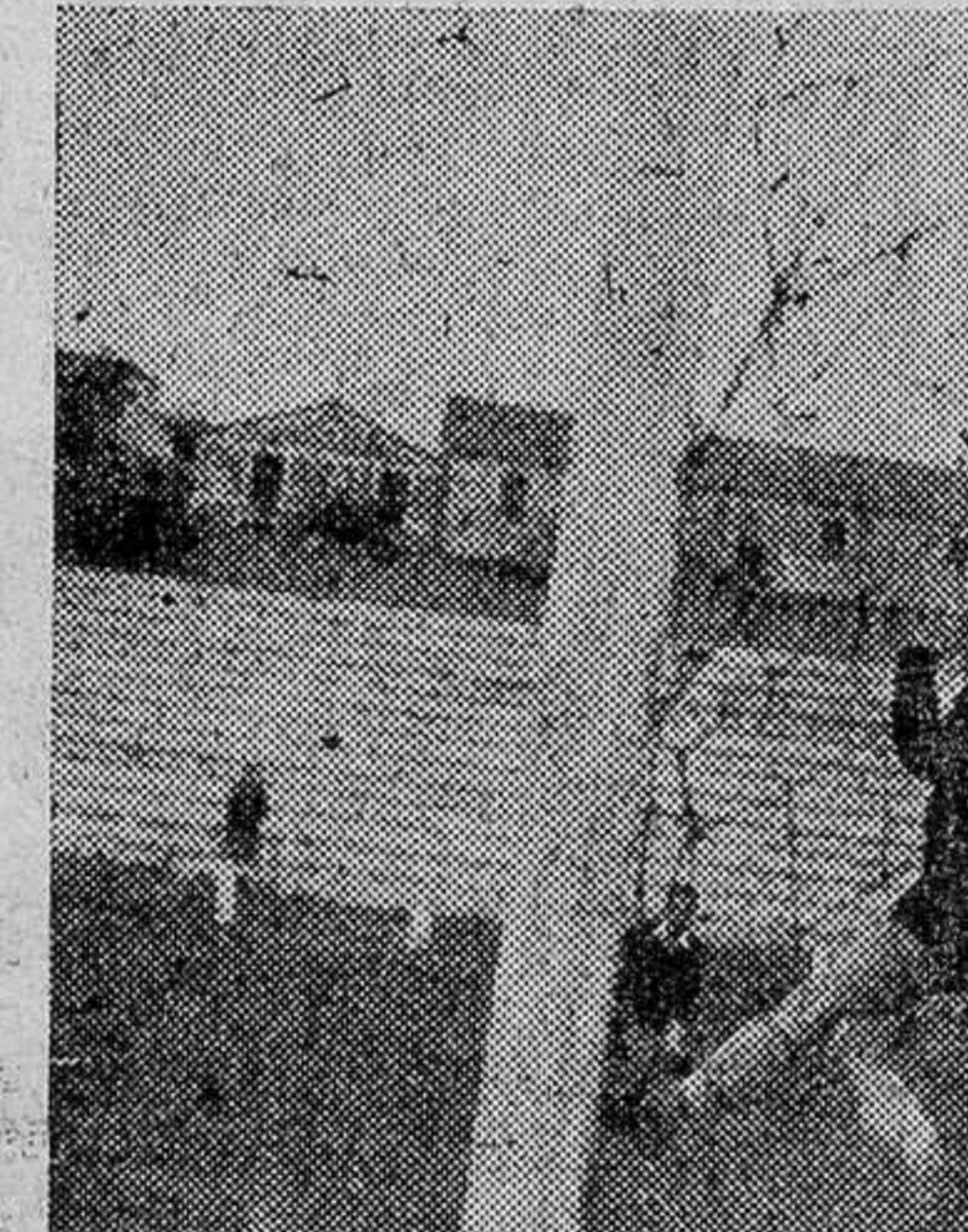
El meta burgales, en un arde de agilidad, desvia a córner, por encima del travesaño, un fuerte disparo del ataque zamorano.

A las órdenes del señor Román I, que tuvo algunos fallos, los equipos formaron así: Atlético: Herminio (Marce); Fasi, Casasola, Velasco; Ceta II, Marañón; Tino, Nano, Félix, Quinto y Jesús. Juventud: Guti; Julio, Herrero, Arsenio; López, Cubalilla; Arahuetes I, Josele, Diego, Arahuetes II y Rufino.