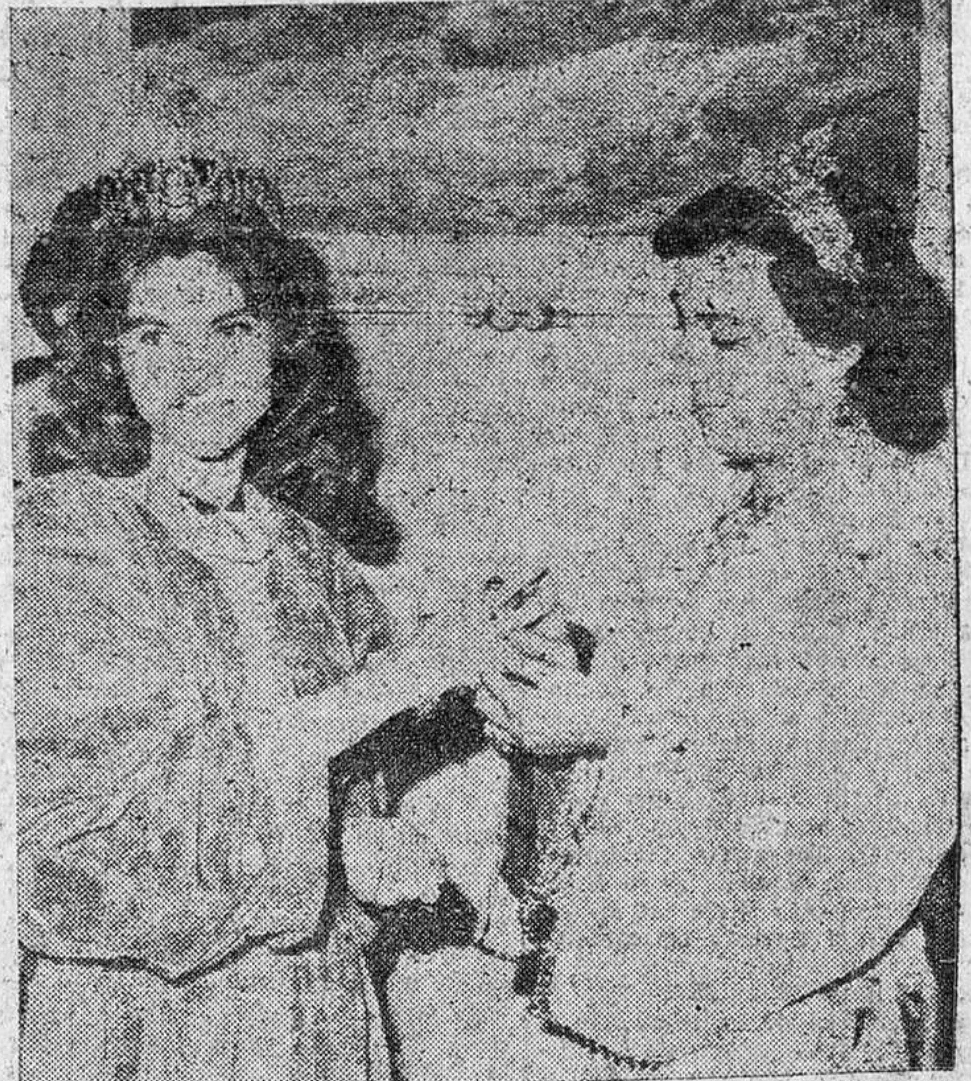
La princesa Lamia el Sohl y su hermana.

Mientras tanto, la Policía se halla completamente desasosegada, pues es éste un asunto delicado por la categoría de las personas expoliadas y trabaja activamente para ver de localizar la más leve luz que la conduzca al esclarecimiento del hecho.