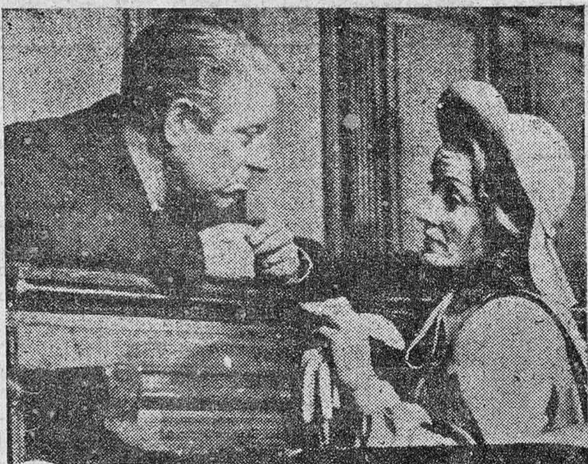
Marlene y Jean Gabin en la película "Martin Romagnac".

De fuente informada se ha revelado que la ceremonia religiosa de casamiento se celebrará en la iglesia de Santa Gudula y San Miguel, almenada construcción medieval. No ha habido inmediata confirmación de la especie de que el rey Balduino tenga intención de visitar España antes o después de la boda. La última visita del monarca belga a España fue en 1959 y lo hizo en calidad de turista particular. —Efe.