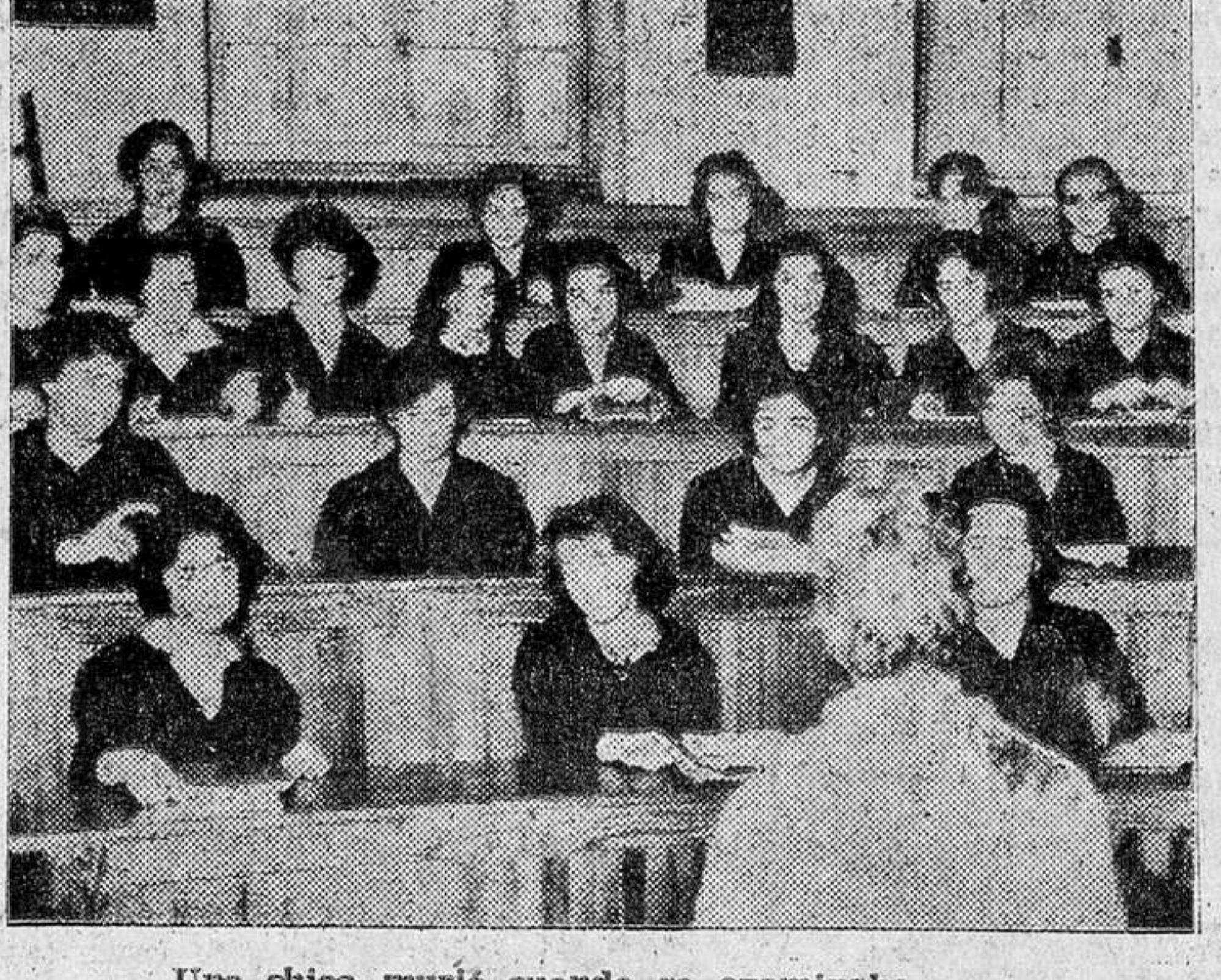
Una chica murió cuando se examinaba.

Además, muchos de los que estudian están sujetos a trabajos profesionales que les impiden ir a examen cuando se les llama. Van cuando pueden. Gracias a la doble oportunidad, son muchos, trabajadores o estudiantes a secas, los que han ido terminando Bachillerato y carreras. Sólo porque en Italia se trate de suprimir la segunda, no hay suficiente causa, para hacer lo mismo aquí. Serán precisas razones verdaderamente convincentes. ¿Podría ser bueno suprimir no solamente los de septiembre, sino también los exámenes de junio? ¿Por qué no? ¿Por hoy por hoy, no han decidido qué otra garantía de aptitud puede sustituir a ésta. En España así están las cosas acerca de esa cuestión. Entretanto, no quitemos a los estudiantes las posibilidades de pasar de un curso a otro de que ahora disfrutan. ¿Es que los exámenes son la última palabra y no lo han sido siempre y lo seguirán siendo? Lejos de nosotros sostener esa tozta postura. LUIS A. VILLALBA