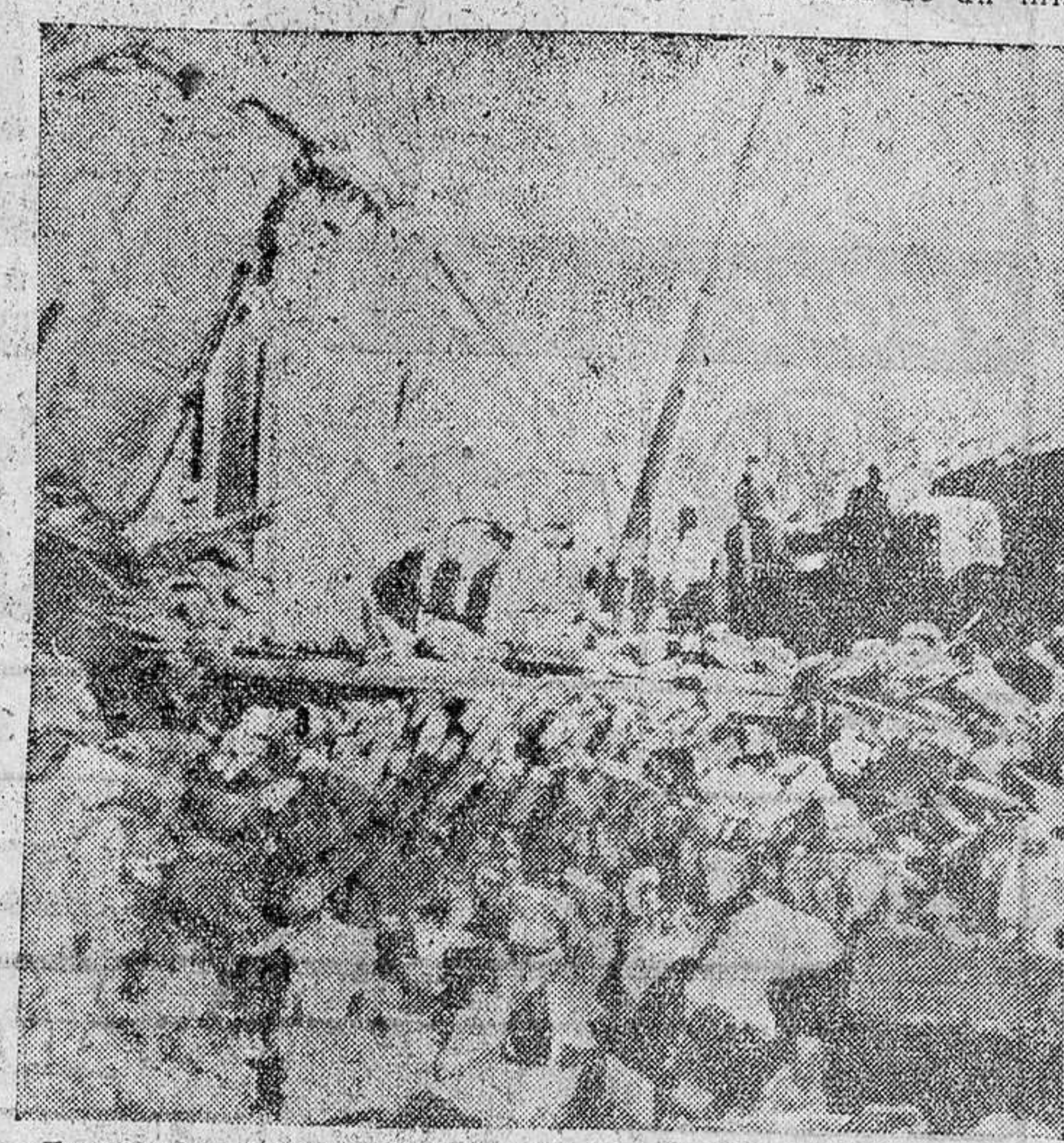
Esta fue la estampa apocalíptica de uno de los sectores de Chile afectados por el terremoto.

de kilómetros en derredor, destruyendo vidas —más de diez mil—, removiendo lugares y sumergiendo pueblos o lo que es igual, empujando a menguar la geografía americana.