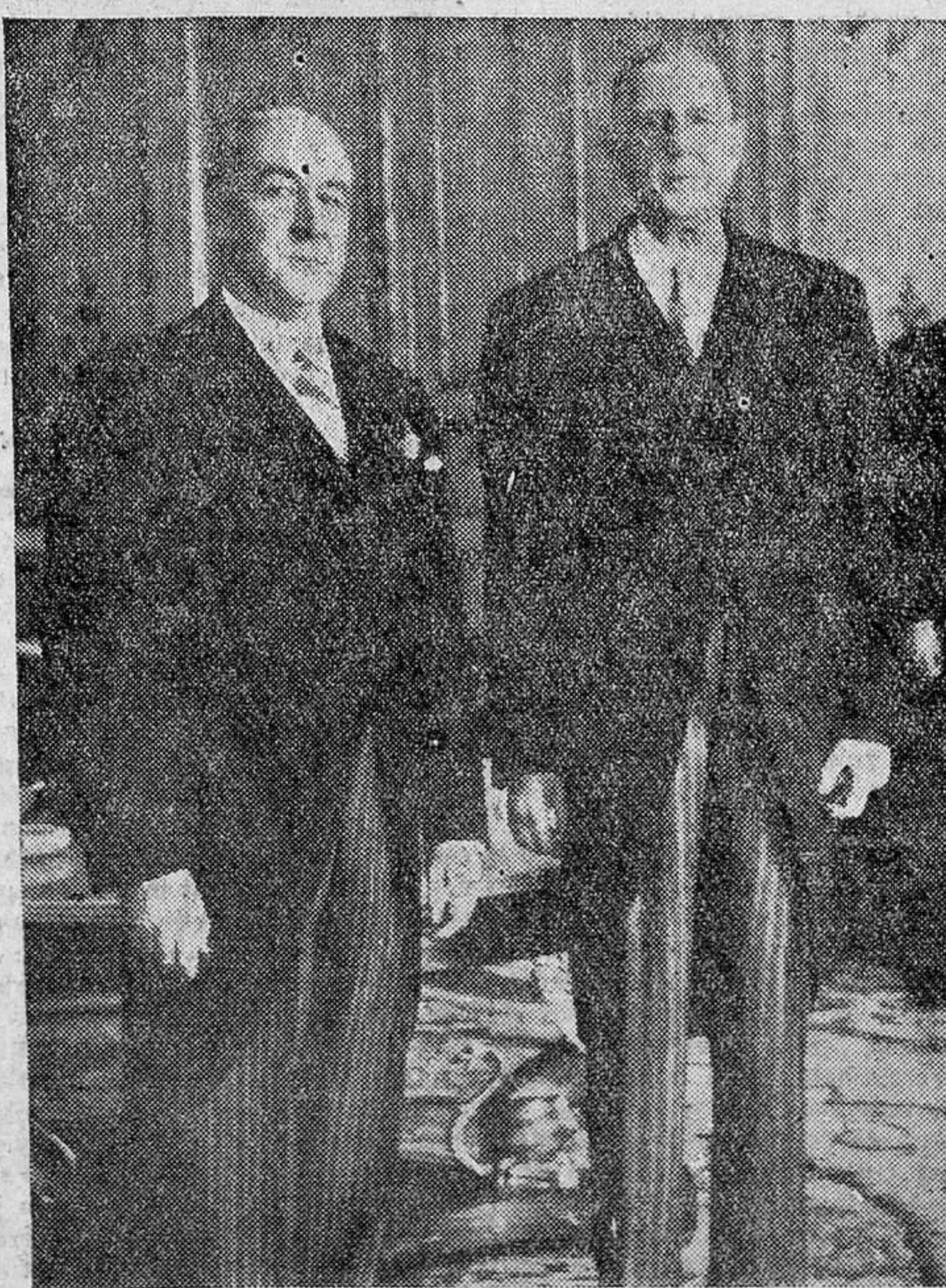
Don José María de Areilza, nuevo embajador de España en Francia, presenta sus cartas credenciales al presidente de la República, Charles de Gaulle. La fotografía muestra el momento en que ambos salen del Palacio del Eliseo, después de efectuada la ceremonia.