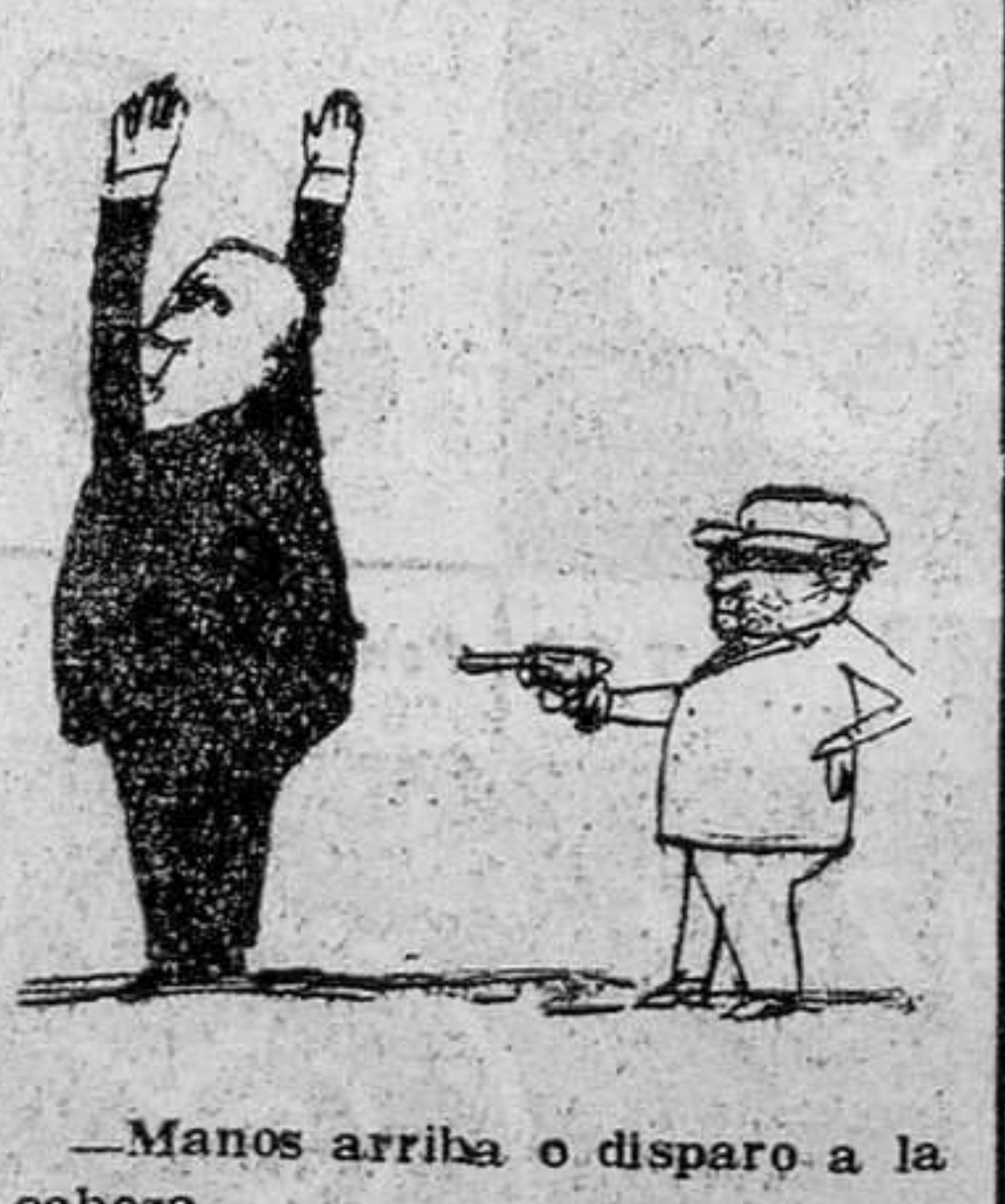
Manos arriba o disparo a la cabeza.