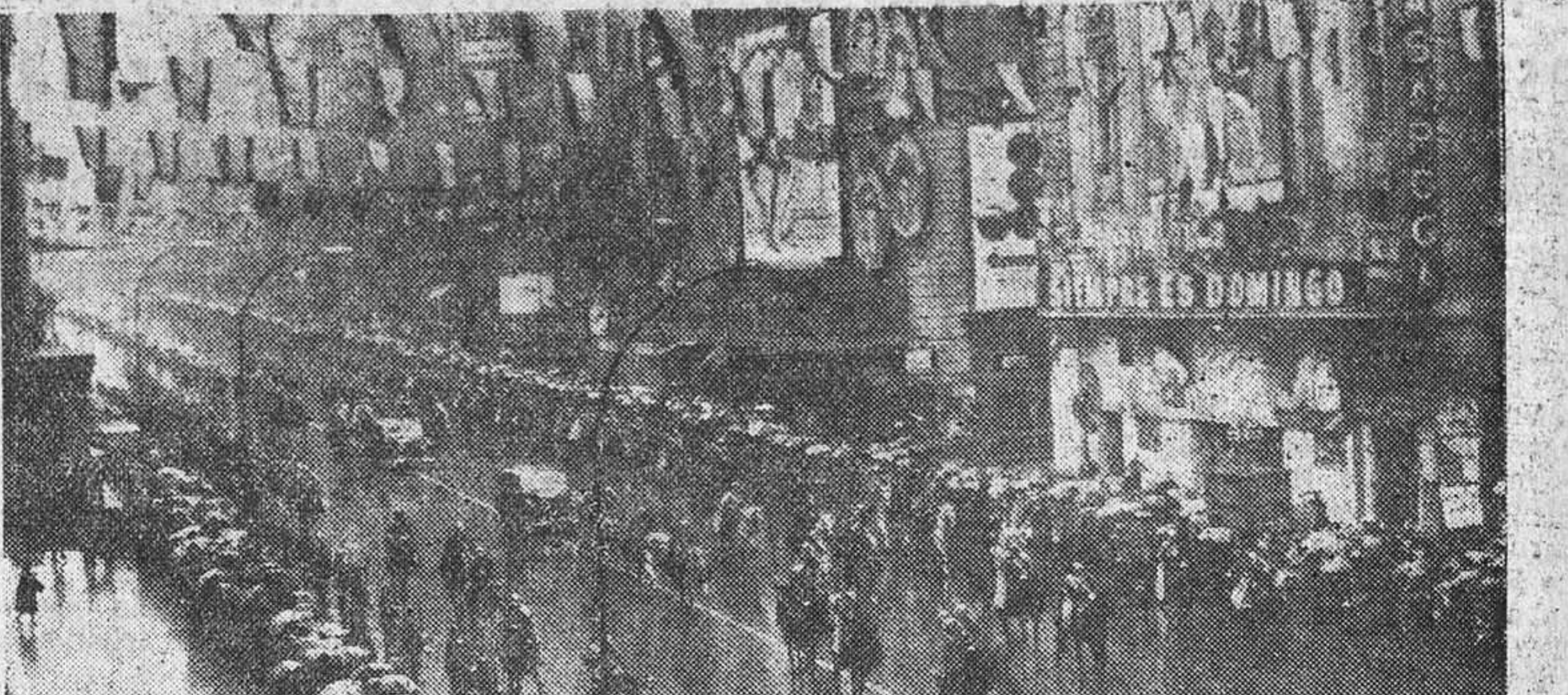
Un aspecto del paso de la comitiva del presidente portugués, Américo Tomás, acompañado del Jefe del Estado español, por las calles de Madrid, donde recibió el entusiástico recibimiento del pueblo madrileño.