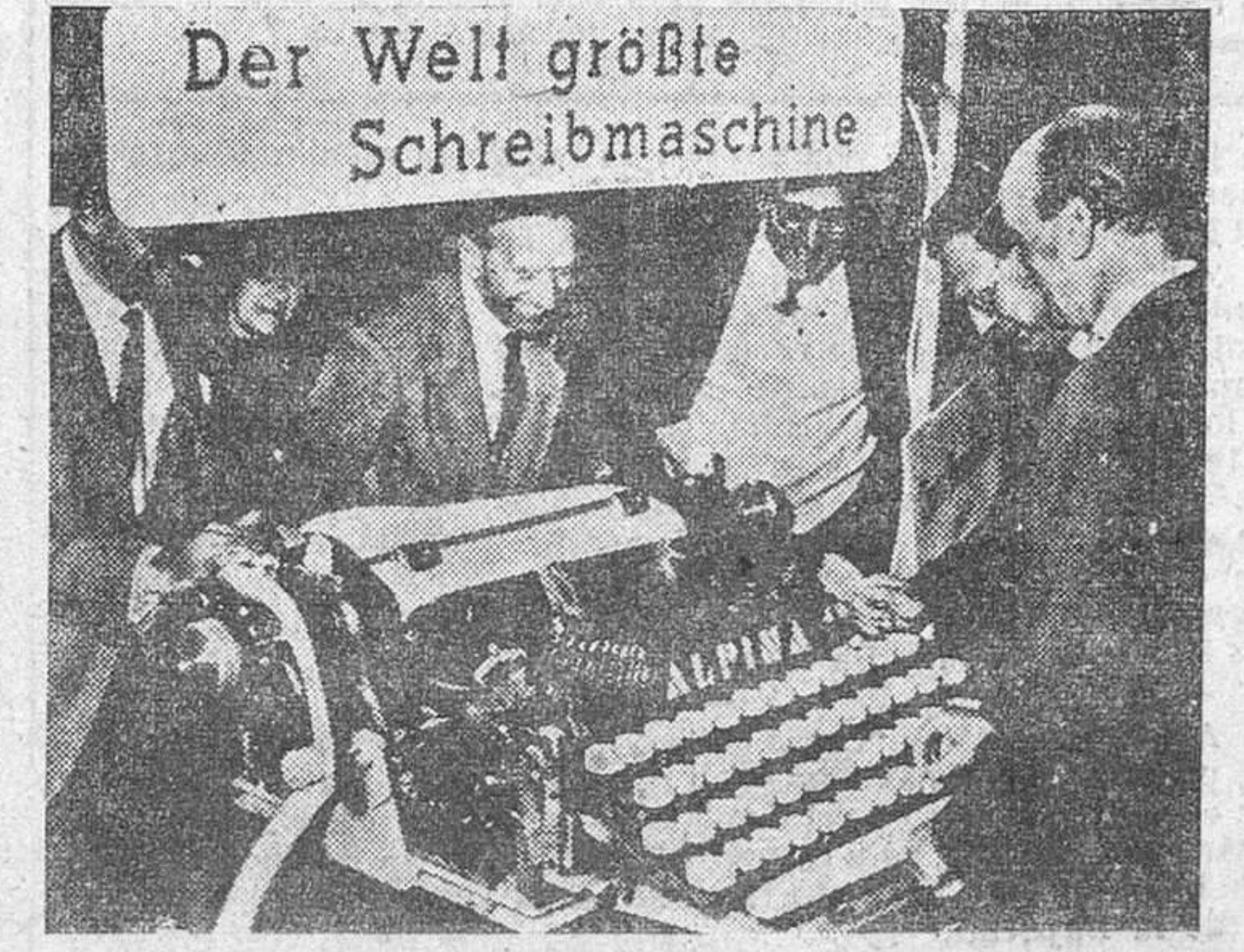
En la Feria de Otoño de Viena se exhibe esta gigantesca máquina de escribir, la mayor del mundo, según se dice.