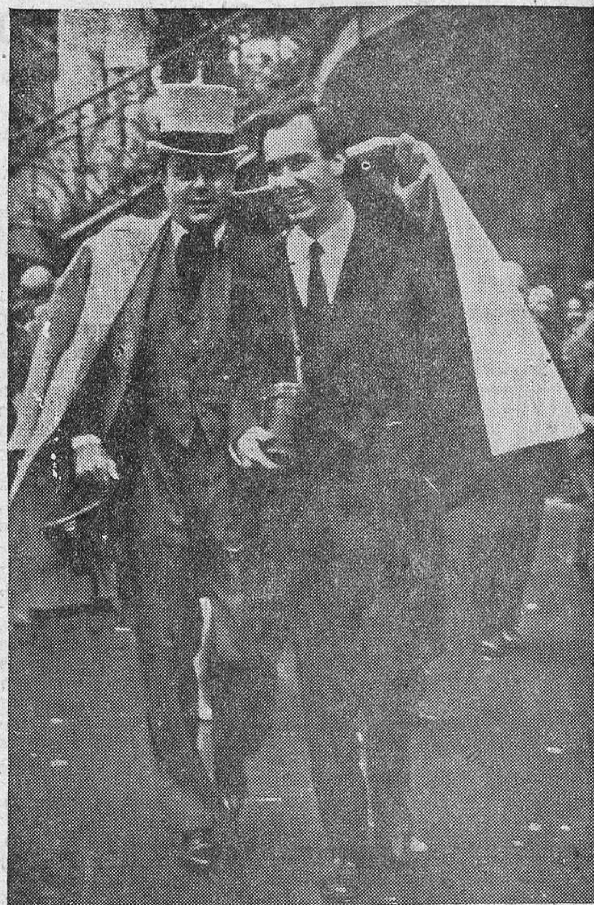
En una carrera de caballos, Ali protege del mal tiempo a su hijo Karim, actual Aga Khan de los ismaelitas.