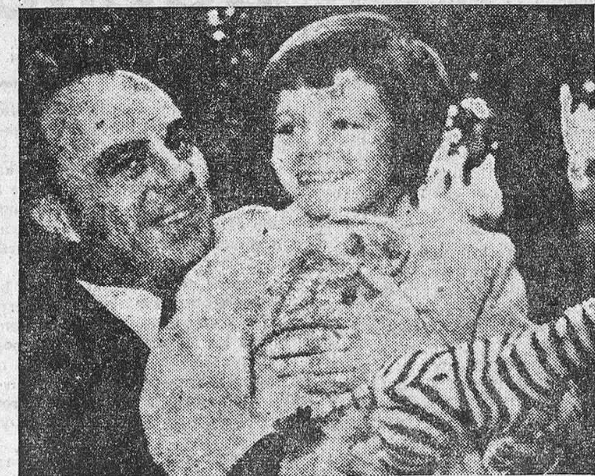
Ali con su hija Jazmina, fruto de su matrimonio con Rita Hayworth.