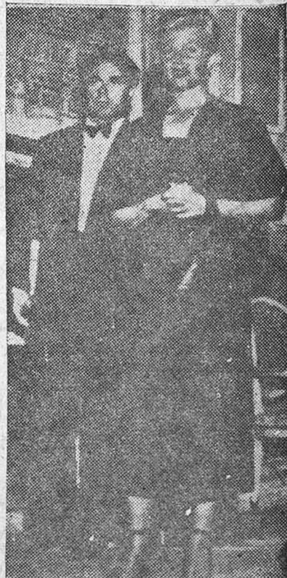
Ali con su segunda esposa, la famosa actriz cinematográfica Rita Hayworth.