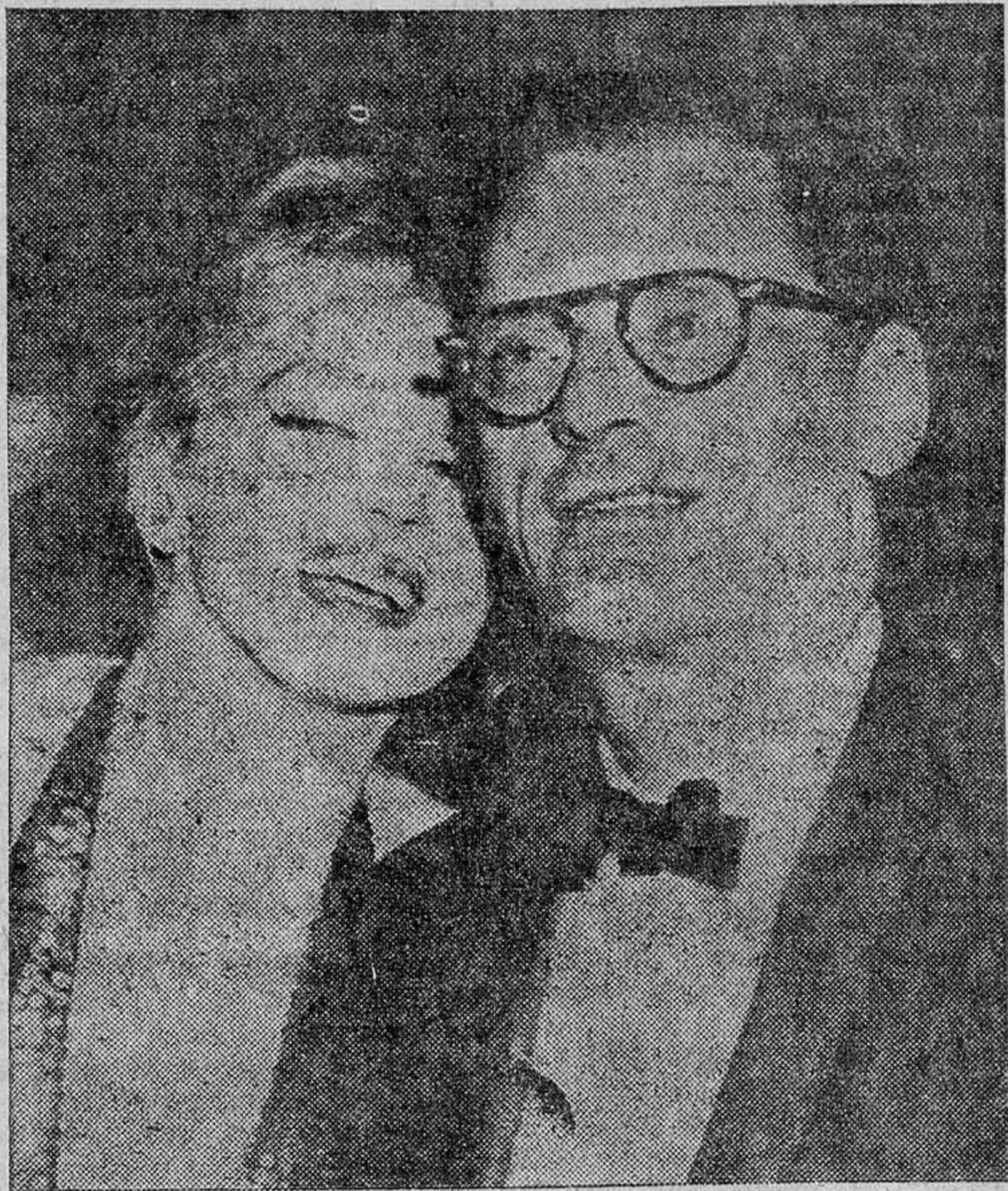
ANTES JUNTOS; AH ORA, SEPARADOS

no tengo que hacer el menor comentario —respondió.