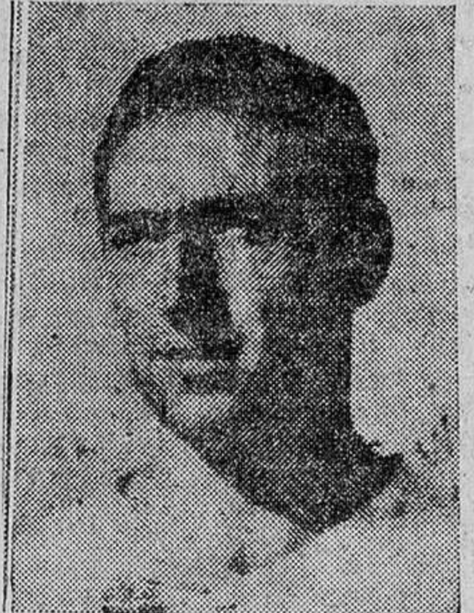
—No. Un poco cansado como todos... pero bien... bien.