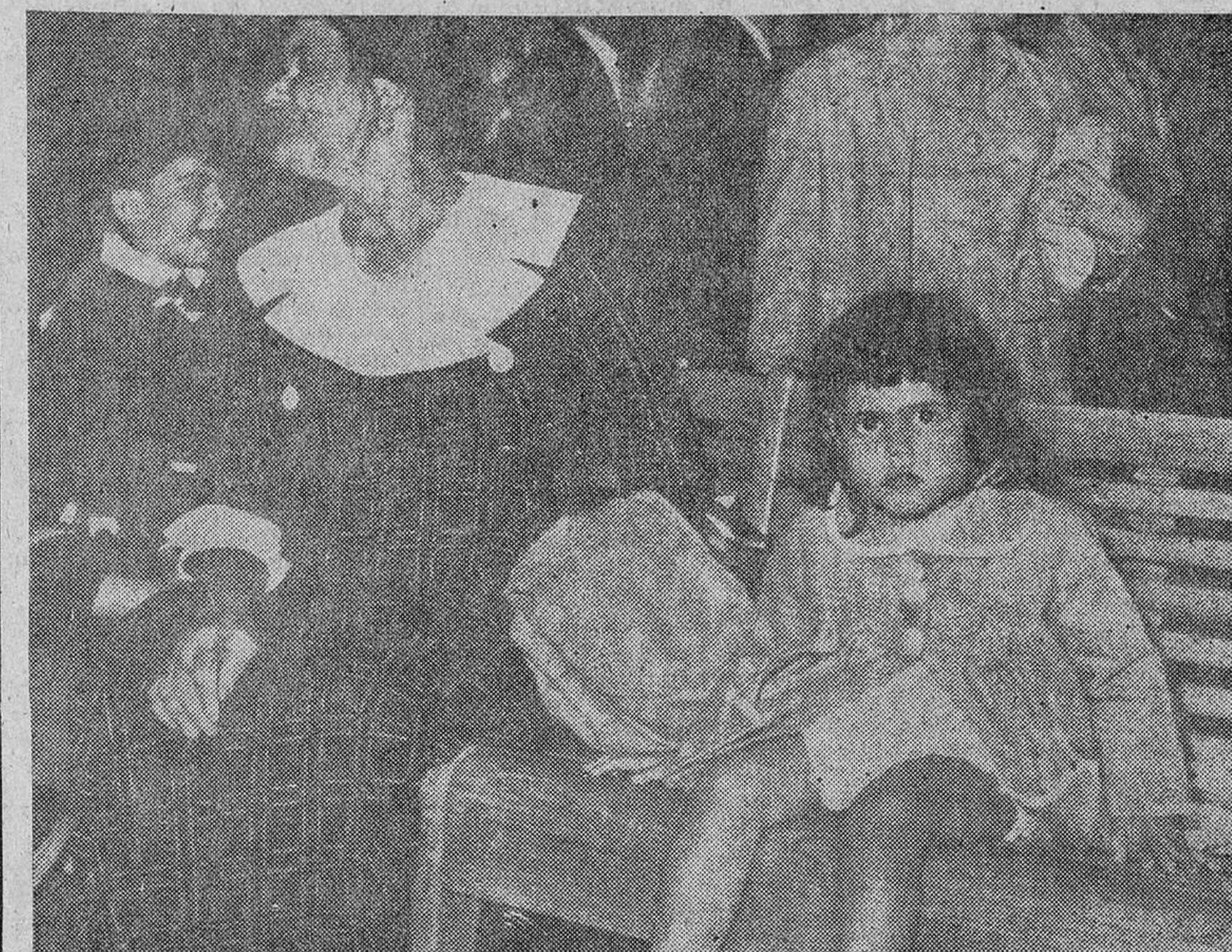
REPATRIADOS ESPAÑOLES EN EL "SANTA MARIA"