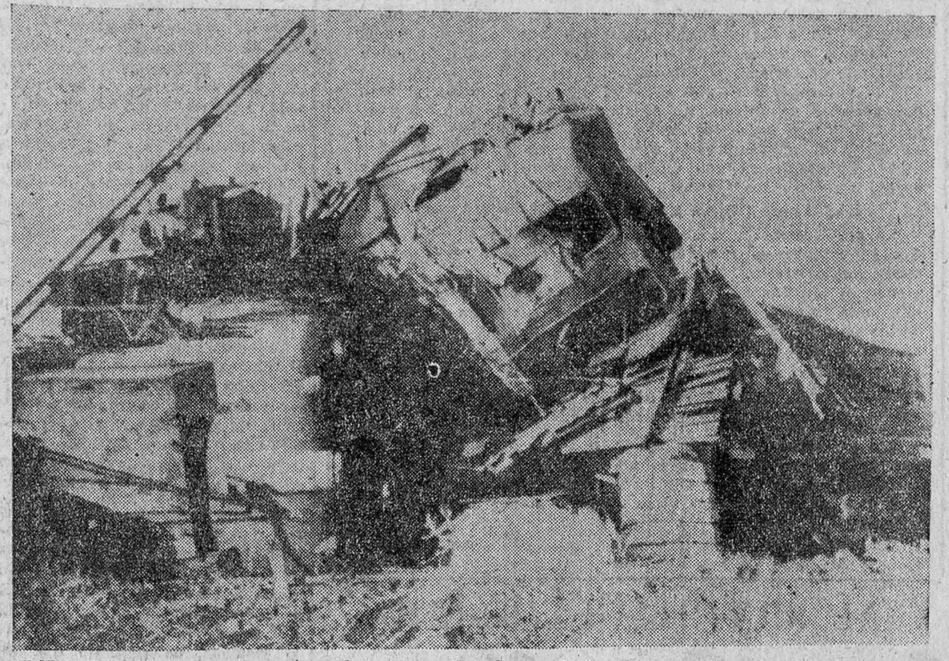
BARCELONA. — Vagones destrozados a causa del choque de trenes producido a las 7,25 de ayer, en la bifurcación de Casa Antúnez, en la vía férrea de Valencia-Barcelona, y en el que el expreso de Valencia chocó contra un tren de mercancías. Hubo que lamentar veinticuatro muertos y cuarenta y nueve heridos. En el tren de viajeros iban los componentes del equipo de fútbol de El Español de Barcelona, que resultaron ilesos.