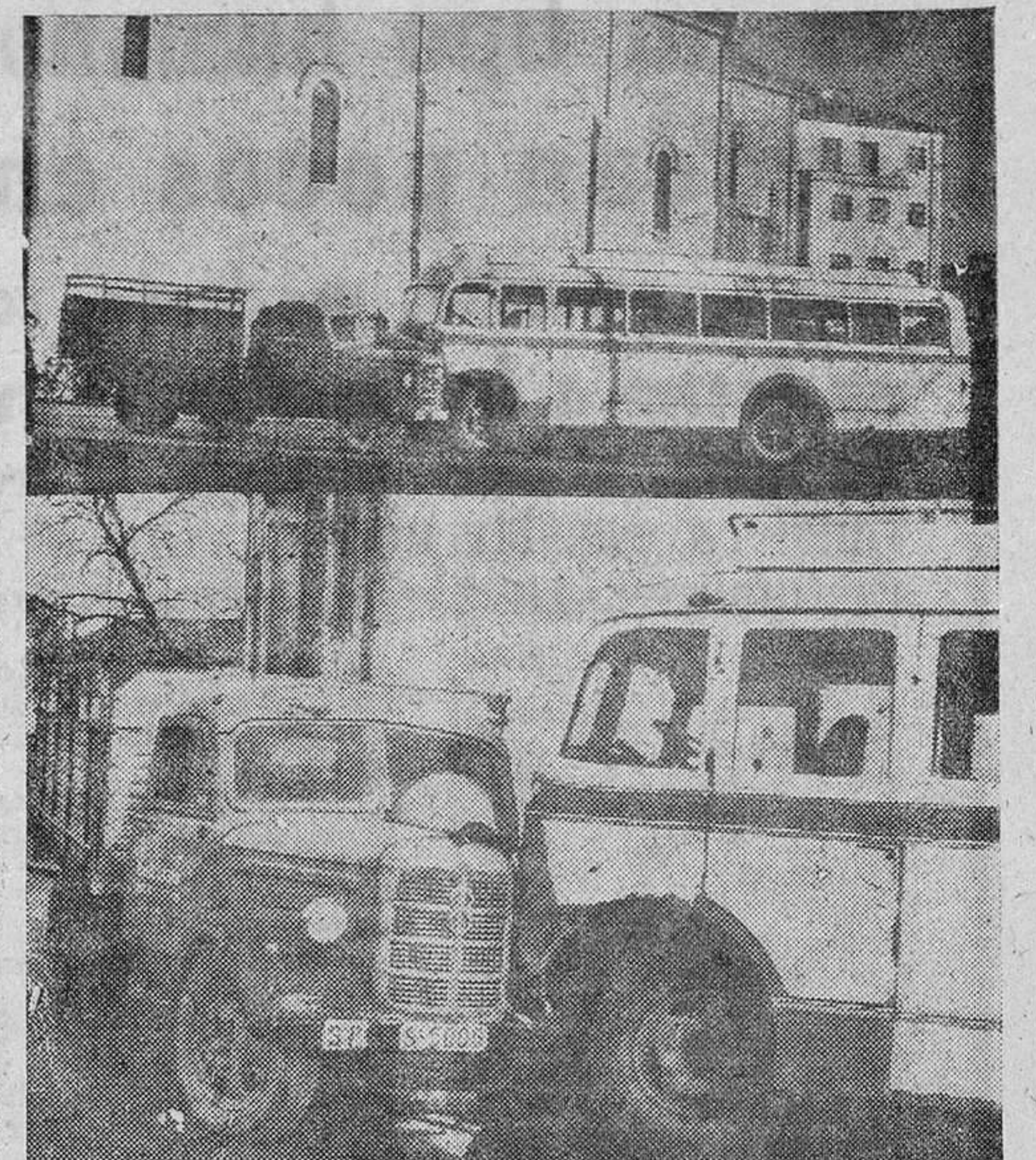
La "foto" de arriba nos muestra, más que el encontronazo entre el camión y el autobús, el lugar justo donde se produjo el choque...

Sobre las doce y media de la mañana de ayer se produjo un violento choque de automóviles frente a la iglesia de San Lázaro, nos habiendo que lamentar desgracias personales.