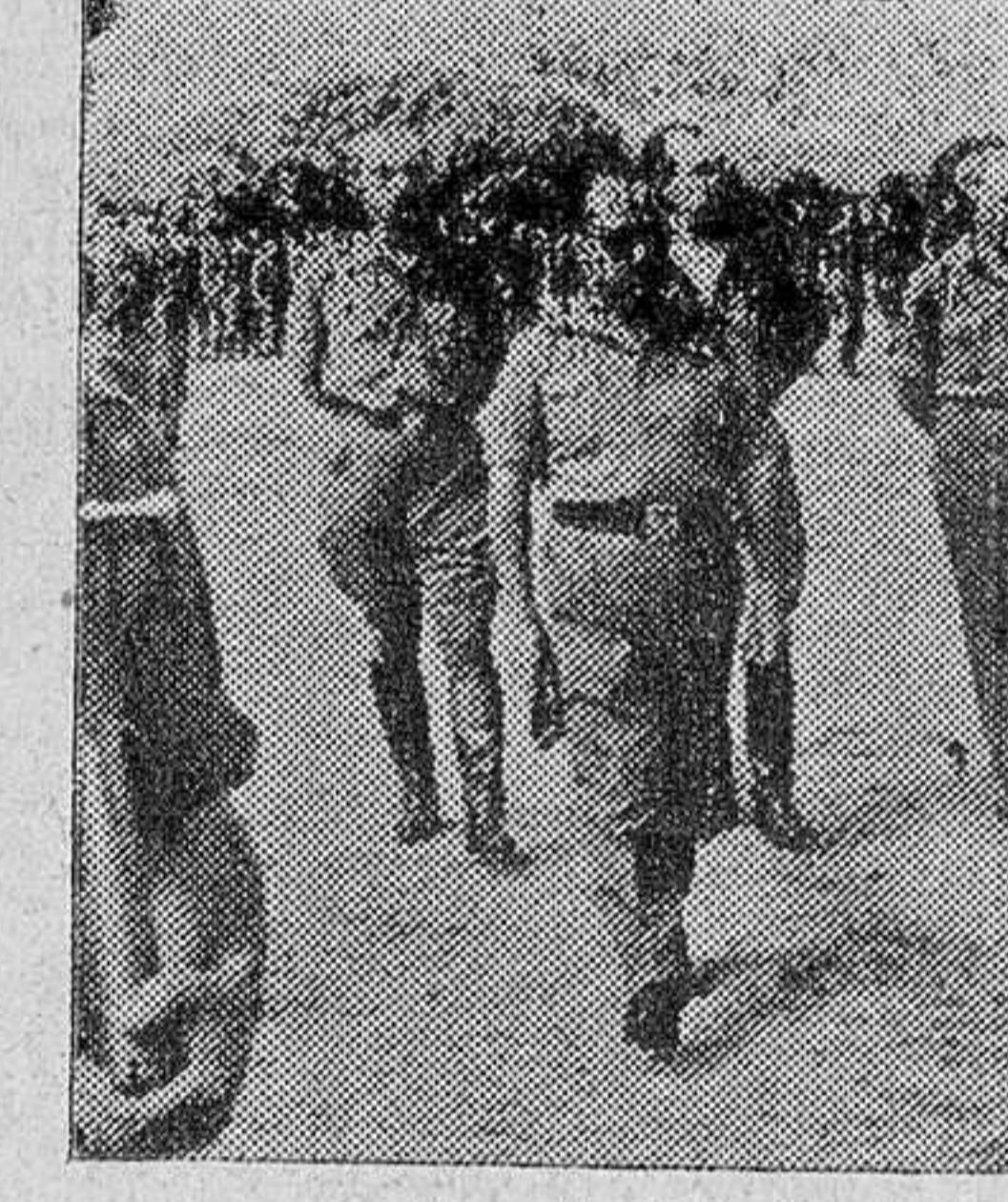
La presidencia del desfile procesional.

cabos gastadores. Detrás, presidiendo, el coronel jefe, teniente coronel, comandante mayor y demás altos mandos. Un coro de cadetes navarros, muy bien acordado, por cierto, interpretó diversos cantos gregorianos. Cerraban la comitiva la Banda de música y una compañía de veteranos rindiendo honores. A la terminación del desfile procesional fué impartida la bendición en medio de un impresionante silencio, mientras la Banda traducía el himno nacional. Una lástima fué que el tiempo no acompañara al esplendor de los