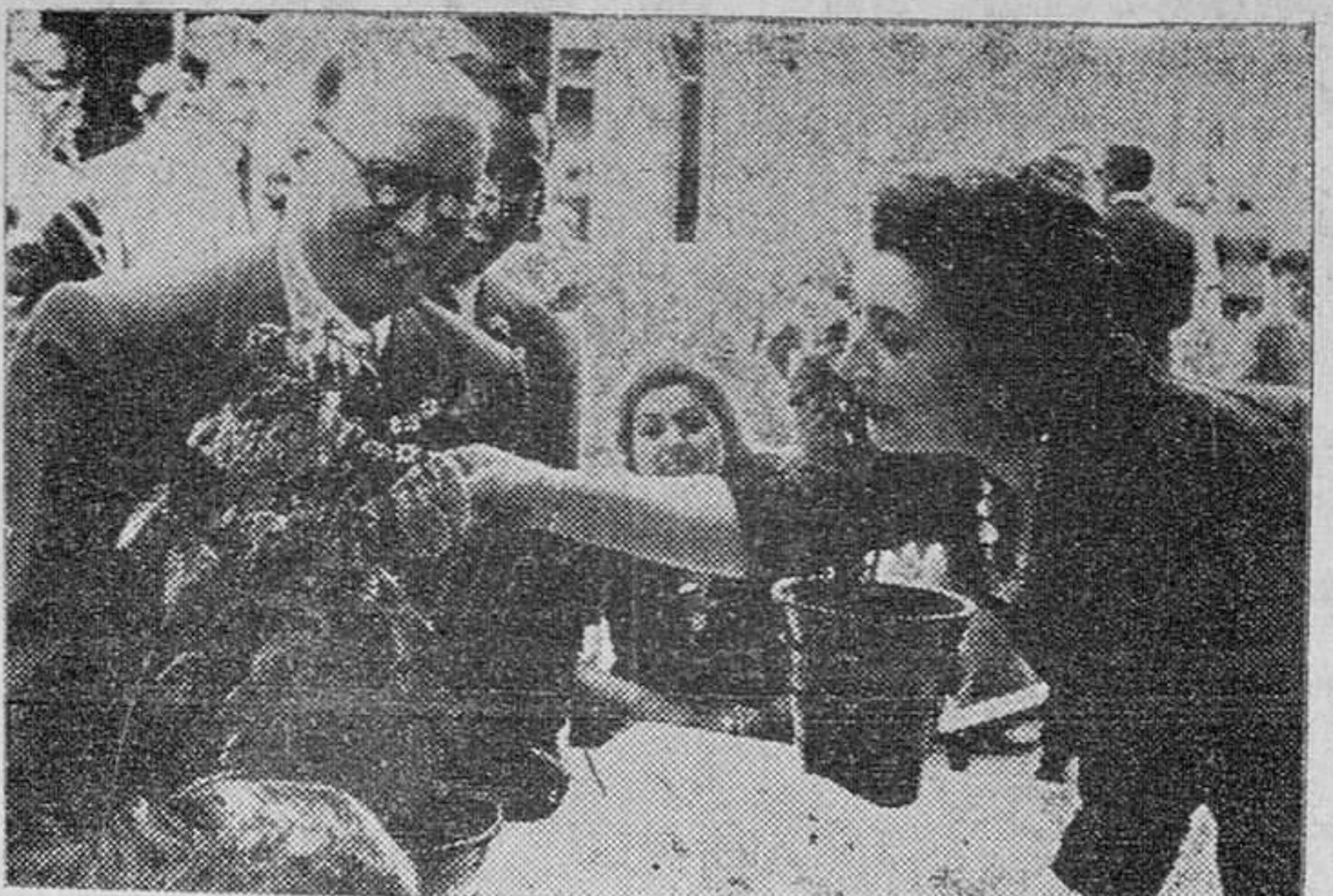
La esposa del Gobernador Civil, prende a éste la banderita.