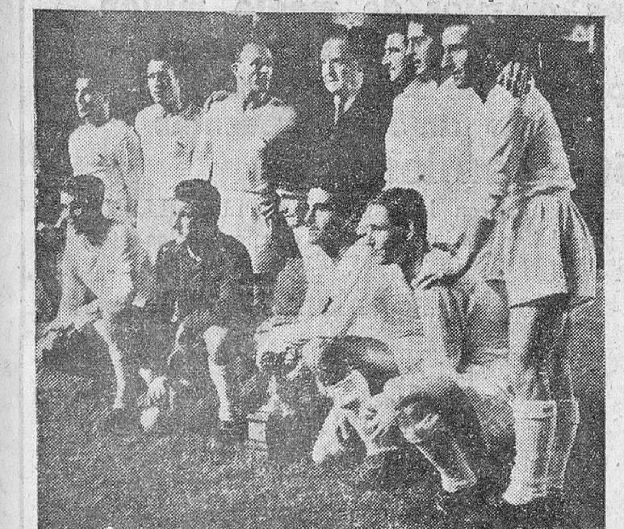
MADRID.—El equipo del Real Madrid, ganador de la Copa Latina, fotografiado con el presidente del club, don Santiago Bernabéu, momentos después de recibir el preciado trofeo al vencer al Benfica por 1-0.