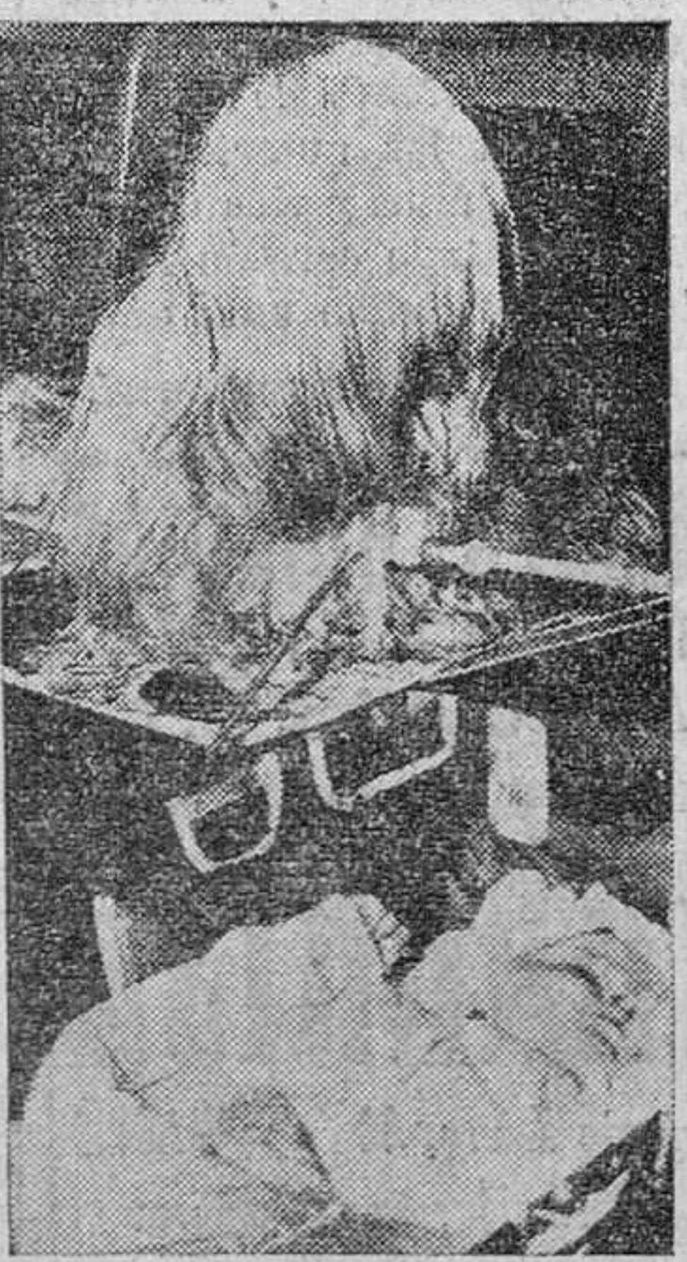
Este perro, que parece guardar el sueño del niño, es un campeón de su raza y se llama "Lasha Apso". Está muy cotizado y hace poco que llegó a Nueva York. Viene a tomar parte en una exposición de la gran urbe, en el Kennel Club.