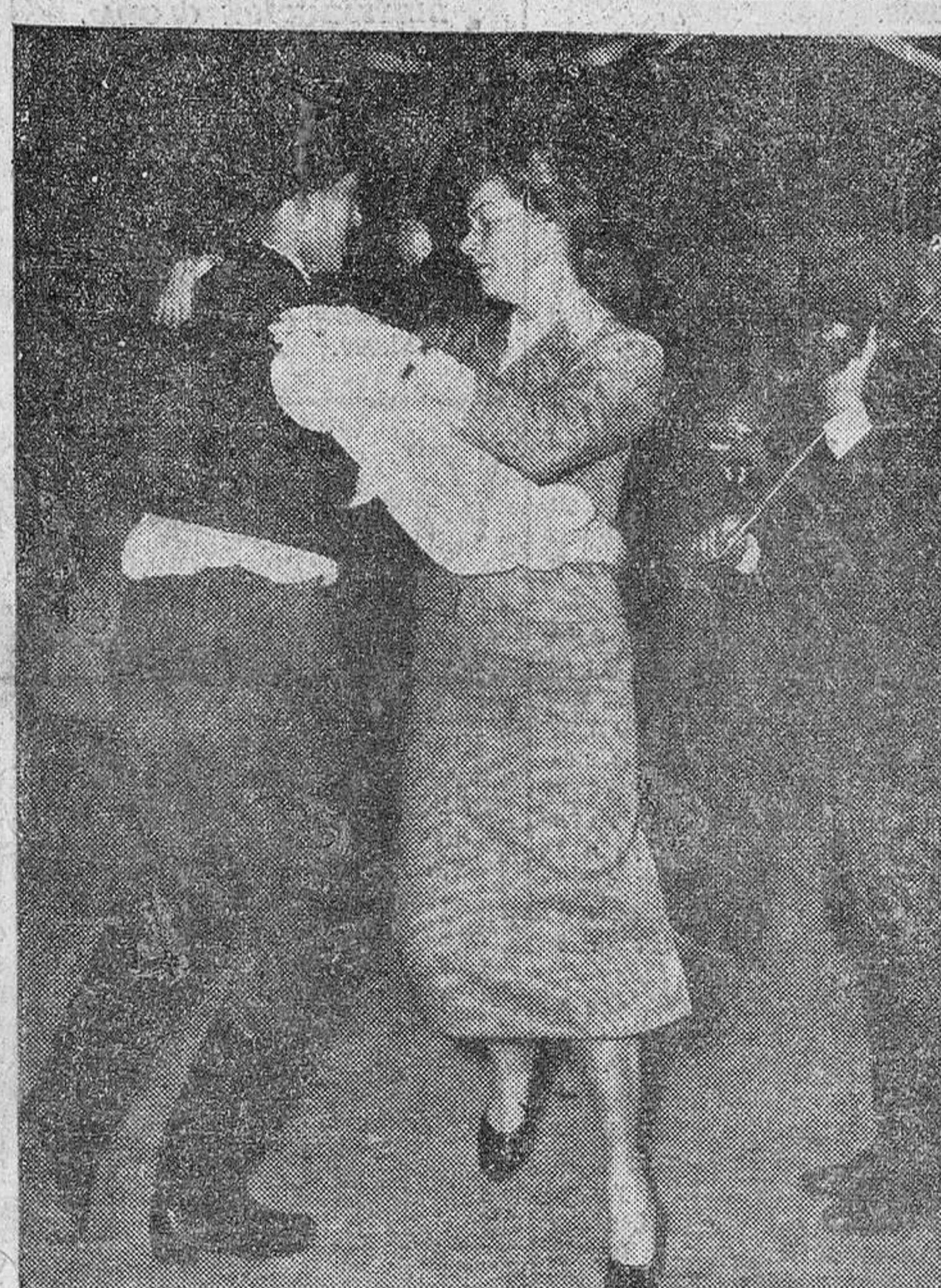
Dos parejas de húngaros se han casado en París. Aprovechando la llegada del Ballet magiar, Ingrid Bergman, que era una de las invitadas a la ceremonia, baila las czardas con uno de los recién casados.