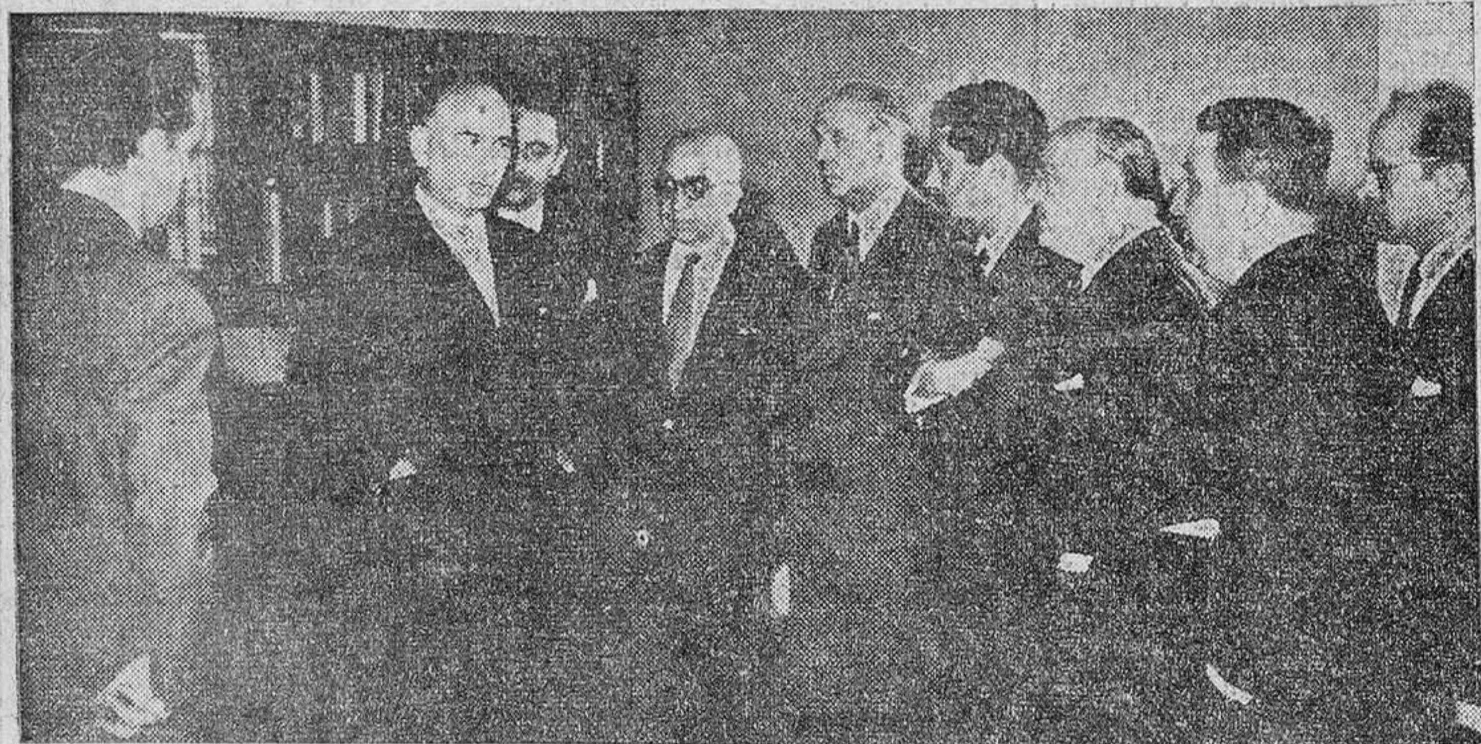
MADRID.—El Ministro de Arquitectura y Vivienda, señor Arrese, durante su importantísima conferencia de Prensa ante los informadores de las agencias y periódicos madrileños, en la que señaló, entre otras cosas, la realización del proyecto para la construcción de sesenta mil viviendas en un año dentro del ámbito nacional.

Expone los problemas esenciales de su Departamento Y el plan de realizaciones que piensa acometerse rápidamente