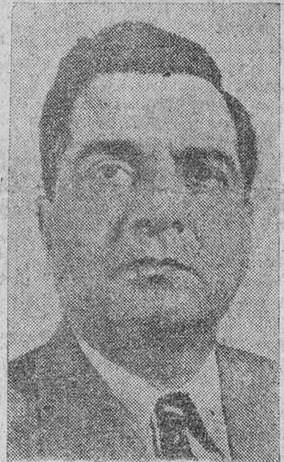
El presidente del Pakistán, mayor general Iskander Mirza.

EL SEQUITO ESPAÑOL. Ha sido designado el séquito español de Sus Excelencias el Presidente de la República Islámica del Pakistán y la señora de Mirza. Estará integrado por