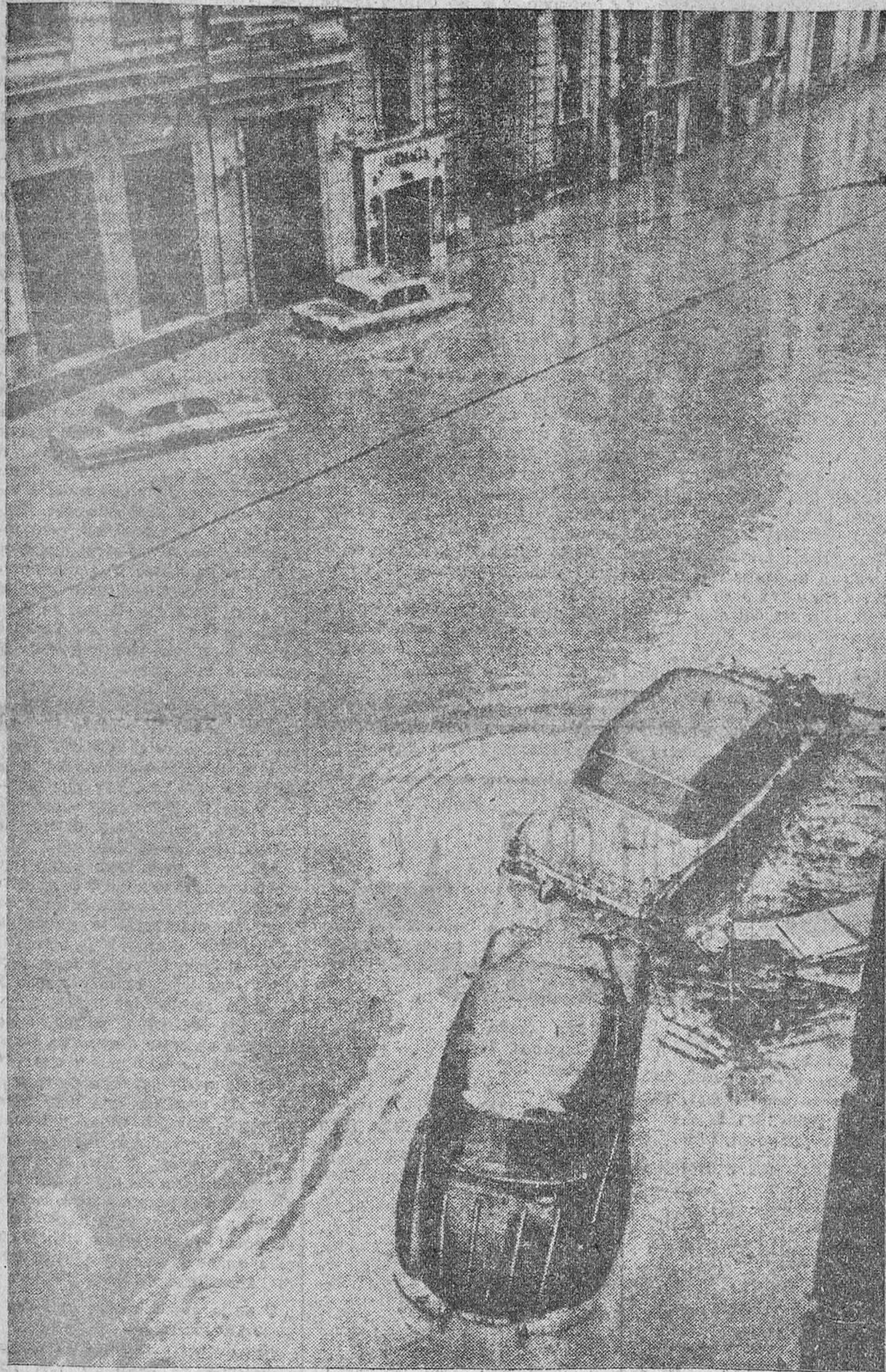
DESOLADOR ASPECTO DE LA CALLE DE PINTOR SOROLLA, EN VALENCIA

Los ministros Secretario General, de Obras Públicas, de Agricultura y de Industria, han recorrido las zonas afectadas por la catástrofe