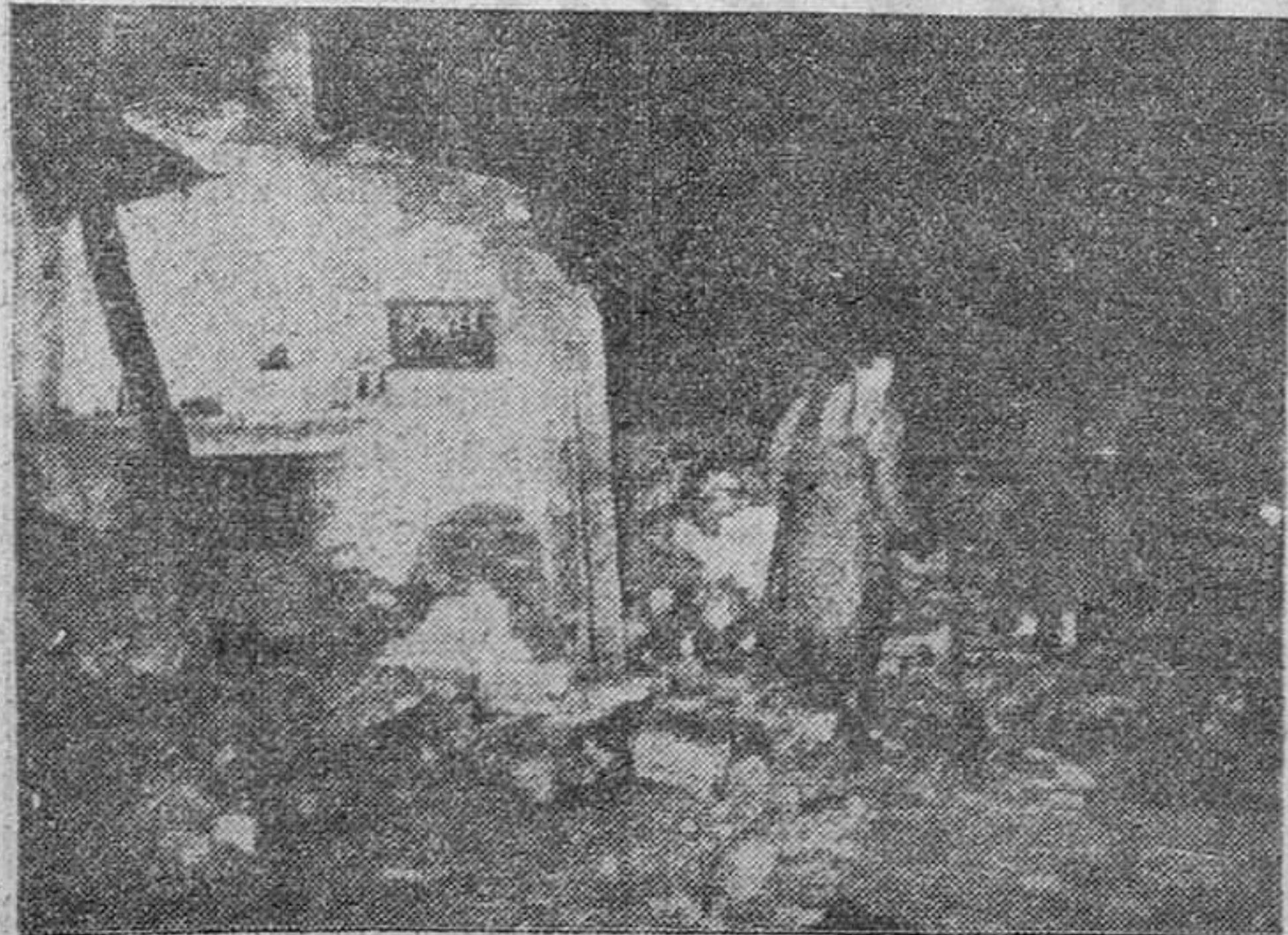
Coches deshechos, ruinas, desolación. Ese es el triste panorama.