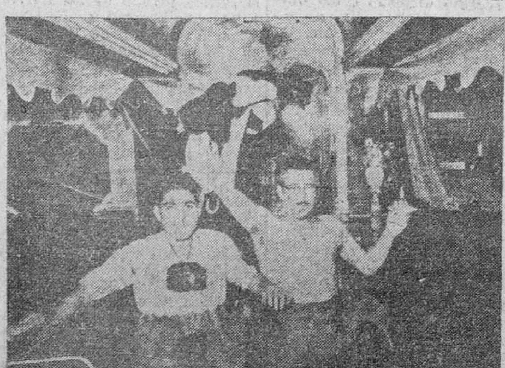
Con el agua a la cintura en un establecimiento.

"La vitalidad católica de una nación se mide por los sacrificios de que es capaz por la causa de las Misiones." (Pío XII). 120 de octubre, DOMUND POB UN MUNDO MEJOR!