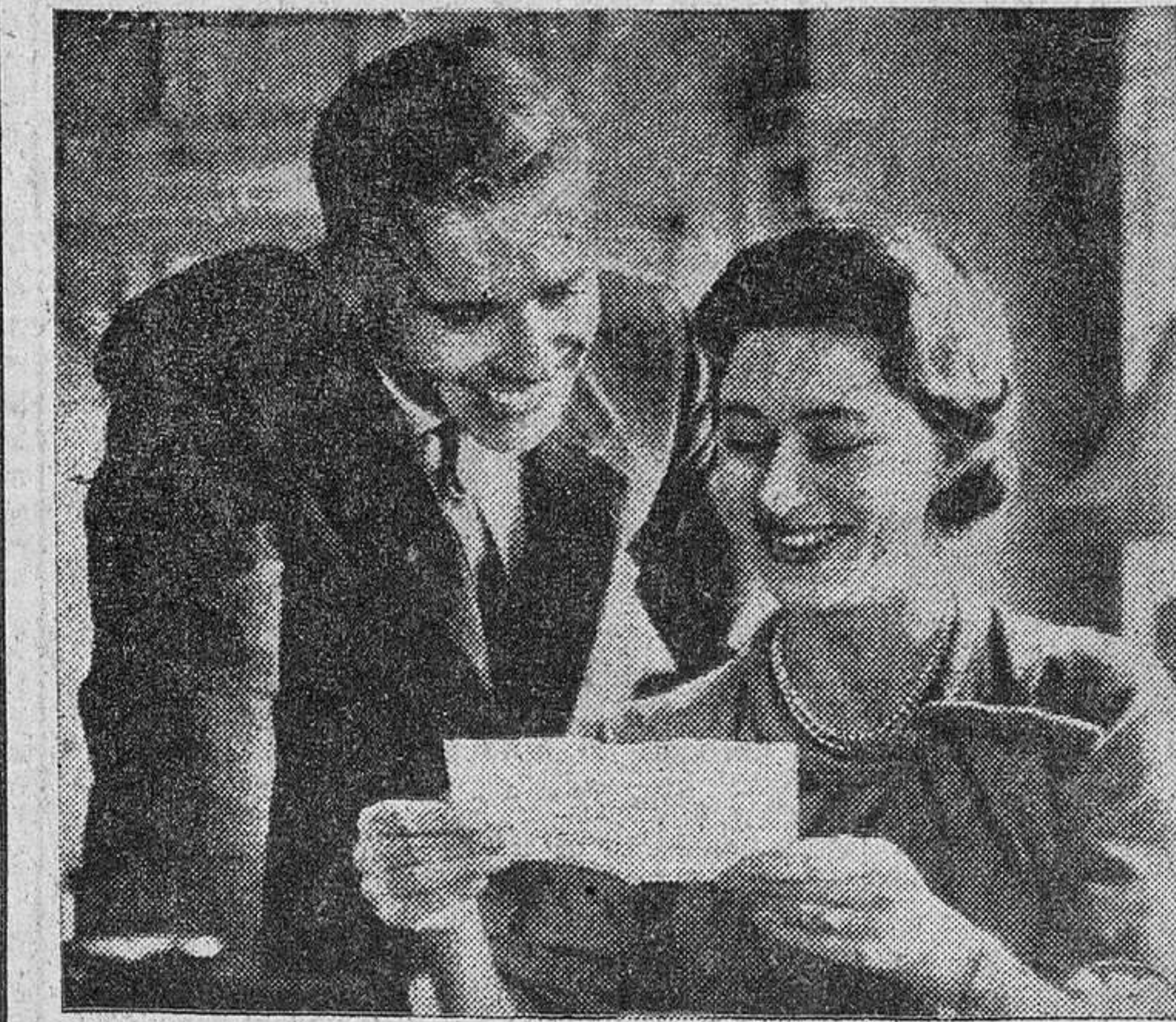
La princesa Margarita y su esposo, representantes de Inglaterra en las ceremonias de la independencia de Jamaica.

En septiembre se celebró este plebiscito en Jamaica, y por 251.935 votos contrarios por 216.400 favorables fue rechazada la asociación con el resto de la Federación.