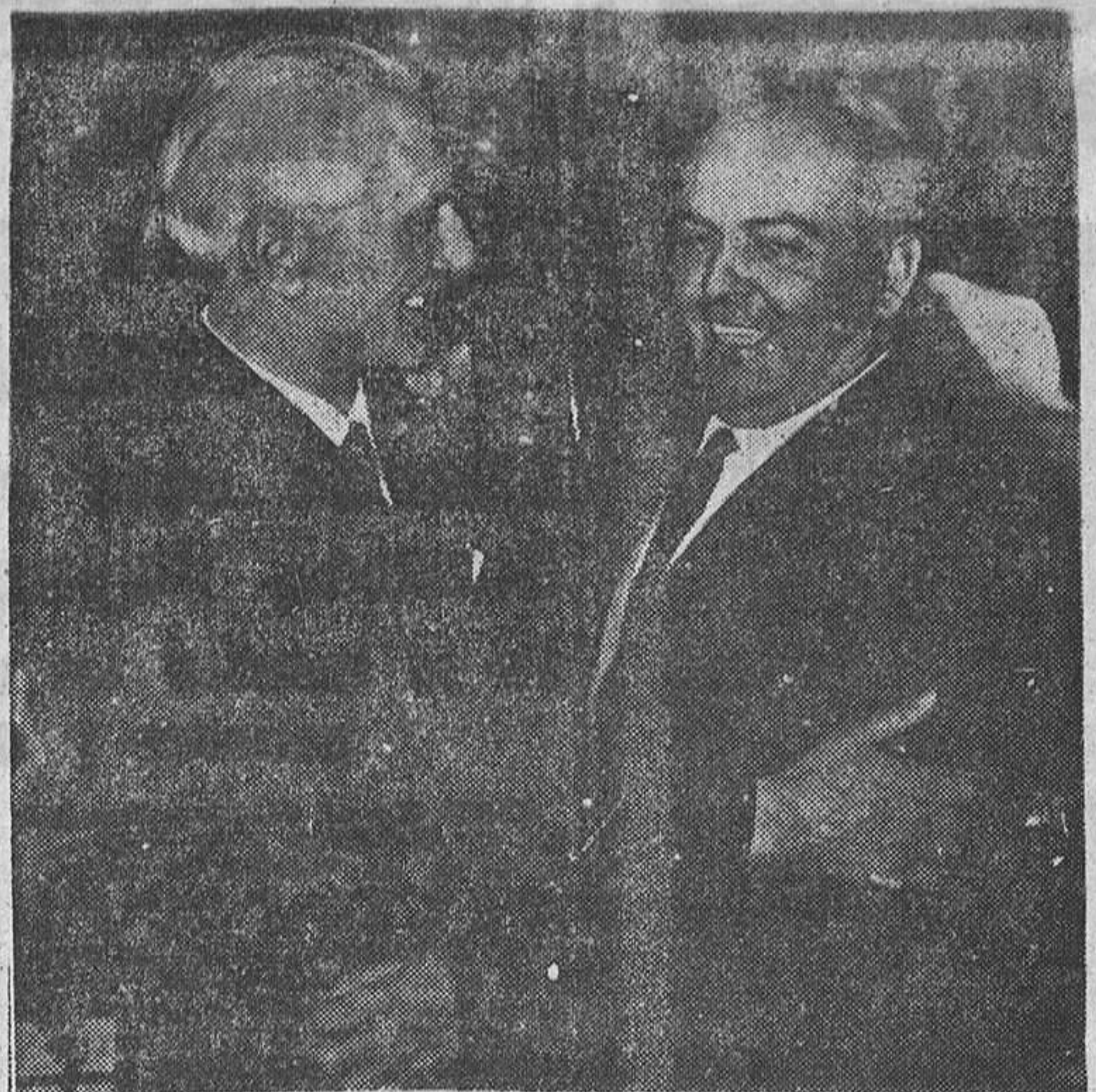
MADRID.—El delegado nacional de Educación Física y Deportes, Elola, impuso al ministro secretario general del Movimiento, Solís Ruiz, la insignia distinguida de la Agrupación Ciclista Madrileña. Al acto asistió el Gobernador Civil de esta provincia.