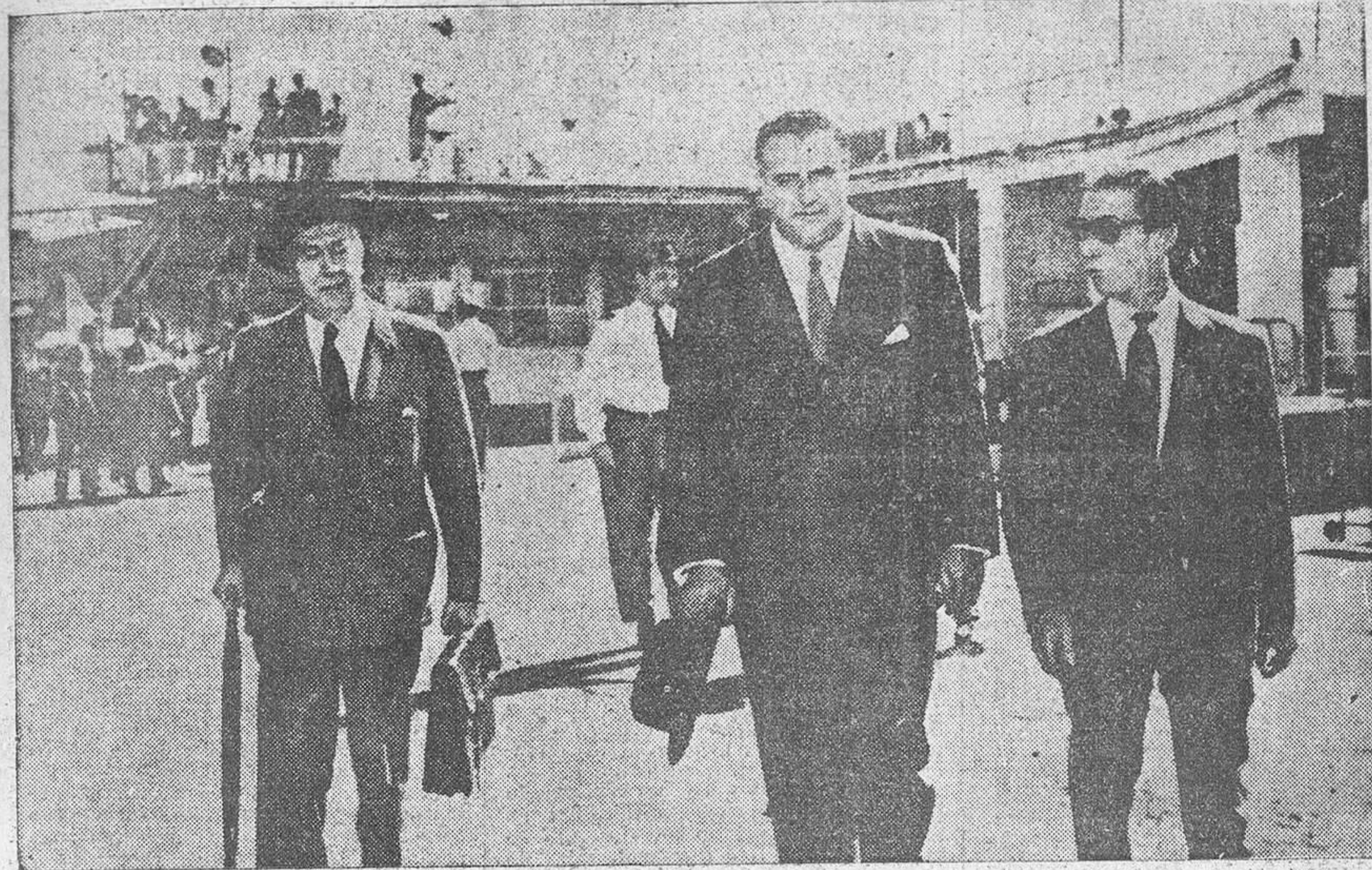
El ministro de Asuntos Exteriores, señor Martín Artajo, en el aeropuerto de Barajas, se dirige hacia el avión que le condujo a Londres, donde asistirá a la conferencia convocada por el Gobierno británico para tratar nuevamente sobre la cuestión del Canal de Suez.

Martín Artajo propone negociar con Egipto para salvaguardar los derechos de todos los interesados LA SUGESTION RUSA DE UNA NUEVA REUNION, RECIBIDA FRIAMENTE EN WASHINGTON