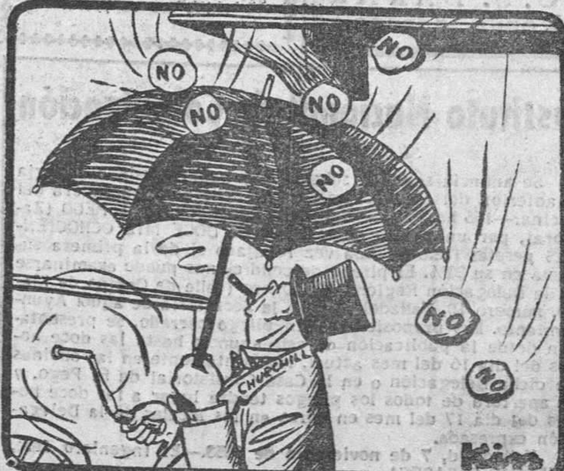
—¡Para qué te voy a dar más vueltas! ¡Ya está bien claro que me mandan con la música a otra parte!