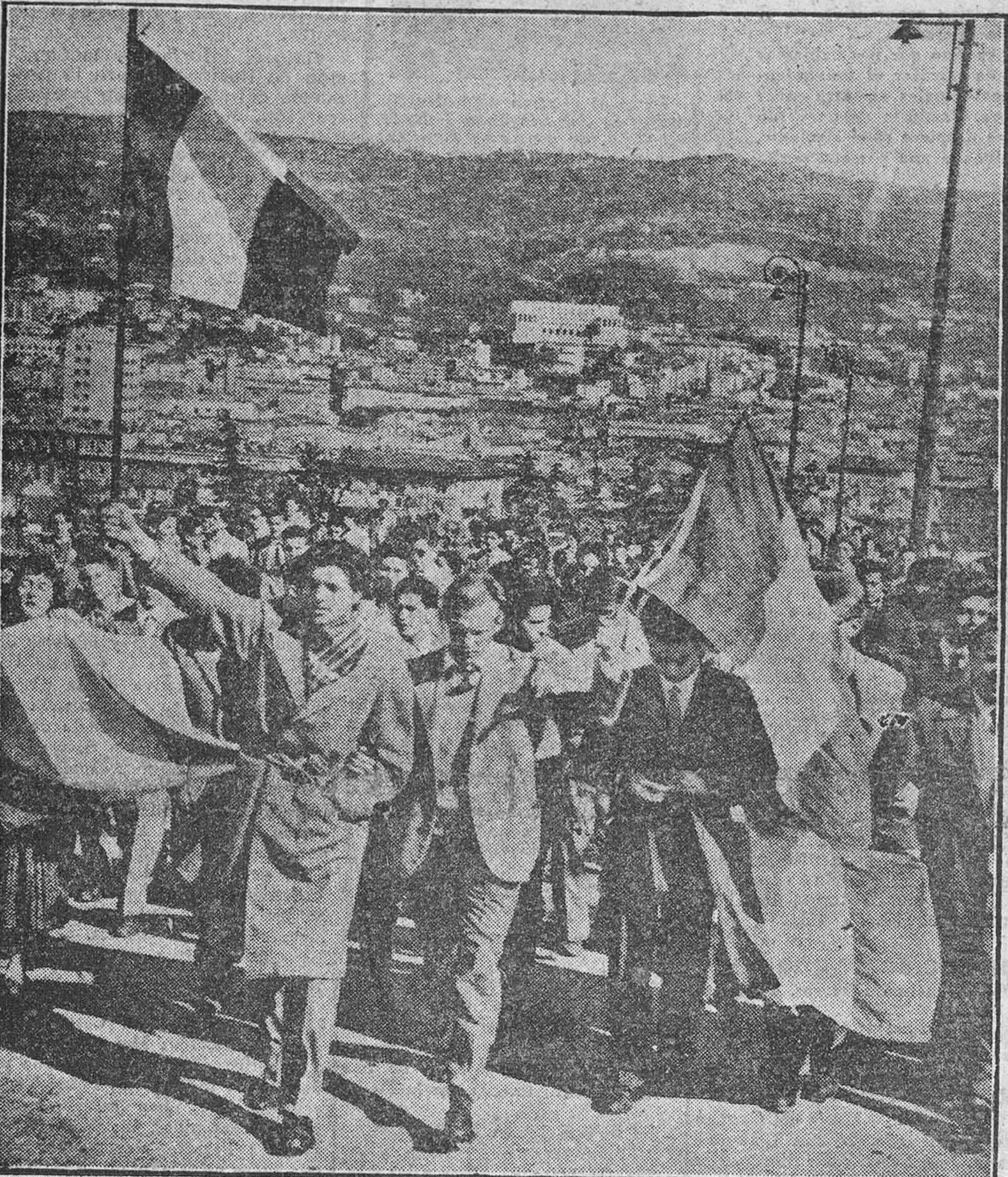
He aquí una de las manifestaciones, que degeneraron en batalla campal con la policía, de los estudiantes italianos pidiendo la incorporación de Trieste a Italia.